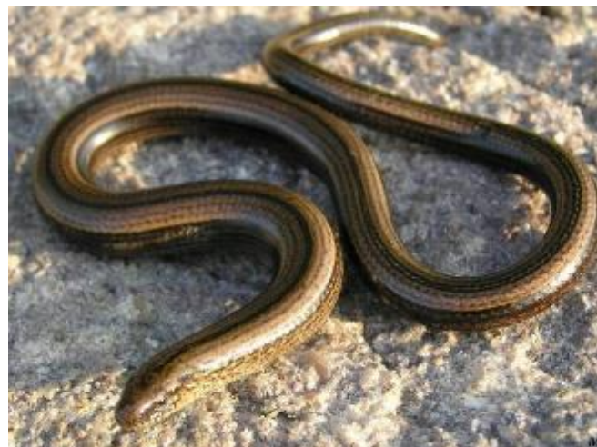
Slika 14: Slepec