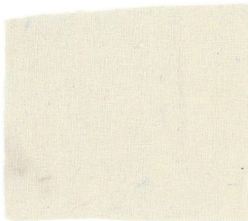
Slika 26: Osnovna tkanina za obleko iz bombaža

Za svojo obleko sem uporabila tkanino iz 100 % bombaža, za aplikacijo pa plisiran bombaž.