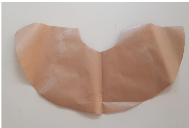
Slika 42: Izhodiščni kroj za nadaljnje modeliranje gub na prednjem delu aplikacije