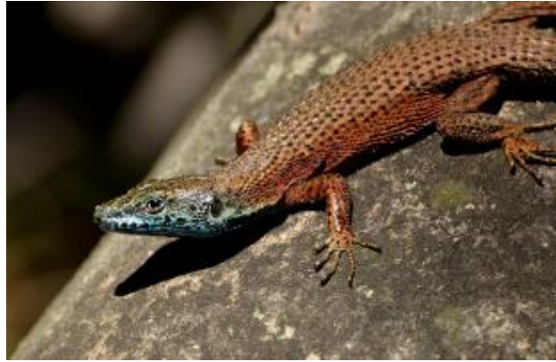
Slika 15: Črnopikčast kuščar