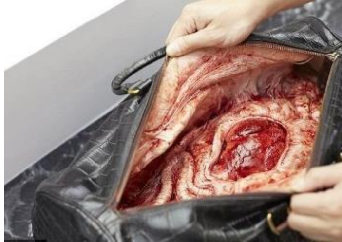
Slika 25: Torbica z umetnimi živalskimi organi