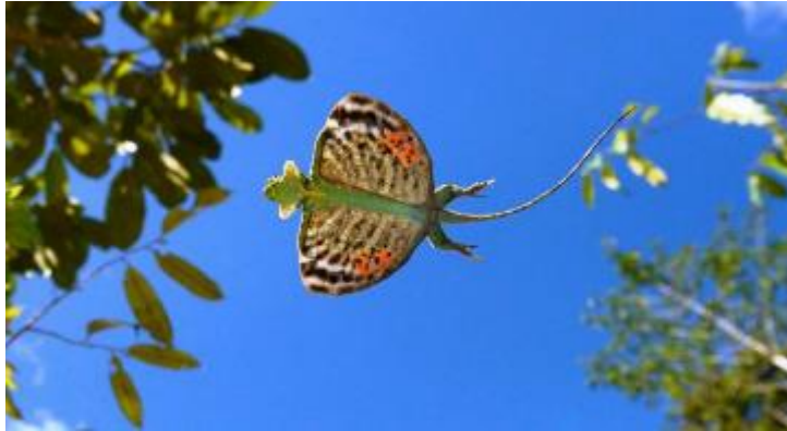
Slika 20: Leteči zmaj

verjamejo, da so te zanimivi kuščarji strupeni, jih ne jedo. Najverjetneje ravno zato ne spadajo med ogrožene vrste. (5)