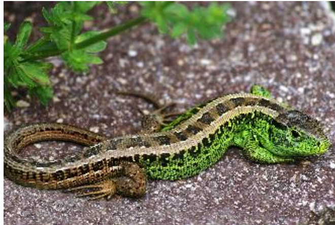
Slika 13: Martinček