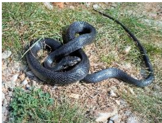
Slika 3: Črnica (vir: https://www.primorske.si/plus/7-val/resevanje-mlade-kace , 25. 11. 2019)