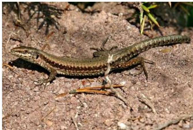
Slika 16: Pozidna kuščarica