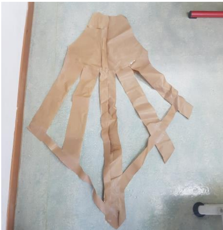
Slika 39: Modeliran kroj zadnjega dela obleke (lasten vir)