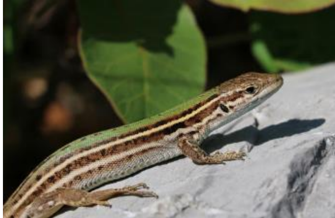
Slika 17: Kraška kuščarica