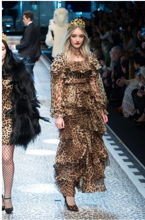
Slika 34: Dolce & Gabbana, kolekcija 2017