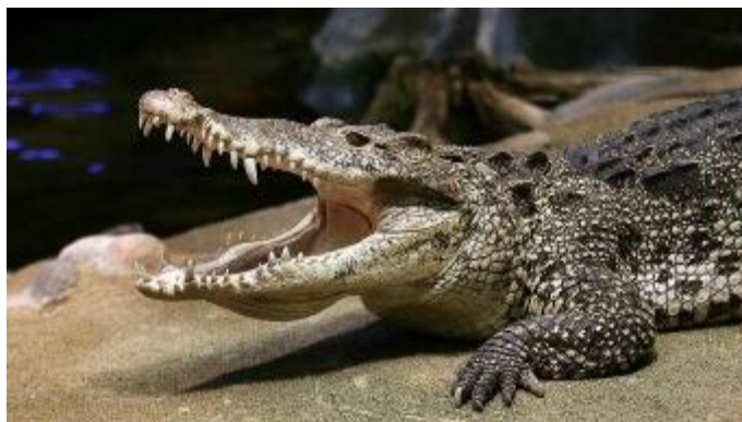
Slika 8: Krokodil