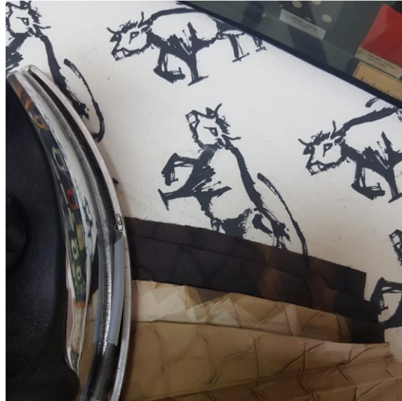
Slika 44: Likanje aplikacije (lasten vir)