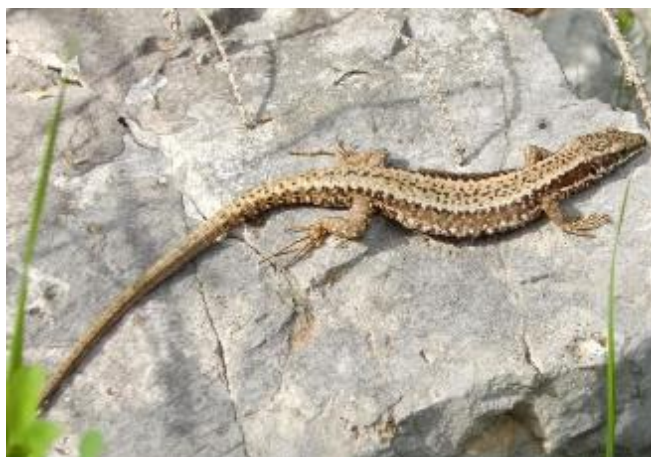
Slika 18: Horvatova kuščarica