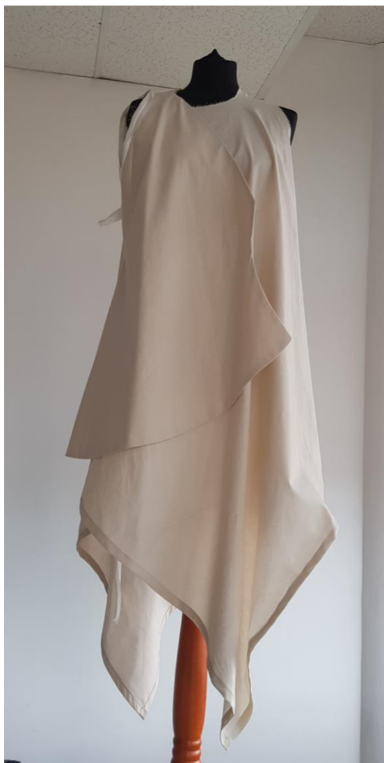
Slika 43: Obleka v postopku izdelave