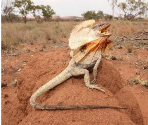
Slika 23: Kuščar ovratničar

parjenje in nato se začne snubljenje. Jajca se oplodijo v telesu živali. Iz jajc se mladiči izležejo po osmih do dvanajstih dnevih. Po leženju jajc samica ne skrbi zanje in za svoje mladiče, zato so takoj, ko se izležejo, samostojni.