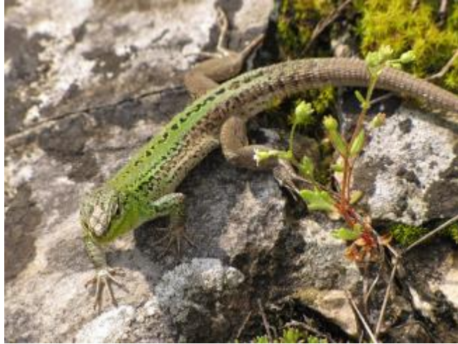
Slika 19: Primorska kuščarica

Kuščarji, ki živijo v Sloveniji, pripadajo dvema družinama. Družina kuščarice (Lacertidae) je zastopana z 9 vrstami, v družino slepcev (Anguidae) spada le slepec.