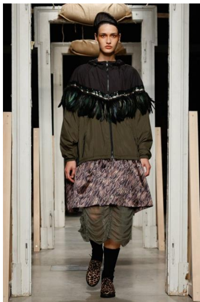
Slika 32: Antonio Marras, kolekcija 2019 (vir: https://www.designscene.net/wp-content/uploads/2018/09/Antonio-Marras-SS19-18-620x930.jpg , 18.1.2020)

Živalski vzorci, pa so bili tudi marsikateremu modnemu oblikovalcu navdih za svojo kolekcijo. Na primer Antonio Marras je v svoji kolekciji, leta 2014, na voluminozne kroje dodal motiv skrivnostnih ter ogroženih volkov. Poigral se je s simetrijo ter asimetrijo potiskov, zgornjim dolgim delom oblačil dodal široke rokave, spodnjim oblačilom pa pripisal različno dolžino. V kolekciji so izstopali tudi dolgi puloverji, ki so glavni in najvpadljivejši izdelki. Seveda na njih kraljuje motiv volka, družbo pa mu delajo različni ostali vzorci.