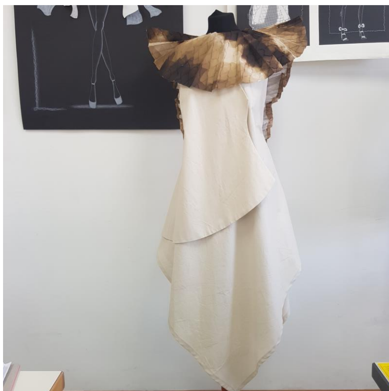
Slika 47: Gotov videz