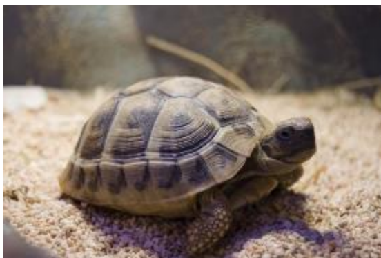
Slika 6: Grška želva