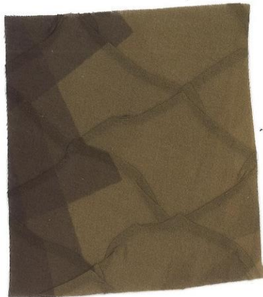
Slika 27: Osnovna tkanina – plise za aplikacijo iz bombaža

Bombaž so naravna vlakna. Pri predelavi bombaža se izgubi samo približno 10 % surove teže. Ko odstranijo vosek, beljakovine in ostale rastlinske ostanke, ostane naraven polimer celuloze. Posebna ureditev celuloze daje bombažu veliko odpornost proti trganju vlaken. Vsako vlakno je sestavljeno iz 20–30 plasti celuloze v spiralni zgradbi. Ko se kosmič bombaža odpre, se vlakna posušijo in prepletejo med seboj. To lastnost uporabljajo za predenje zelo tankih niti.