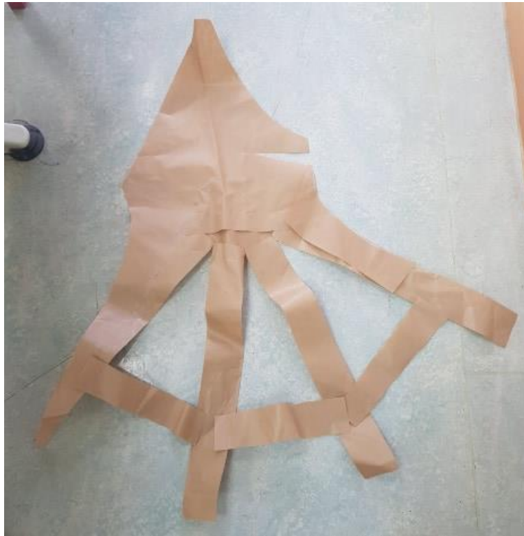
Slika 40: Modeliran prednji zgornji vstavek obleke (lasten vir)

Po končanem modeliranju krojev je sledilo krojenje obleke. Osnovo obleke ter prednji vstavek sem krojila iz bež tkanine. Kroje sem položila na blago, jih obrisala, dodala dodatke za šiv ter ukrojila posamezne krojne dele.