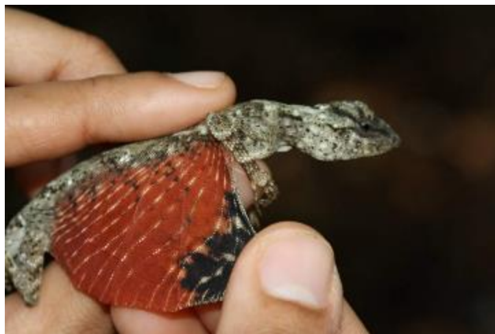
Slika 21: Krila letečega zmaja