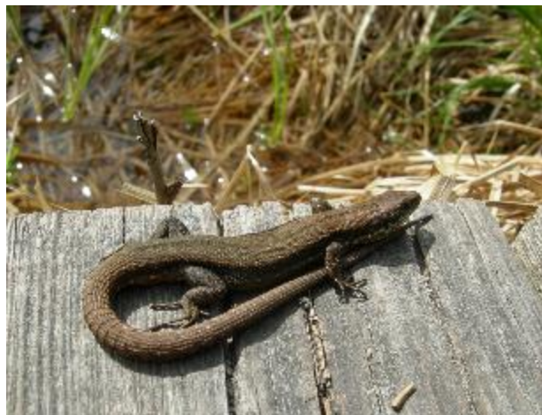
Slika 12: Živorodna kuščarica