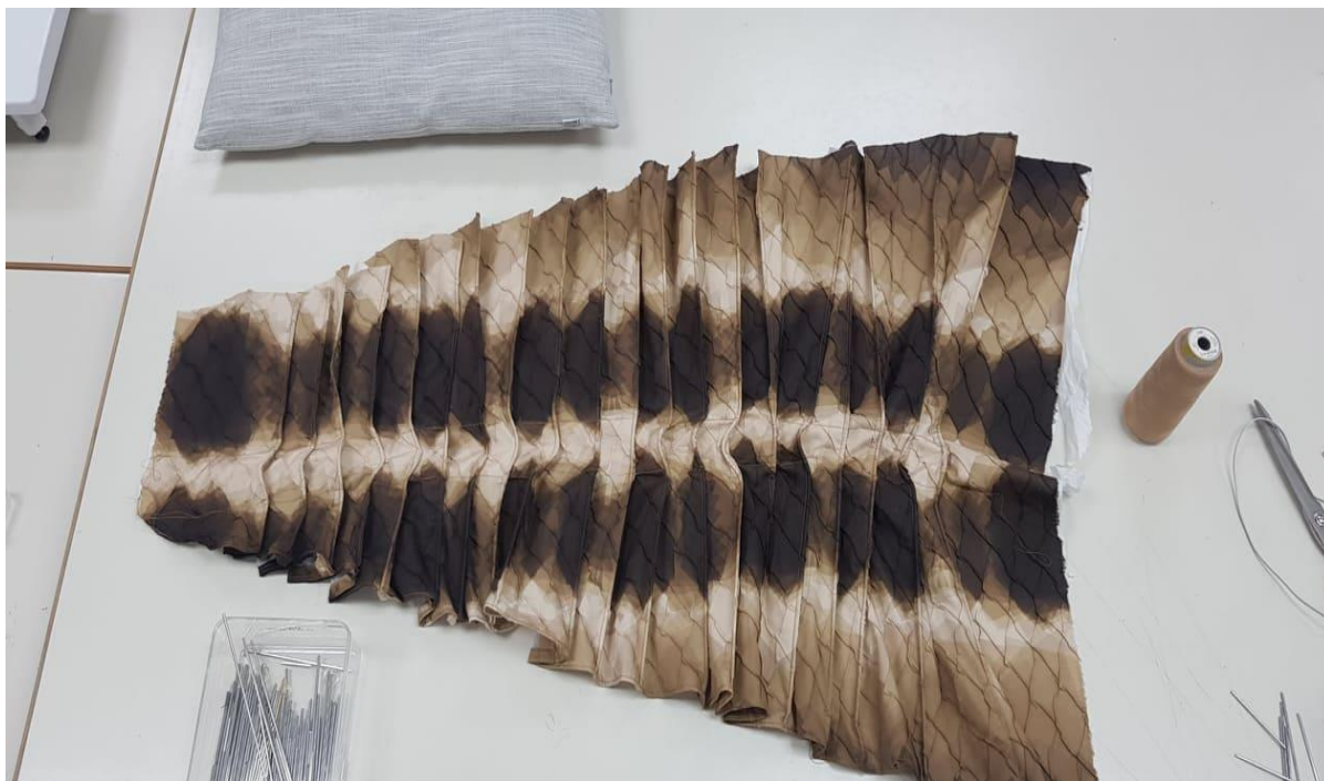
Slika 41: Zadnji del aplikacije »hrbtenica«

Prednji del aplikacije sem izdelal na podoben način, le da so gube v področju vratnega izreza ožje kot na zunanjem robu, s čimer sem ustvarila videz pahljače. Prav prednji del aplikacije nima vstavljenih žic. Aplikacijo na prednjem delu sem za razliko od zadnjega dela krojila po kroju (slika 36) in ne s postopkom drapiranja na lutki. Del aplikacije sem sestavila na ramenih, pri čemer se pazila na nadaljevanje in ujemanje vzorca oz. raporta. Na drugem delu sem prišila ročne pritiskače ter s tem omogočila oblačenje in nameščanje aplikacije na obleko. Prav tako sem obdelala še robove.