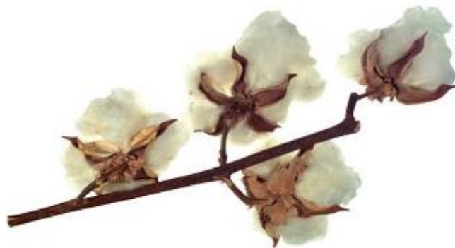
Slika 28: Bombaževец

Bombaž slovi po svoji udobnosti in mehkobi. Je naravno vlakno z odličnimi lastnostmi. Bombaž ohranja kožo hladno, absorbira tekočine, ki izhlapevajo iz telesa in jih nato izpušča nazaj v okolje. (11)