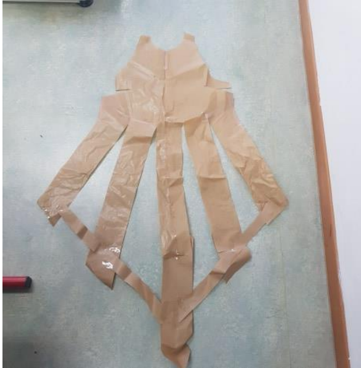
Slika 38: Modeliran kroj prednjega dela obleke (lasten vir)