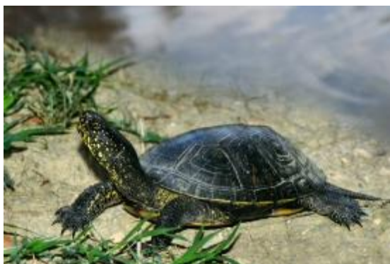
Slika 7: Močvirska sklednica