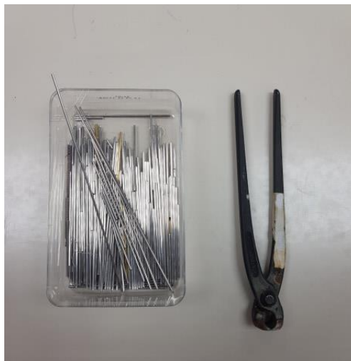
Slika 29: Aluminijaste žice

Belo žindro iz proizvodnje primarnega aluminija in procesov recikliranja, ki še vedno vsebuje znatne količine aluminija, se lahko na industrijski način predela v aluminij. V tem procesu nastala žindra je zelo kompleksen odpadni material, s katerim je težko ravnati. Reagira z vodo, pri čemer nastaja mešanica plinov, med njimi vodik, acetilen in amonijak, ki se na zraku spontano vžge. Žindra se kljub omenjenim težavam uporablja kot polnilo za asfalt in beton. (12)