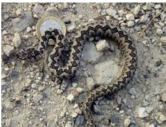
Slika 5: Modras (vir: https://www.lokalne-ajdovscina.si/article/2018060717443851/modras-ugriznil-petletno-deklico-na-vilh-arjevi-ulici-v-ajdovscini/ , 25. 11. 2019)