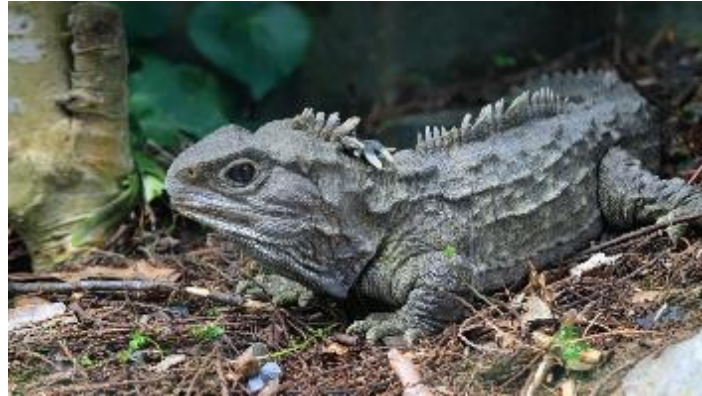
Slika 10: Tuatara

od ostalih vrst. Kot prvo, ima nizko stopnjo presnove, v nasprotju s plazilci pa uživa v nižjih temperaturah. (6)