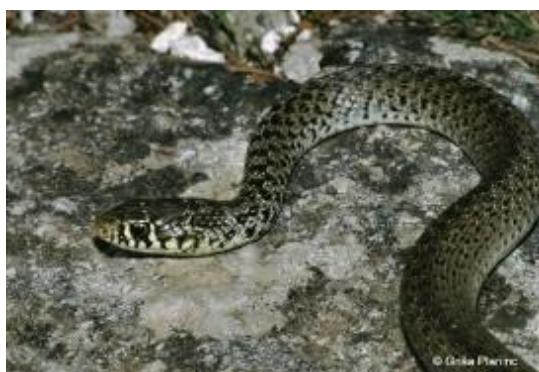
Slika 4: Belica (vir: https://sites.google.com/site/plazilcislovenijejihpoznamo/nasi-plazilci/belica , 25. 11. 2019)