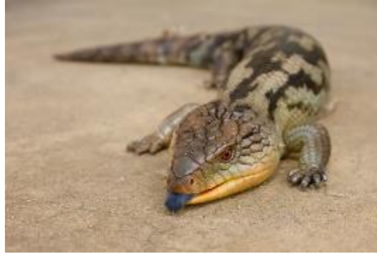
Slika 1: Kuščar