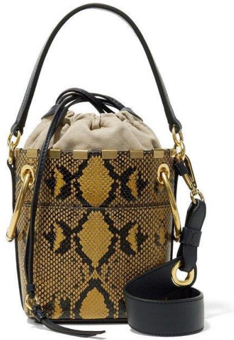
Slika 31: Torbica s kačjim vzorcem (vir: https://www.abouthere.com/sites/default/files/2018/08/20/roy_bag.jpg , 18.1.2020)

Živalski vzorci, pa so bili tudi marsikateremu modnemu oblikovalcu navdih za svojo kolekcijo. Na primer Antonio Marras je v svoji kolekciji, leta 2014, na voluminozne kroje dodal motiv skrivnostnih ter ogroženih volkov. Poigral se je s simetrijo ter asimetrijo potiskov, zgornjim dolgim delom oblačil dodal široke rokave, spodnjim oblačilom pa pripisal različno dolžino. V kolekciji so izstopali tudi dolgi puloverji, ki so glavni in najvpadljivejši izdelki. Seveda na njih kraljuje motiv volka, družbo pa mu delajo različni ostali vzorci.