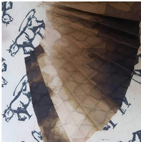
Slika 45: Zgornji del aplikacije