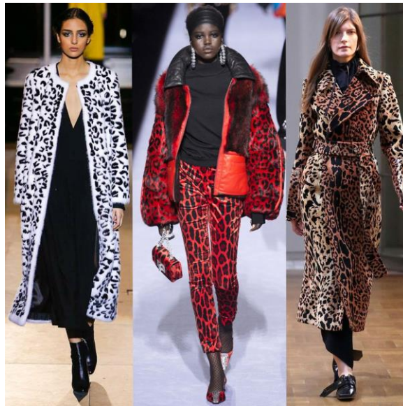
Slika 30: Primer živalskih vzorcev

Pred začetkom izdelave sem naredila analizo trga, s katero sem ugotovila, da na trgu ni toliko modnih izdelkov iz prave živalske kože, kot pa v zgodovini. Večina oblek in ostalih modnih dodatkov vsebuje vzorce plazilcev, najpogostejši so kačji. Seveda pa imamo na tržišču in v trenutnih modnih smernicah veliko število najrazličnejših vzorcev živalske kože