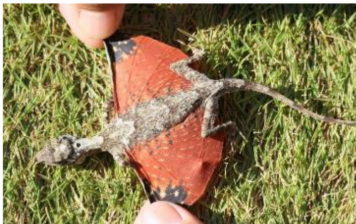
Slika 22: Krila letečega zmaja