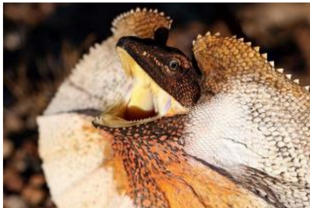
Slika 24: Kuščar ovratničar