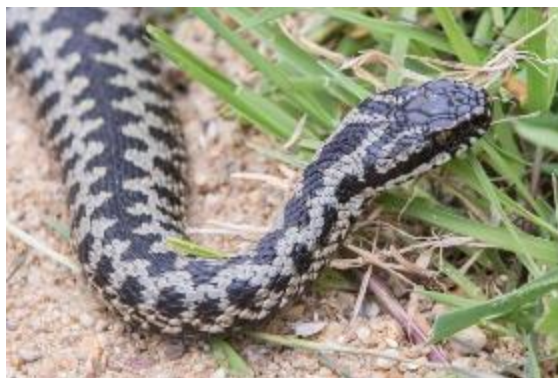
Slika 2: Gad