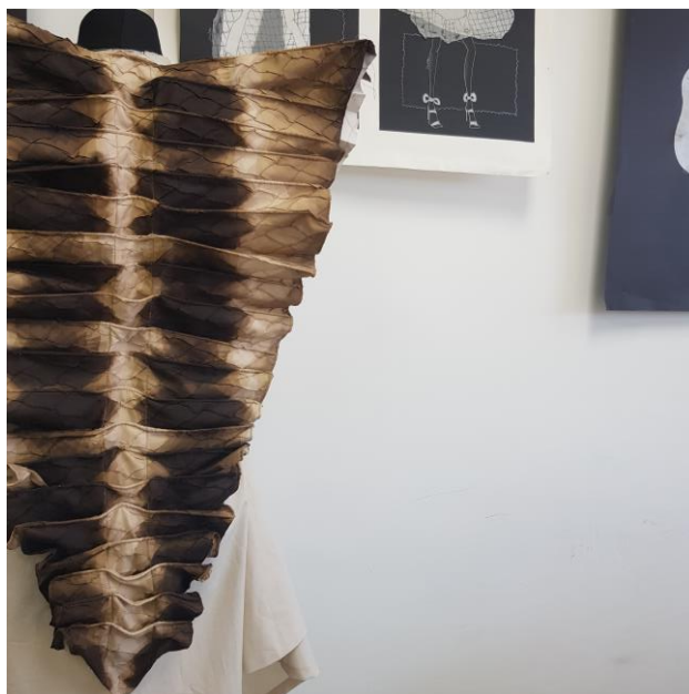
Slika 46: Spodnji del aplikacije (lasten vir)