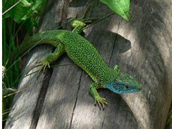
Slika 11: Zelenec