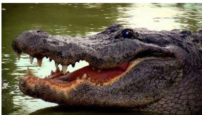
Slika 9: Aligator