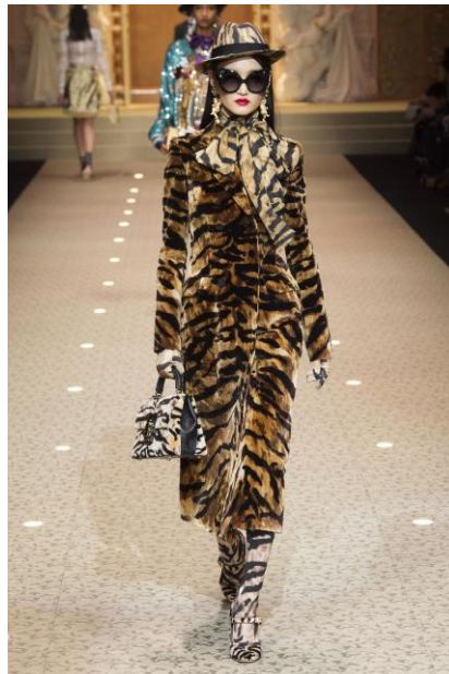
Slika 35: Dolce & Gabbana, kolekcija 2014