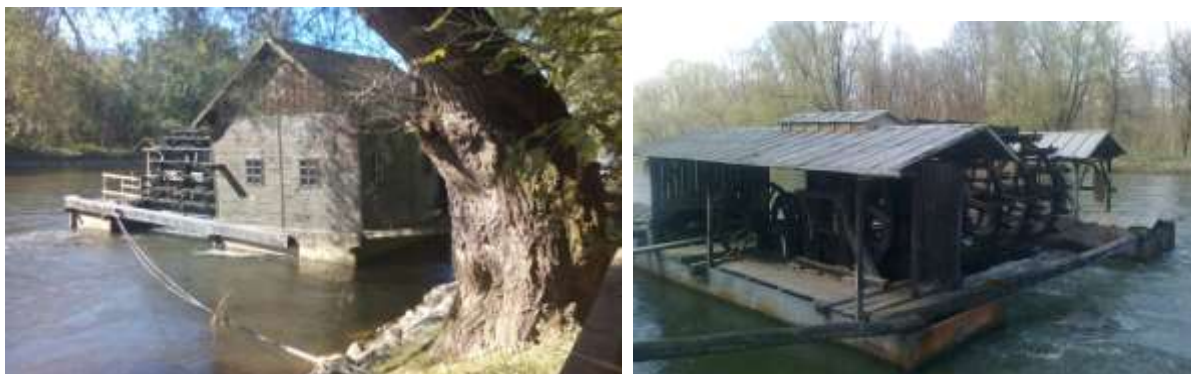
Slika 10: Mlin in mlinsko kolo