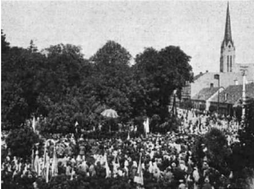
Slika 13: Zborovanje pred cerkvijo v Beltincih (vir: vir: https://www.prekmurjevercu.si/o-prikljucitvi )