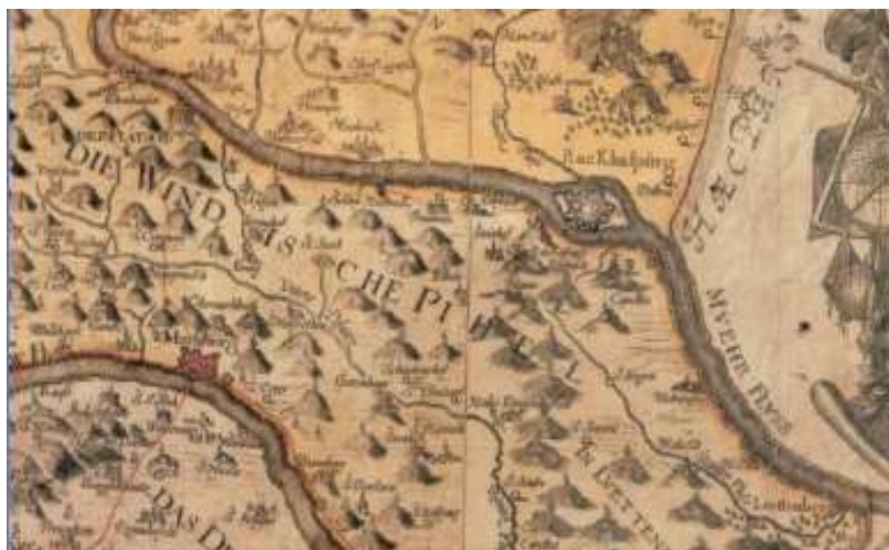
Slika 7: Spreminjanje struge reka Mura skozi čas (vir: http://rekamura.si/post/432638/reka-mura-skozi-cas )