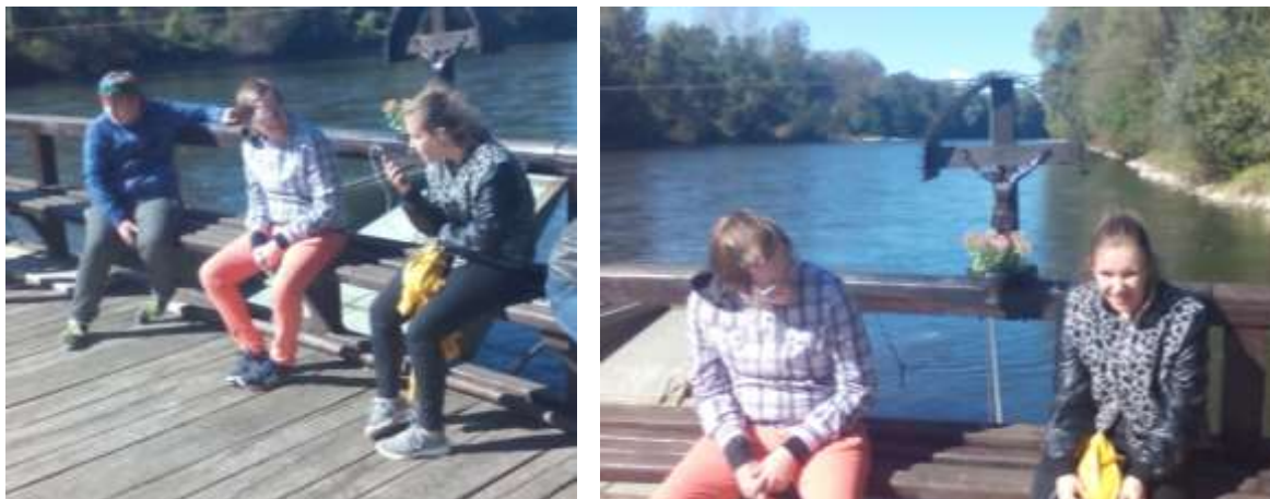
Slika 9: Mlade raziskovalke na vožnji z brodom po Muri

Poleg številnih živali in rastlin krasijo reko Muro še plavajoči Babičev mlin in štirje brodi, s katerimi se lahko popeljem po tako imenovanem »biseru Evrope«.