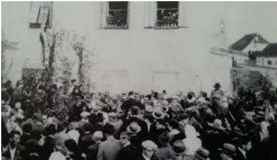
Slika 11: Zborovanje v Gornji Radgoni, 26. december 1918

Prizadevanja po združitvi s Kraljevino SHS in ostalimi Slovenci je bila med narodno zavednimi prekmurskimi Slovenci vselej močnejša. Prepričani so bili, da je rešitev mogoča predvsem vojaškim posredovanjem, saj s številnimi političnimi dogovori niso uspeli. Enakega mnenja je bil tudi štajerski narodni svet. Narodna vlada v Ljubljani pa predloga za vojaški poseg ni odobrila, zato se je general Rudolf Maister odločil, da ga izvede samostojno s pomočjo mobilizirancev in prostovoljcev. Zato je bilo 26. decembra 1918 v Gornji Radgoni organizirano zborovanje za Prekmurce. (Cigut, 2019)