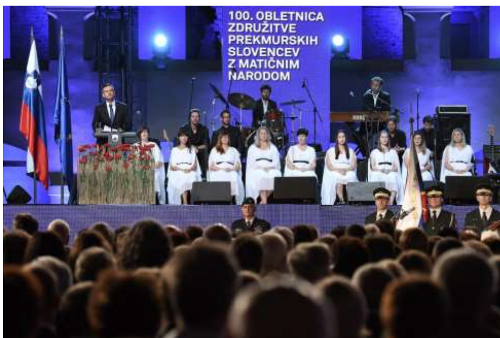
Slika 16: Proslava ob 100. obletnici priključitve Prekmurja in združitve prekmurskih Slovencev z matičnim narodom.

In tako se pripovedovala zgodba o Prekmurju, ki je ostalo povezano zaradi svojih prebivalcev, katere nedvomno že stoletje povezuje reka in pesem, kar je bilo prikazano tudi na državni proslavi ob 100. obletnici priključitve Prekmurja in združitve prekmurskih Slovencev z matičnim narodom.