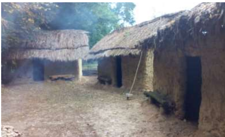
Slika 6: Naselbina ob reki

Na prostoru v velikosti tisoč km 2 je od 13. do konca 18. stoletja med rekama Rabo in spodnjo Muro nastalo enajst trgov, na obeh štajerskih bregovih pa dve mesti Radgona in Ormož, pa tudi pet obmurskih trgov: Ernovž, Straß, Cmurek, Ljutomer in Veržej, v bližini Mure pa tudi Razkrižje, Štrigova in Mursko Središče. Nadalje avtor ugotavlja, da je Mura je v tem štajerskem koncu v novem veku odigrala več vlog. Nenehno je spreminjala okolico, vplivala na mikroklimo in narekovala pogoje življenja ob njej. Določala je stoletno državno mejo, bila je naravna pot. Kot vodna pot je proti jugu nosila množico raznih plovil. Ob njej so vodile kopenske prometnice, na njej pa so svojo nalogo opravljali mnogi mlini (Hozjan, 2013). Ritoznojnik (2013) navaja, da sta po njej potekali tudi vojaška in trgovska pot, kateri je bilo potrebno vzdrževati in varovati.