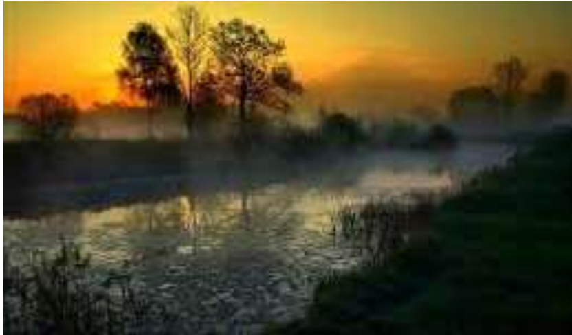
Slika 15: »Tam v meglisah nad mursko vodo«