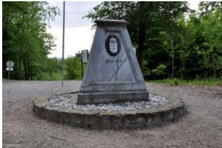
Slika 2: Kulturno zgodovinski spomenik, mejni kamen iz leta 1924 med Avstrijo, Madžarsko in Kraljevino SHS (vir: Kraji – Slovenija, 2020).