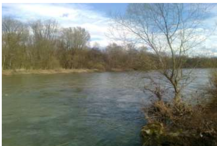
Slika 8: Reka Mura danes

»Reka Mura je zaradi svoje izjemne biotske raznovrstnosti, ki krasi njene poplavne gozdove, rečne rokave, mrtvice, prodišča in tradicionalno kulturno pokrajino ob reki, eden najbogatejših ekosistemov v Srednji Evropi. Kljub grobim človekovim posegom v preteklosti je reka v širokem poplavnem pasu znotraj visokovodnih nasipov deloma še ohranila svojo rečno dinamiko, ki se odraža v edinstveni raznolikosti življenjskih okolij in živih bitij.« (Kikec, 2007).