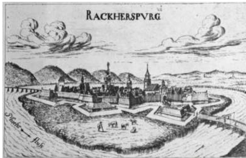
Slika 5: Reka Mura na Vischerjevi karti

V terciarju, ko se je Panonsko morje že krčilo, se je vodni odtok razvil v dveh smereh: proti severovzhodu se je usmerila Raba, proti jugovzhodu pa Mura, za katero vemo, da je tekla prvotno severneje in da je za najmanj 20 km spolzela proti jugu, saj je marsikatera lastnost sedanjega vodnega toka še dediščina iz dobe, ko so reke in rečice za umikajočim se morjem, tekoč v dolgih vzporednih strugah zasipale široke ravnine s prodrom in peskom. V poznem srednjem pliocenu so nastajale uravnave, danes ohranjene kot ostanki ploščatih slemen. Enakomerne višine so prav posebna značilnost našega predela, ki ne doseže nikjer od 500 m višine. V kvartarju so se doline nasule z obilico drobirja, zato so poplave običajen pojav. Kvartar je v tem predelu malo razčlenjen, prevladuje široka aluvialna ravan, ob njej pa široke diluvialne terase. Pomurje nam v svojem reliefu kaže le dva morfolofska elementa: ravnino in gorice. Ravnina, tako imenovana murska ravan, je široka, le malo razgibana, pretežno sušna, prikladna za obdelovanje, zato je v večini spremenjena v polja. Prav tako enotne so gorice z zaobljenimi terasami: na desni strani Mure so to obronki Slovenskih goric, na levi strani pa je to Goričko, od katerega se na jugovzhodu razloči obsežno gričevje Lendavskih goric (Šavel, 1994).