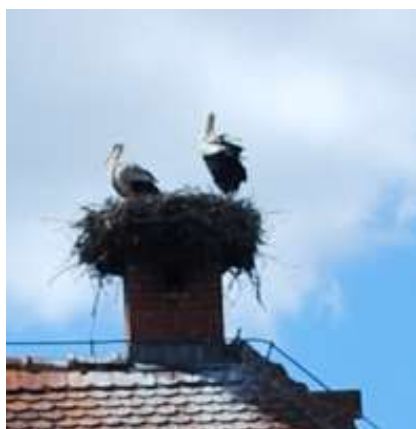
Slika 3: Štorkljino gnezdo – simbol Prekmurja

Prekmurje je danes pretežno ravninska pokrajina. Geografsko je razdeljeno na tri območja: hribovno področje severno od Murske Sobote je Goričko; vzhodno proti Muri leži Ravensko, jugovzhodno od Murske Sobote pa leži Dolinsko. Okrog Lendave je manjše gričevnato področje Lendavske gorice.