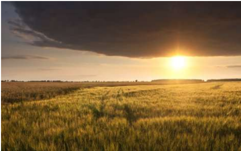
Slika 1: Prekmurska ravnica