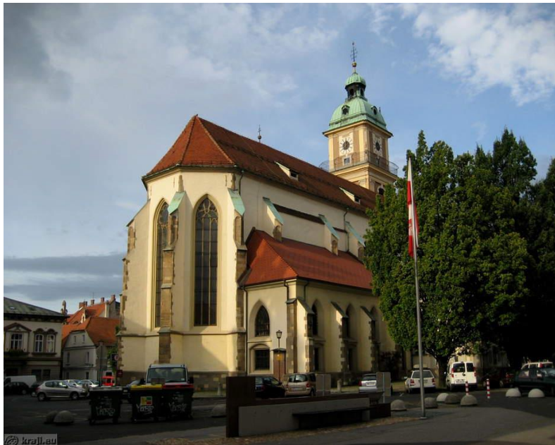
Slika 13: Stolnica sv. Janeza Krstnika