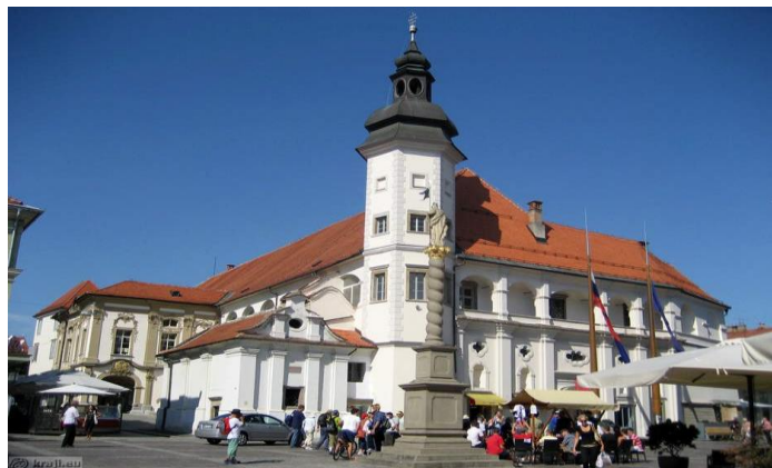
Slika 11: Mariborski grad danes