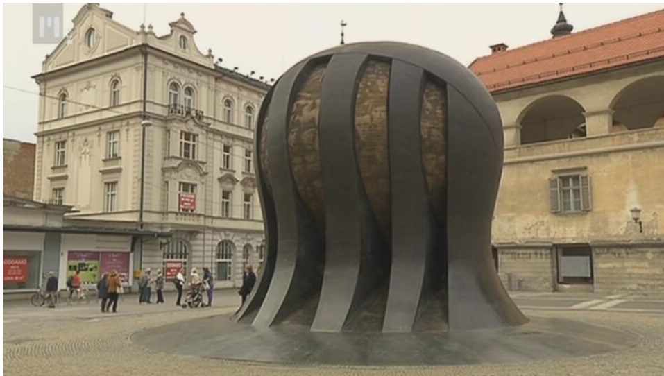
Slika 9: Spomenik NOB