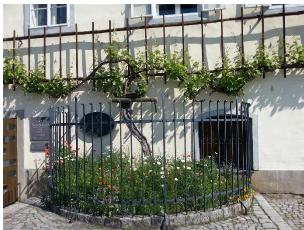
Slika 7: Naravna znamenitost - Stara trta