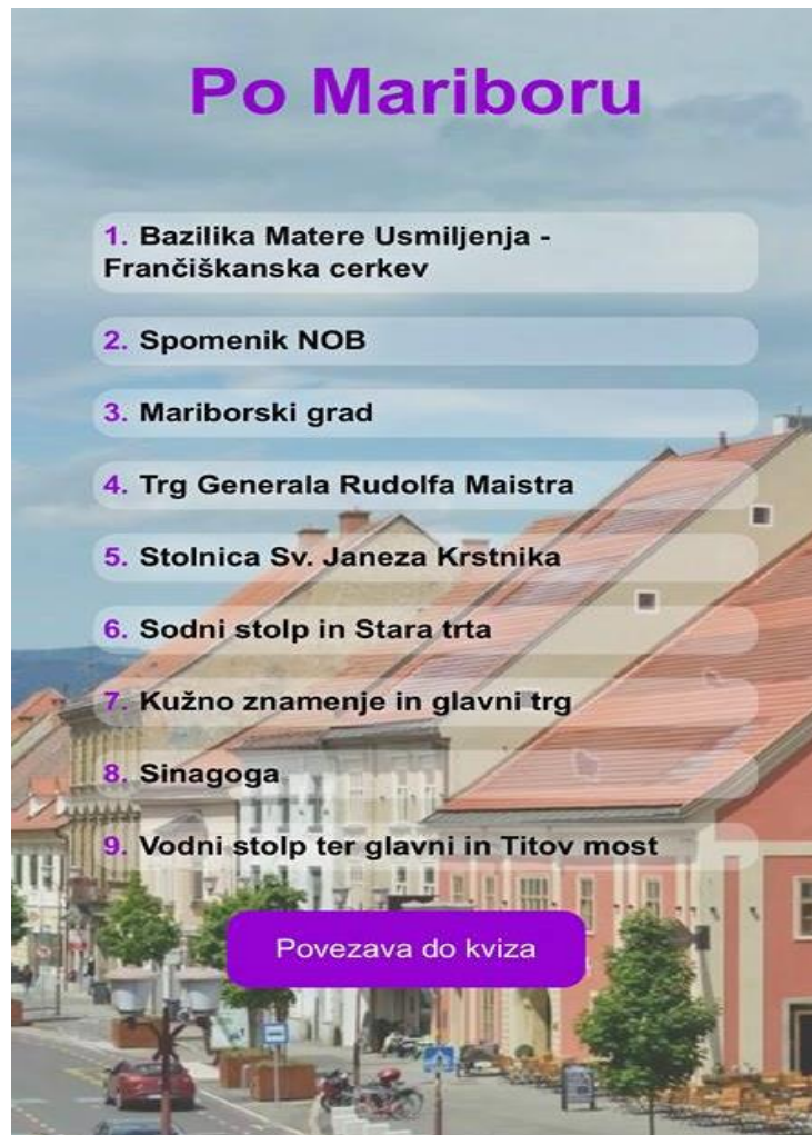
Slika 1: Prva stran aplikacije