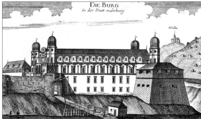
Slika 10: Mariborski grad nekoč