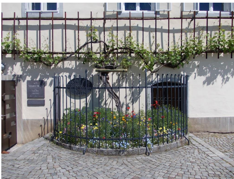
Slika 14: Stara trta