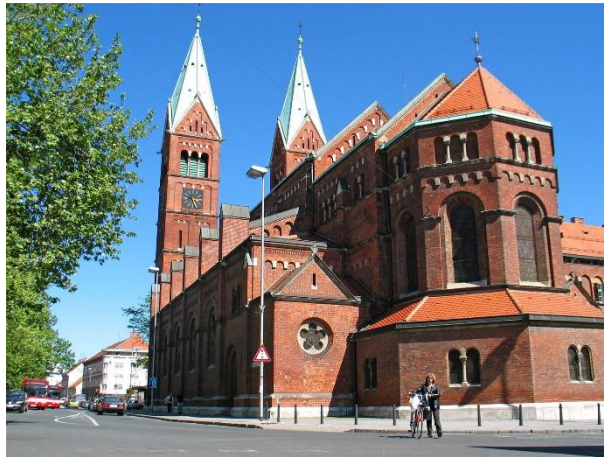
Slika 6: Kulturna znamenitost (Frančiškanska cerkev)

Znamenitost je lahko naravna ali kulturna, lahko je predmet ali pojav. Naravne znamenitosti so vse znamenitosti, ki jih je naredila narava. Kulturne znamenitosti pa so vse znamenitosti, za katere je zaslužen človek. To so na primer cerkve, muzeji, spomeniki ... Med naravne znamenitosti spadajo razni slapovi, soteske, izviri in podobno. V naši nalogi smo se osredotočili predvsem na kulturne znamenitosti, ki jih predstavljamo v nadaljevanju.