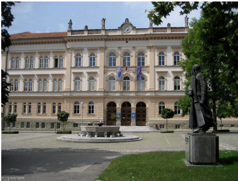
Slika 12:Trg in spomenik Rudolfa Maistra.