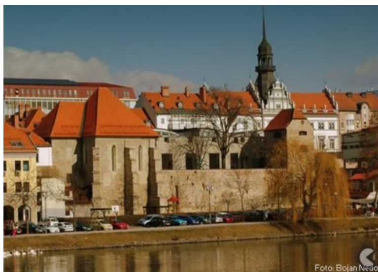
Slika 16: Sinagoga Maribor – pogled na južno stran stavbe z delom starega obzidja