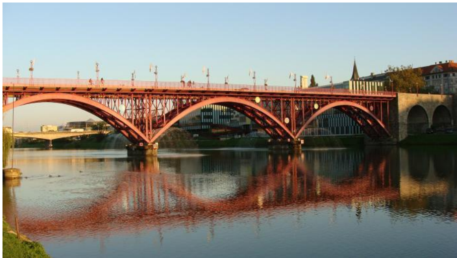
Slika 17: Titov most