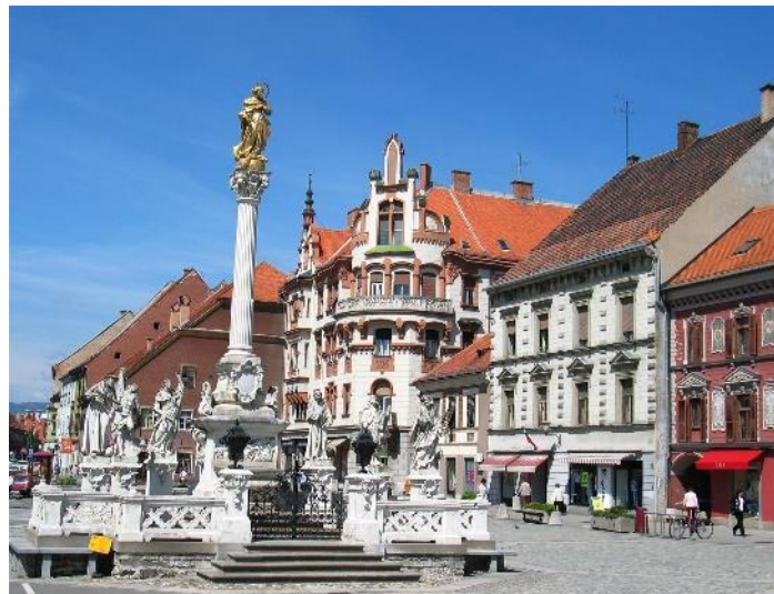
Slika 15: Glavni trg in Kužno znamenje