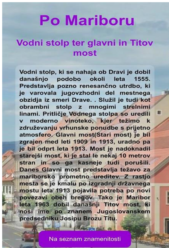
Slika 3: Prikaz opisa znamenitosti – Vodni stolp ter Glavni in Titov most