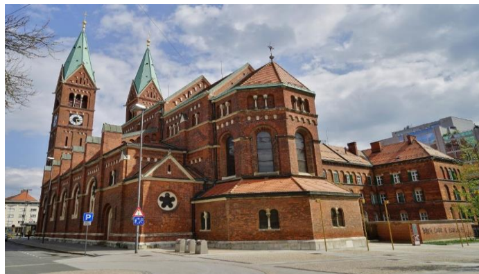
Slika 8: Frančiškanska cerkev