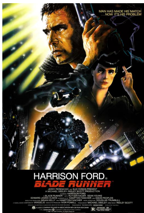
Slika 3: Blade Runner (Iztrebljevalec) (Vir: Blade Runner [splet]).

Osnova: Ali androidi sanjajo o električnih ovcah, napisal Philip Kindred Dick