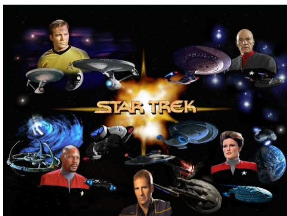
Slika 5: Zvezdne steze.

Igralci: William Shatner, Leonard Nimoy, Nichelle Nichols