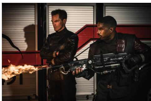
Slika 1: Fahrenheit 451 (2018).

Knjižna predloga: Fahrenheit 451, napisal Ray Bradbury