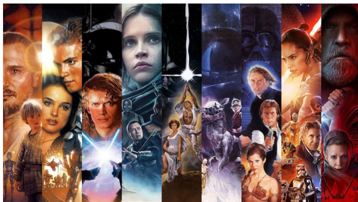
Slika 4: Vojna zvezd.

Igralci: Harrison Ford, Mark Hamill, Carrie Fisher, James Earl Jones