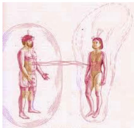
Slika 2: Energetski vampirji

Energijo nam lahko pijejo tudi ljudje, ki jih imenujemo energetski vampirji (slika 2). Ciljajo na Svetlobne delavce, najstnike, mlade otroke, atlete, psihične bralce, svetovalce – ljudi z visoko energijo. Niso vampirji iz pravljič, nimajo podočnikov, črne pelerine ... so le ljudje, člani družine ... vendar naj bi se učili psihičnega kanaliziranja in napajajo sebe s tujo energijo. Zato smo včasih zraven nekaterih oseb zelo izčrpani. Nahajali naj bi se povsod, po ulicah, v družbi, celo po internetu in telefonih. (spletna stran Samospoznanje)