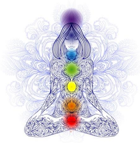
Slika 1: Čakre in njihova nahajališča v telesu.