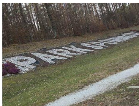
Slika 13: Park spominov