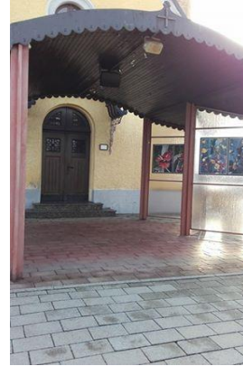
Slika 6: Kapela (vir: osebni arhiv, 2018)