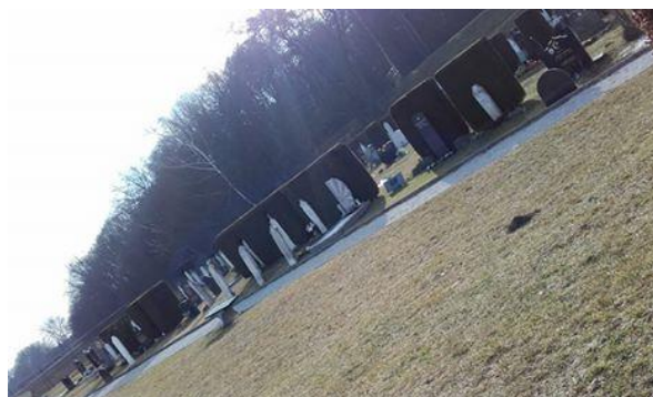
Slika 15: Muslimanski grobovi