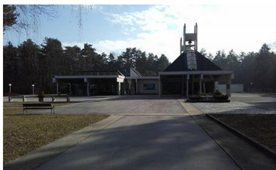
Slika 11: Poslovilno poslopje