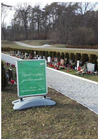
Slika 14: Tipsko urejeni grobovi