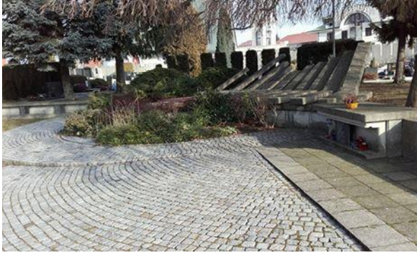
Slika 5: Skupinski grob