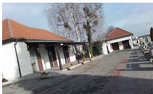
Slika 4: Poslovilne veže