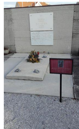
Slika 9: Grob R. Maistra