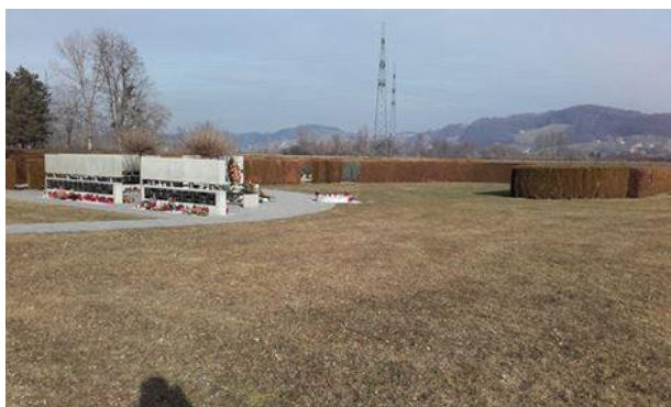
Slika 12: Območje za raztros