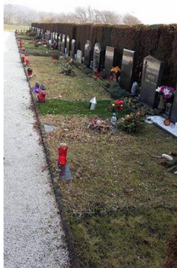
Slika 2: Krščanski grobovi