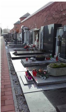
Slika 7: Grobnice