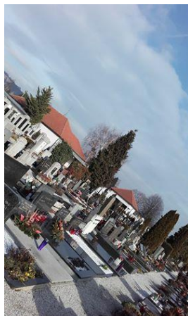
Slika 8: Grobovi