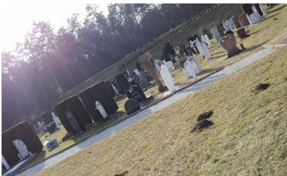
Slika 1: Muslimanski grobovi

Muslimani morajo pogreb opraviti v najkrajšem možnem času. Umrlega ne smejo upepeliti in ga pokopati v žari. Dovoljen je samo klasičen način (krsta). Umrlega najprej okopajo (ženske – žensko, moški – moškega). Potem pokojnika zavijejo v čiste, bele rjuhe in ga položijo v krsto. Če je mogoče, ga postavijo pred vernike. Pomembno je, da je desna stran obrnjena proti svetemu mestu – Meki. Molitve na pokopališču se lahko udeležijo le moški. Dostop do groba je ženskam dovoljen šele, ko je pogreb končan. V Sloveniji so ženske lahko prisotne pri molitvah. Pokojnika v grob položijo tako, da je z desno stranjo telesa obrnjen proti Meki.