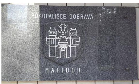
Slika 10: Vhod

Različnost pobreškega in dobravskega pokopališča je tudi v tem, da so na dobravskem zabrisane statusne razlike umrlih.