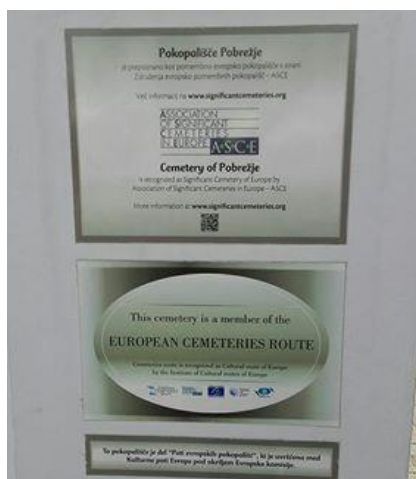
Slika 3: Certifikat (vir: osebni arhiv, 2018)