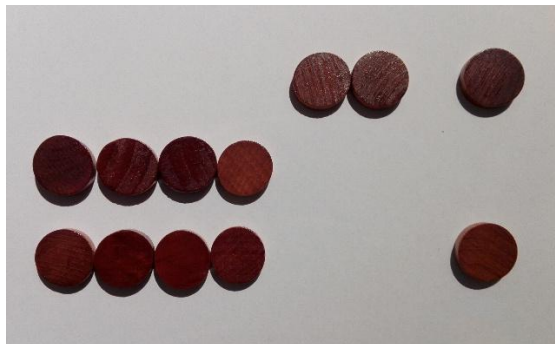
Slika 3: Dvojiška postavitve kupov s tremi, štirimi in petimi žetoni

Postavitve 11_{(2)} , 100_{(2)} , 101_{(2)} iz katere lahko takoj ugotovimo dvojiško vsoto 010_{(2)} .