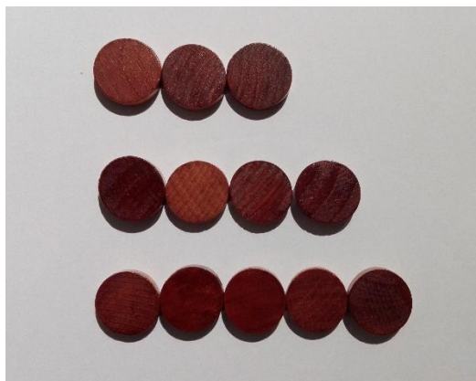
Slika 2: Kupi s tremi, štirimi in petimi žetoni