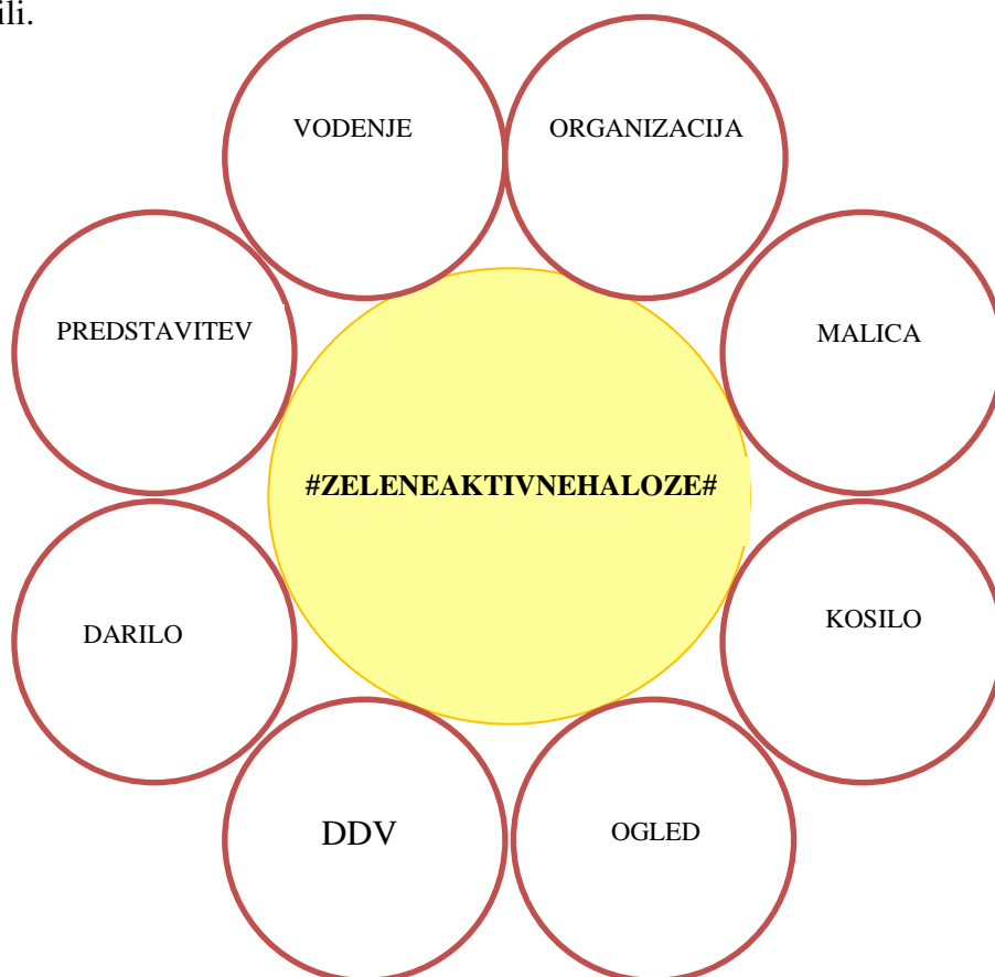
Slika 4: Prikaz novega turističnega produkta

Na spodnji sliki predstavljamo naš idejni primer sestave turističnega produkta, kjer opredeljujemo, da je turistični produkt sestavljen iz več delnih turističnih produktov in tako predstavlja celotni turistični produkt, ki smo ga povezali v celoto in ga cenovno ovrednotili.