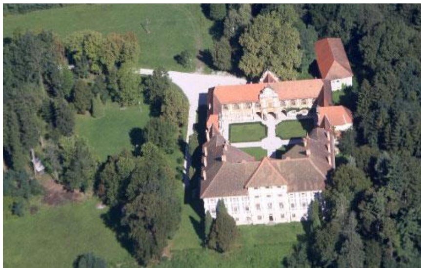
Slika 6: Dvorec Štatenberg