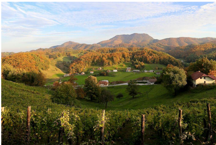
Slika 3: Pokrajina Haloz

Program izleta sem pripravila za zaključeno skupino in je primeren, da se lahko izvaja tako spomladi, poleti kot tudi jeseni, odvisno od vremena in želje posamezne skupine. Program, ki sem ga pripravila sem pripravila na podlagi terenskega dela, ki je zajemalo sodelovanje s turističnimi ponudniki iz obravnavanega lokalnega okolja, turističnim društvom Štatenberg, Ptujška gora, Kulturno umetniškimi društvom forma Viva Makole, Zavodom Moi, Izletniško kmetijo Lončarič in z nekaterimi posamezniki, ki so mi pomagali pri snemanju in izdelavi prispevka. Skladno s temo Zeleni turizem, želim izpostaviti območje Haloz, ohranjene kotičke narave ob strugi reke Dravinje, do koder se lahko dostopa s kolesom ali peš in druge posebnosti Haloz, ki jih turisti lahko spoznajo na drugačen in naravi prijazen način. Po predvideni poti se bomo odpravili s kolesi, saj je to eno najbolj zelenih prevoznih sredstev. Najprej sem seveda preverila, da kolesarska pot ni preveč zahtevna in je primerna za ljudi, ki se na kolo usedejo nekajkrat na leto. Za področje Haloz sem se odločila, saj je tukaj še vedno veliko neokrnjene narave in koticov, ki še niso odkriti.