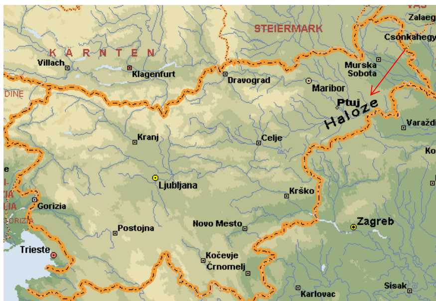
Slika 1: Haloze na zemljevidu