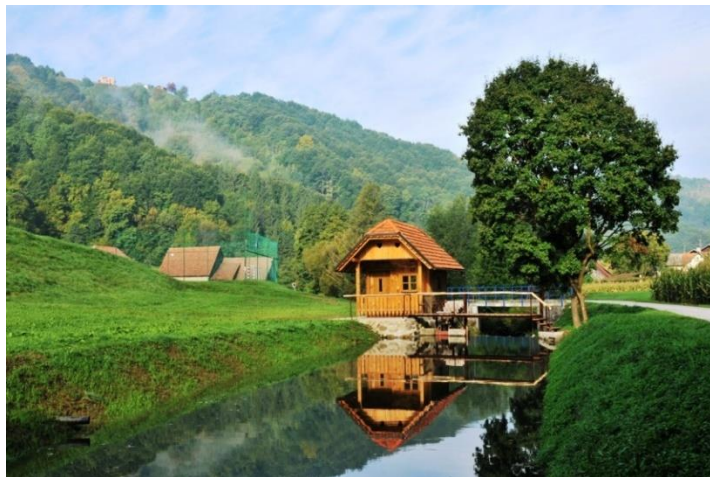
Slika 8: Mlin v Narapljah

odločili za prenovu. Po dolgotrajnih birokratskih postopkih je danes mlin obnovljen in opremljen. V njem je mogoče mleti žito in tako podoživeti pristnost delovanja narave ob zvokih drobljenja žita. Vodni mlin je prav tako učna točka: vsak lahko spozna delovanje mlina in potek mletja žit ter si tudi sam ob pomoči domačinov zmelje žito.