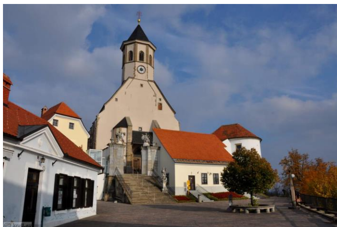
Slika 9: Cerkev na Ptujski Gori