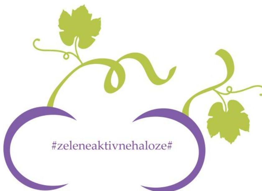
Slika 5: Logotip