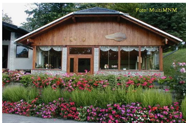
Slika 10: Kmetija Lončarič

Iz Majšperka se peljete po krajevni cesti proti Žetalam. Po treh km zavijete desno na označeno cesto proti Jelovicam, nato se peljete v hrib še dodatne tri kilometre. Na izletniško turistični kmetiji Lončarič vam ponujajo različna domača bela vina pridelano iz šipona, laškega rizlinga, muškata otonela in renskega rizlinga, narezke s haloško bunko in ostale domače jedi po dogovoru. Haloško gibanico pečejo v krušni peči po starih receptih kmetije.