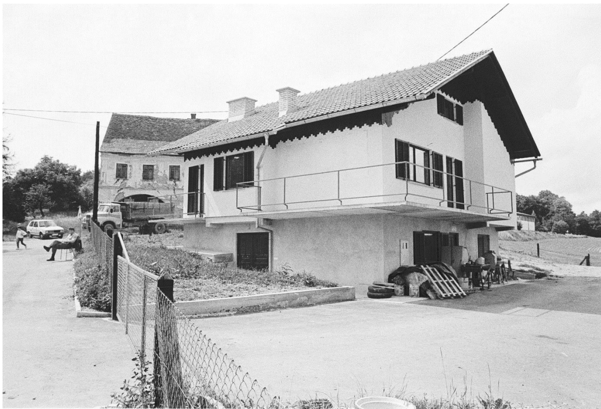
Slika 15: Hiša, s katere je streljal osumljenec