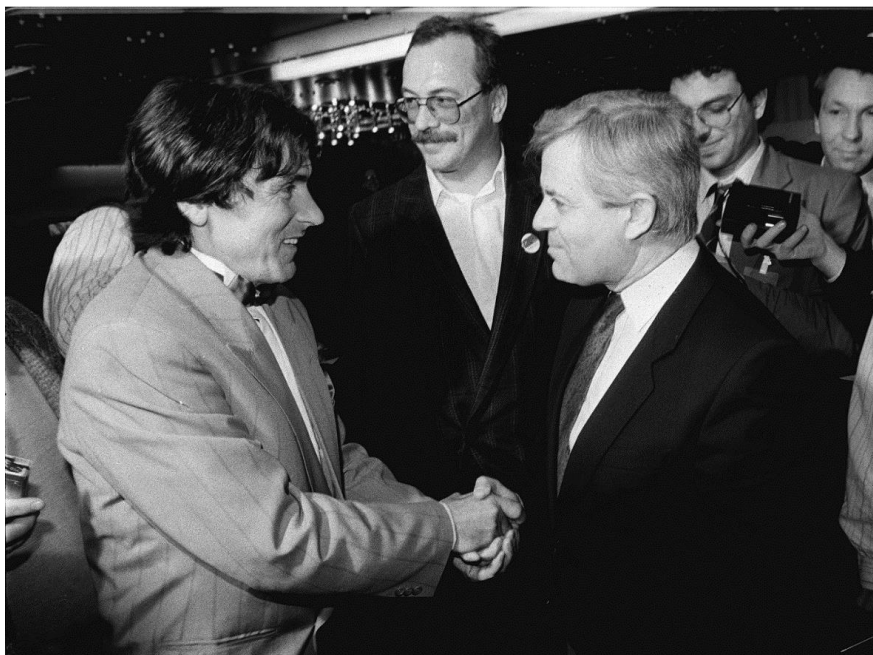
Slika 8: Ivan Kramberger in Milan Kučan