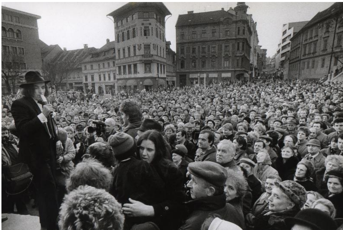
Slika 9: Ivan Kramberger je imel ogromno privržencev

Na svojih mnogih javnih nastopih med predvolilno kampanjo je ljudi že v svojem znanem slogu vedno navduševal z govori. Tako je množici ljudi večkrat rekel, da nič ne obljublja, vendar da želi Slovincem svobodno državo, s katero jih bo popeljal v Evropo. Tako ga je tudi 25. marca 1990 v Žalec pred hotel Rubin kljub dežju prišlo poslušat več sto ljudi. Prisotne je nagovoril tako: »Ali bomo delovni ljudje, kmetje, invalidi in mamice zmagali?« (Večer, 1990, str. 5) in pri tem ljudem svetoval drugačnega predsednika, torej sebe, jim obljubljal boljše življenje. Pri tem je povedal, da če je predsednik sposoben poskrbeti zase, za svojo družino, potem bo poskrbel tudi za narod. Ljudstvu je povedal, da ima posebno prednost, saj, izhajajoč iz revne družine, zna ceniti delovnega človeka. Ker je petindvajset let delal v kapitalizmu in petindvajset v komunizmu, zna primerjati, kaj je boljše, opravljal pa je dela od čistilca ulic, specialista za umetne ledvice do pisatelja.