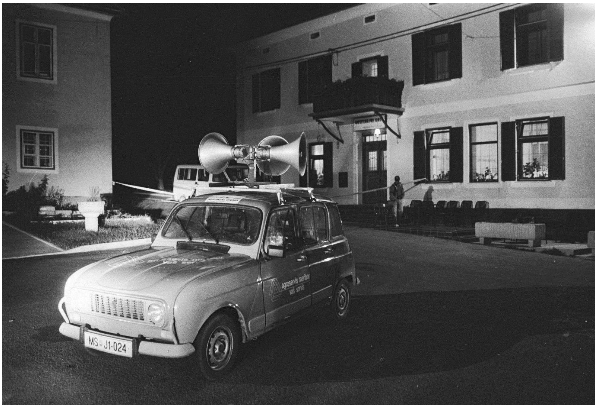
Slika 13: Krambergerjev močno ozvočen avto na prizorišču umora

- Koliko policistov je sodelovalo pri raziskovanju umora?