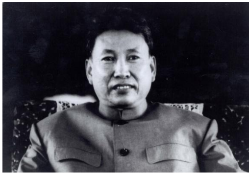
Slika 9: Pol Pot

Genocid v Kambodži se nanaša na prizadevanje Rdečih Kmerov (zagovorniki komunizma) k nacionalizaciji in centralizaciji ruralne družbe Kambodže, po zgledu Kitajske komunistične družbe (povzeto po: http://worldwithoutgenocide.org/genocides-and-conflicts/cambodian-genocide ).