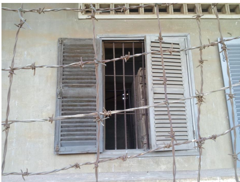
Slika 12: primer zapora

Procesi sojenja zoper glavne krivce genocida so se začeli komaj leta 2007. Do takrat je večina odgovornih že umrla. Tako je npr. Pol Pot umrl že leta 1998, ko je bil zelo hudo bolan, a je verjetno naredil samomor, da bi se izognil sodnim procesom. Vse do današnjega dne za ta genocid še nihče ni odgovarjal.