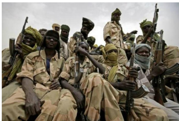
Slika 7: džandžavidi (vir: http://darfurgenocideshs.weebly.com/ , citirano: 13.1.2016)

Kartumska vlada humanitarnim organizacijam otežuje delo, saj nad njih pošilja roparske in piratske skupine, ki plenijo hrano, blago in vodo, namenjeno v taborišča. Nemalokrat se zgodi, da skupina Džandžavidov pri zasedbi posameznih vasi kontaminira vodo v vodnjakih, ko vanje odvrže trupla. Tako se lahko s to vodo zastrupijo vsi prebivalci.