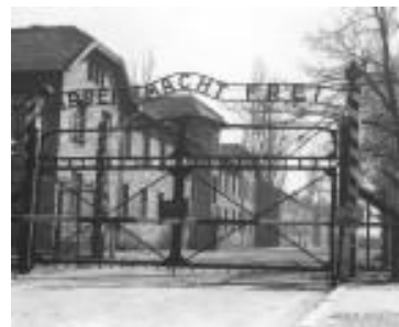
Slika 2: taborišče Auschwitz

Po vsej vzhodni Evropi so ustanavljali gete, ki so služili za koncentriranje Judov. Gete so ogradili z zidovi in bodočo žico. V Varšavski geto so zaprli okrog 500.000 Judov, v katerem je bilo Judom dovoljeno proizvajanje dobrin za nemško vojsko. V ali v bližini getov so se ustanovila delovna taborišča, v katerih so bili Judje prisiljeni delati kot sužnji (tudi Auschwitz..) (povzeto po: http://www.ppu.org.uk/genocide/g_holocaust.html ).