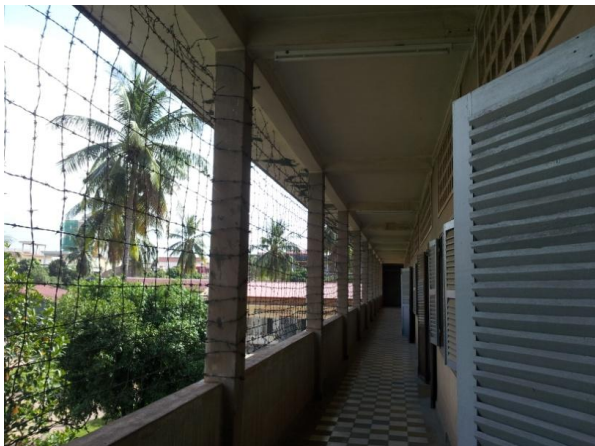
Slika 11: primer urejenega zapora

Nekatere ujetnike so zaprli v zapore, druge pa v delovna taborišča.