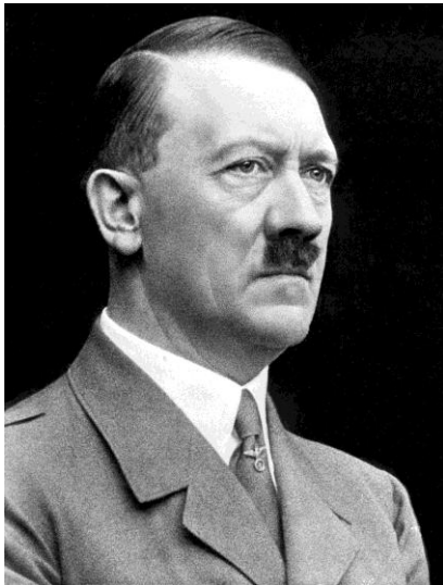
Slika 1: Adolf Hitler

Adolf Hitler je bil v zaporu, ko se je intenzivno lotil pisanja knjige Mein Kampf (Moj boj), v kateri je zapisal, kakšno Nemčijo želi ustvariti in kakšen bo svet po njegovih osvajanjih. Natančno in zelo surovo je prikazal kako bo vzpostavil »novi red« v osvojeni Evropi. Gojil je temeljno idejo, in sicer sovraštvo do Židov, Slovanov, homoseksualcev ter povečevanje Nemcev. Jude in marksiste je krivil za poraz Nemčije v prvi svetovni vojni. V knjigi Mein Kampf je med drugim zapisal »V tistih dneh je v meni naraščalo sovraštvo, sovraštvo do onih, ki so bili krivi tega dejanja...«