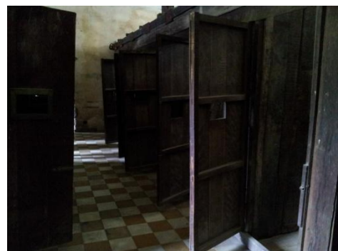
Slika 10: taborišča v šolskih prostorih

Rdeči Kmeri so bili mnenja, da mora biti država urejena kot federacija, v kateri morajo državljani delati na državnih posestvih. Vse nasprotnike, ki so takšni ureditvi nasprotovali, so skupaj z nekomunisti eliminirali. Namen genocida je bil torej povrniti državo v čas srednjeveške avtarkije (gospodarska samozadostnost) (povzeto po: http://www.ppu.org.uk/genocide/g_cambodia.html ).