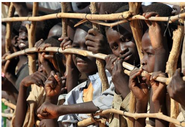
Slika 8: ujeti otroci Darfurja