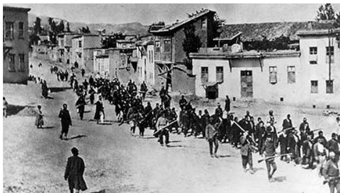
Slika 4: pohodi smrti

Osmansko cesarstvo je v načrtovalo izgradnjo železniške proge Istanbul-Bagdad, in jo do leta 1915 zgradili samo do Sirske puščave, do koder so z vagoni prepeljali aretirane Armence ter