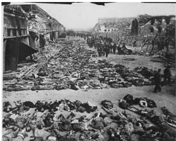
Slika 3: taborišče Nordhausen