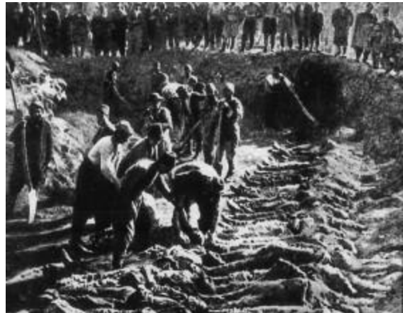
Slika 5: odkritje trupel

V genocidu je po domnevanjih bilo ubitih 1,5 mio Armencev. Po koncu 1. svetovne vojne in s tem po porazu Osmanskega cesarstva je novi sultan Mehmed VI priznal zločine mladoturkov, kateri so bili zaprti v britanskem zaporu na Malti. Veliko odgovornih osebnosti je pobegnilo že pred samimi sojenjem, nekaterih sojenj pa sploh niso začeli in so osumljenje po več letih izpustili iz zapora brez da bi odgovarjali za izvrševanje genocida. Nova