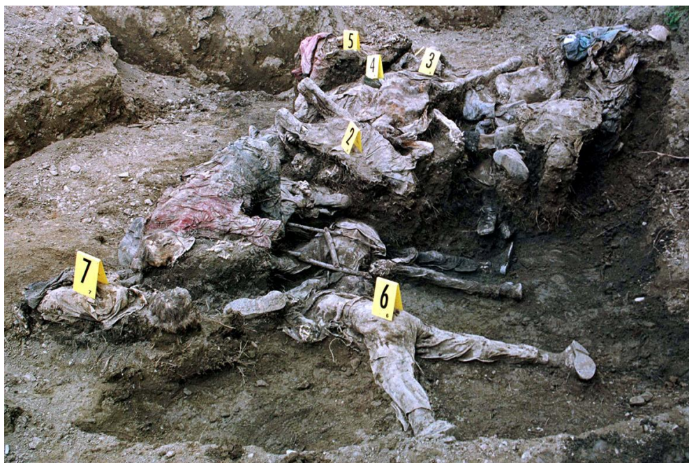
Slika 13: množično grobišče pri Srebrenici

Največje posledice genocida nosijo preživeli, kajti ogromno žensk je izgubilo svoje može, sinove, očete...skratka vso družino. Mnogi izmed njih še danes ne vedo kje so bližnji pokopani. Množična grobišča in identifikacija trupel se odkriva še dandanes.