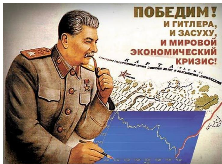
Slika 3: Stalin

Stalinova diktatura je zahtevala več milijonov žrtev (Boden, 2004, str. 408). V njegovem obdobju je Sovjetska zveza postala tretja industrijska sila sveta. Stalin je hitro začel s pripravljanjem na vojno, poudarek je dal na proizvodnjo težke industrije. Ustvaril je strog nadzor nad državljani. Ustanovil je posebno policijo, ki je iskala nasprotnike komunizma znotraj države. Brez dokazov, zgolj samo iz suma so jih pošiljali na prisilna dela v mrzlo Sibirijo. Dogajali so se montirani sodni procesi proti tistim, ki bi lahko ogrožali Stalinovo vladavino. Zatirali so rusko vero in ljudi množično prepričevali o Stalinovi nezmotljivosti in mogočnosti (Kožuh, 2013, str. 18-19).