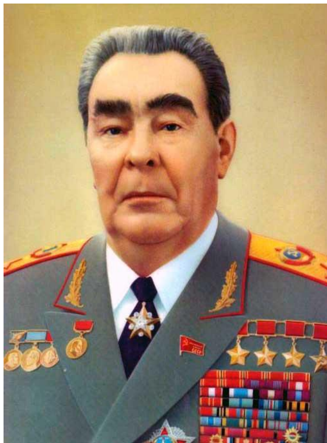
Slika 5: Brežnjev

Neuspeh gospodarske reforme in zaostritev konflikta z republiko Kitajsko leta 1964 je pripeljala do zamenjave Hruščova. Na oblast je prišel Leonid Ilič Brežnjev. Še vedno je vladal s komunistično naravnostjo. Življenjska raven prebivalstva je ostajala nizka, toda zadovoljiva. V zunanji politiki je Brežnjev še naprej širil vplivno območje Sovjetske zveze in se z vojaško silo lotil reformnih prizadevanj v vzhodni Evropi. Z njim pa se je začelo tudi obdobje pogovorov o razoroževanju in sporazumih (Boden, 2004, str. 411).