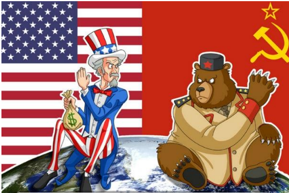
Karikatura 2: ZDA in Sovjetska zveza