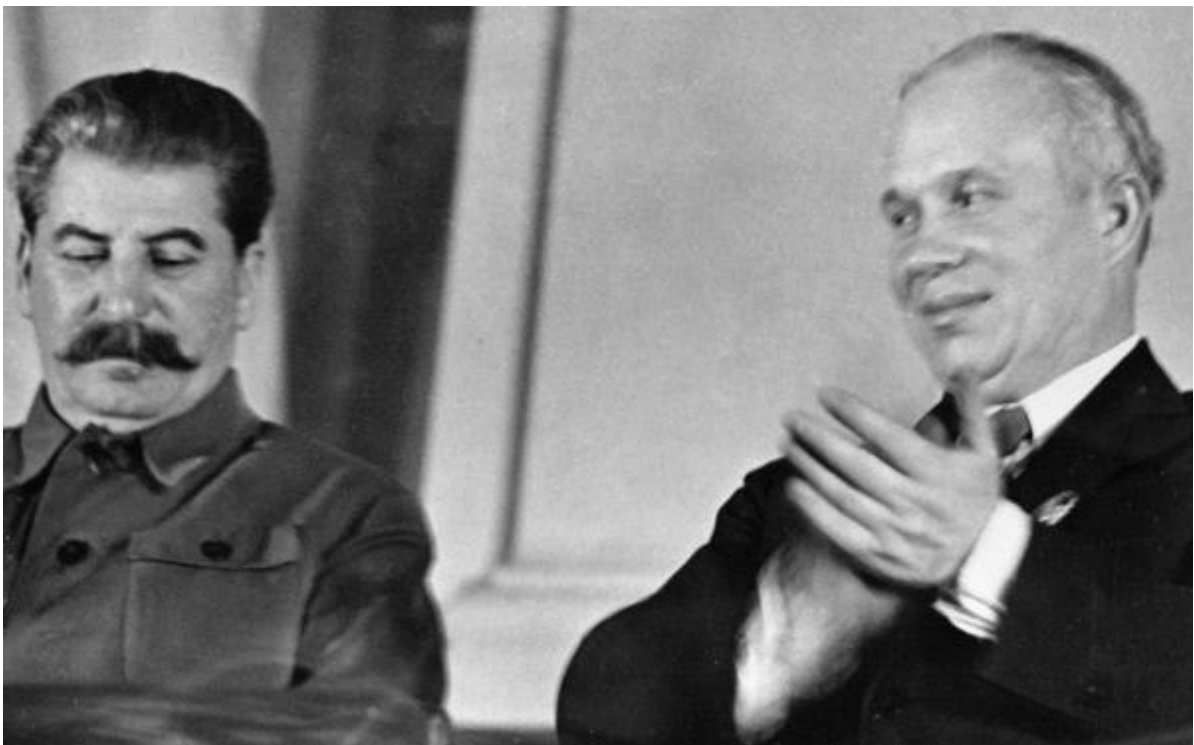
Slika 4: Stalin (levo) in Hruščov (desno)

Po Stalinovi smrti leta 1953 je prevzel oblast Nikita Hruščov. Takoj je začel s ukinjanjem Stalinovega kulta osebnosti. Izpuščati je pričel politične zapornike. Spodbujal je proizvodnjo za široko uporabo. Vendar je še vedno vse nadzorovala komunistična stranka. Slabe življenjske razmere in močno nadzorovano politično in zasebno življenje so porajale nezadovoljstvo. Podobne razmere so vladale v vseh državah vzhodnega bloka ( http://www.rtv slo.si/zabava/na-danasnji-dan/zgodilo-se-je-5-marca-leta/172549 ).