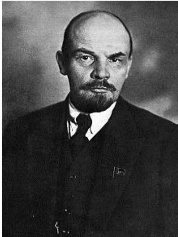
Slika 2: Lenin

Vendar mu je produkcijo uspelo dvigniti na višjo raven in s tem je ponovno zagnal gospodarstvo. Gospodarstvo je doseglo proizvodnjo, ki je bila enaka proizvodnji iz leta 1914. Umril je januarja 1924. Po njegovi smrti se je Petrograd preimenoval v Leningrad.