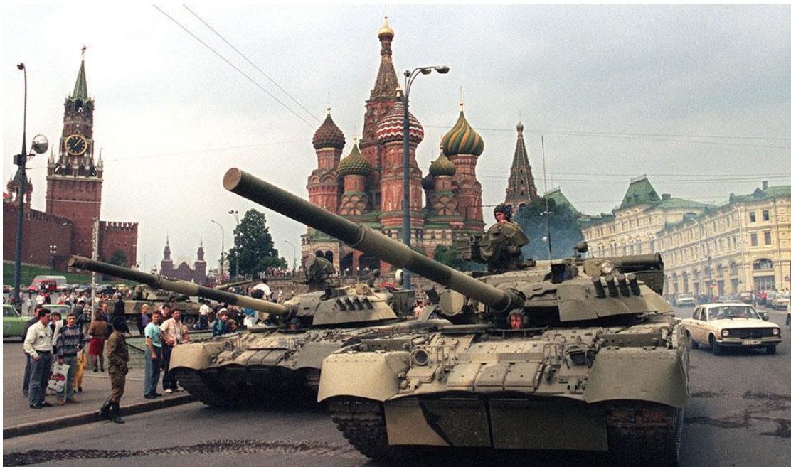
Slika 7: Državni udar 1991

Nov začetek je prineslo jutro 25. decembra 1991. S svojim odstopom ga je naznanil Gorbačov. Ves svet je zrl v Moskvo, prestolnico nekdanje veličastne države, ki je dan kasneje po skoraj sedemdesetih letih prenehala obstajati. Naslednji dan, 26. decembra 1991, je Sovjetska zveza, ki je obstajala od leta 1922, prenehala obstajati. Boris Jelcin, Stanislav Šuškevič in Leonid Kravčuk so se v tajnosti sestali v lovski koči blizu Bresta v Belorusiji, kjer so podpisali sporazum iz Beloveške, ter razglasili razpustitev Sovjetske zveze ( http://www.zurnal24.si/zacetek-razpada-sovjetske-zveze-clanek-132615 ).