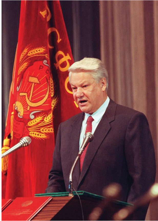
Slika 6: Jelcin