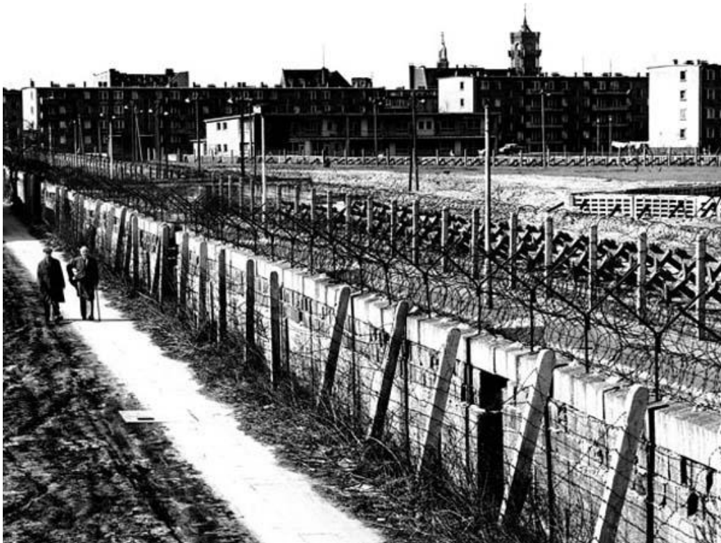
Slika 9: Berlinski zid

zaslužka ( http://www.rtv slo.si/svet/dan-ko-je-padel-berlinski-zid-in-se-je-spremenil-svet/216465 ).