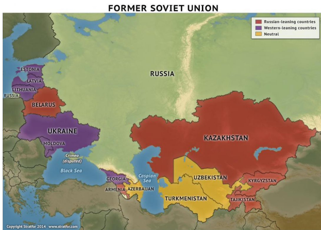
Zemljevid 2: Novo nastale države

Litva, Moldavija, Rusija, Tadžikistan, Turkmenistan, Ukrajina in Uzbekistan. ( https://sl.wikipedia.org/wiki/Sovjetska_zveza )