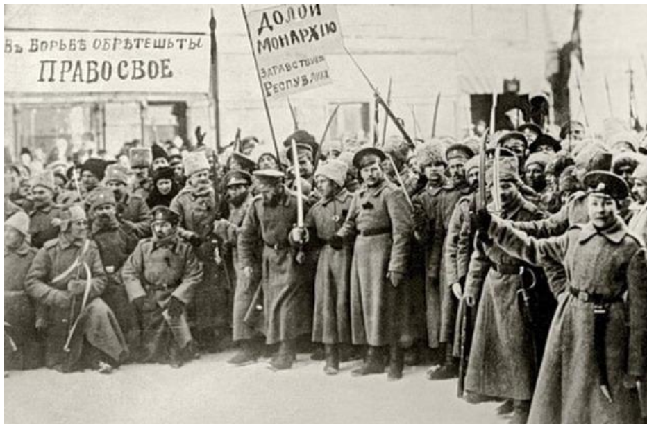
Slika 1: Boljševiki

V času Leninove vladavine je v Rusiji prišlo do velikih sprememb, uveden je nov političen sistem, vero ločijo od države in šolstva, uvedli so ljudska sodišča in delavsko policijo. Tudi državo preimenujejo v Sovjetsko zvezo. Sovjetska zveza (tudi Zveza Sovjetskih Socialističnih Republik - ZSSR) je uradno nastala leta 1922 in prvi predsednik republike je bil Vladimir Lenin. Kot je Lenin dejal v svojem govoru: »Partija Lenina, moč narodna, zmaga komunizma nas vodi naprej« ( https://sites.google.com/site/komunizem123/sovjetska-zveza---nastanek ).