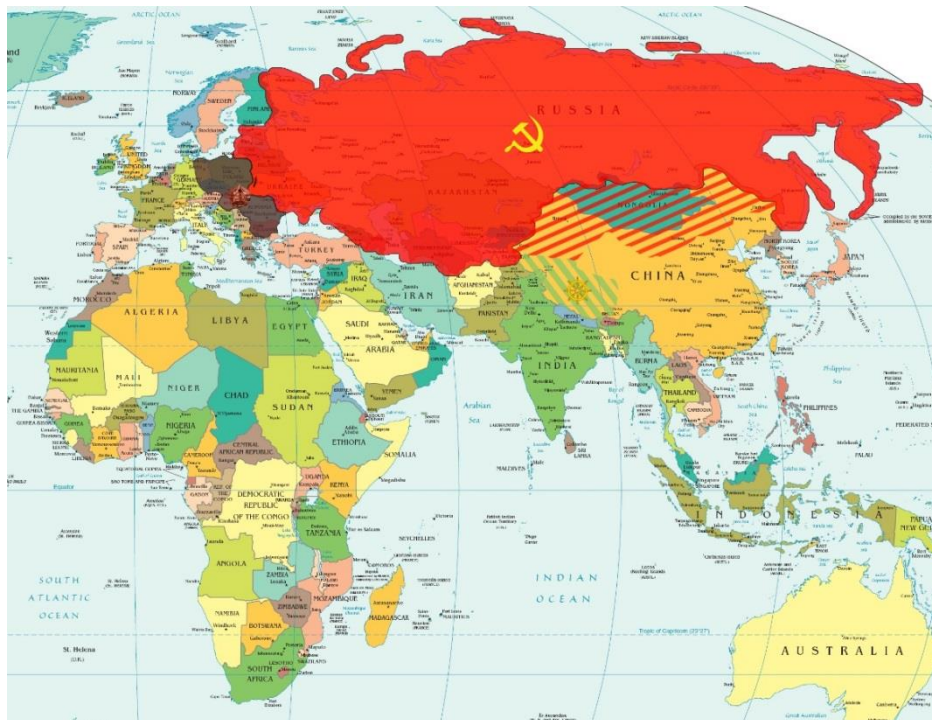
Zemljevid 1: Sovjetska zveza

Preden je na božični dan leta 1991 Sovjetska zveza razpadla, je v njej živel približno 250 milijonov ljudi. Bili so pripadniki skoraj 100 različnih narodnosti. Ta država je zajemala več kot šestino površja Zemlje. Sestavljajo jo je 15 držav.