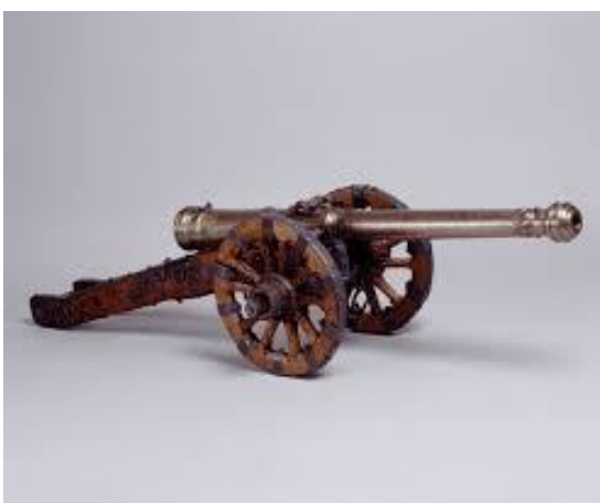
(Slika 3, top iz 17 stoletja, 4.2.2015 )

Topove so začeli nameščati tudi na galeje, na katerih je bilo od 15 do 100 topov, odvisno od velikosti same ladje. V obdobju razsvetljenega absolutizma v 17. stoletju, so se že oblikovale taktike bojevanja, ki so bile značilne tudi za bojevanje v 1. sv. vojni. Linija pehote v prvi bojni črti, za njo konjenica