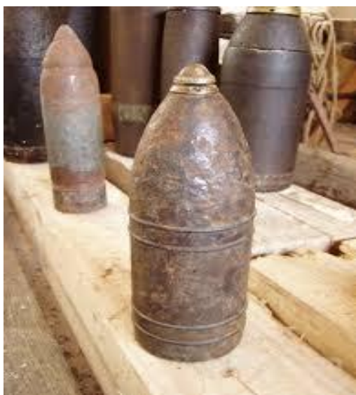
(Slika 5: Topovske granate, 4.2.2015,)

Namenjen je uničevanju sovražnikovih utrd, tankov ali zgradb in je podpora pehoti. V Soških bitkah so jih namestili na vrh hriba, saj je to povečalo njihov domet. Najizrazitejša vloga topništva se je pokazala v 12. soški bitki, t.i. »Čudež pri Kobaridu«. Ob 2. uri zjutraj je Avstro-Ogrska vojska pričela z neprestanim obleganjem italijanske vojske z različnimi topovskimi izstrelki kot so: bojni plin (fosgen), navadne krogle in krogle polnjene z eksplozivom. Vse to je prisililo sovražnika v umik. V tem obstreljevanju dobimo dokaz, da so topovi imeli veliko vlogo v vojni. To je pesnik Simon Gregorčič ugotovil že pred vojno. V svoji pesmi je zapisal: " Tod sekla bridka bodo jekla in ti mi boš krvava tekla " (Simon Gregorčič, Soči, 1879). Ob koncu vojne so imele antante 40.000 topov, centralne sile pa le 27.000. Ker je število topov naraščalo in je bilo treba proizvajati več topovskih krogel, je bila vojaška industrija znotraj Avstro-Ogrske zelo obremenjena. Avstro-ogrski vojaki so zelo cenili top imenovan Škoda M.1991.