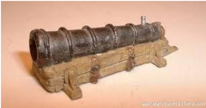
(Slika 2: Turški top, 4.2.2015 )

Top se pojavi po odkritju črnega smodnika na Kitajskem. Z njimi so se Kitajci branili pred vdori Mongolov. Datum nastanka topov ni točno znan. V virih je zapisano, da se je pojavil okoli leta 1300. Leto pozneje so v spopadih že uporabljali puške in granate. V bitkah so topove zelo uspešno vključevali Turki, ki so vdrali na evropsko območje in