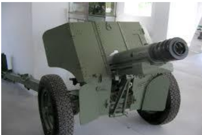
(Slika 6: gorski top, 4.2.2015)

Domet (m) 5.500, 8. 000, 12.560, 20.000, 22.000 .