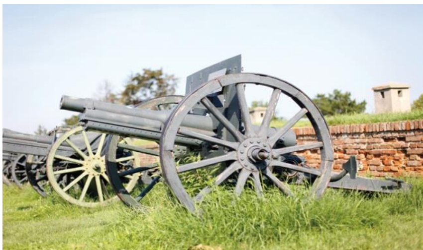
(Slika 7: poljski top Schneider, 2.2.2015)

Začetna hitrost izstrelka (m/s) 500 - 588, 500,498. Domet (m) 5.800, 8.000, 7.000, 8.680.