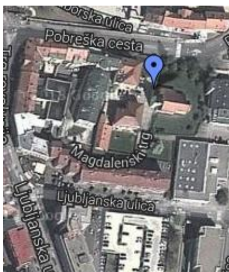
Slika 7: Magdalenski trg (Vir: < https://maps.google.com/maps?ct=reset&tab=ll >)

Med samimi branjem članka me je zanimalo, ali so sprejeli kakšno Majcnovo novo poimenovanje. Ugotovila sem, da niso in da so v večini primerov sprejeli poimenovanja, ki jim je Majcen nasprotoval in ki mu niso bila všeč.