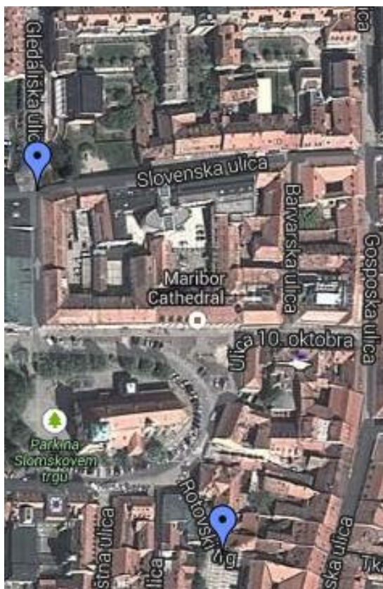
Slika 8: Gledališka ulica in Rotovski trg