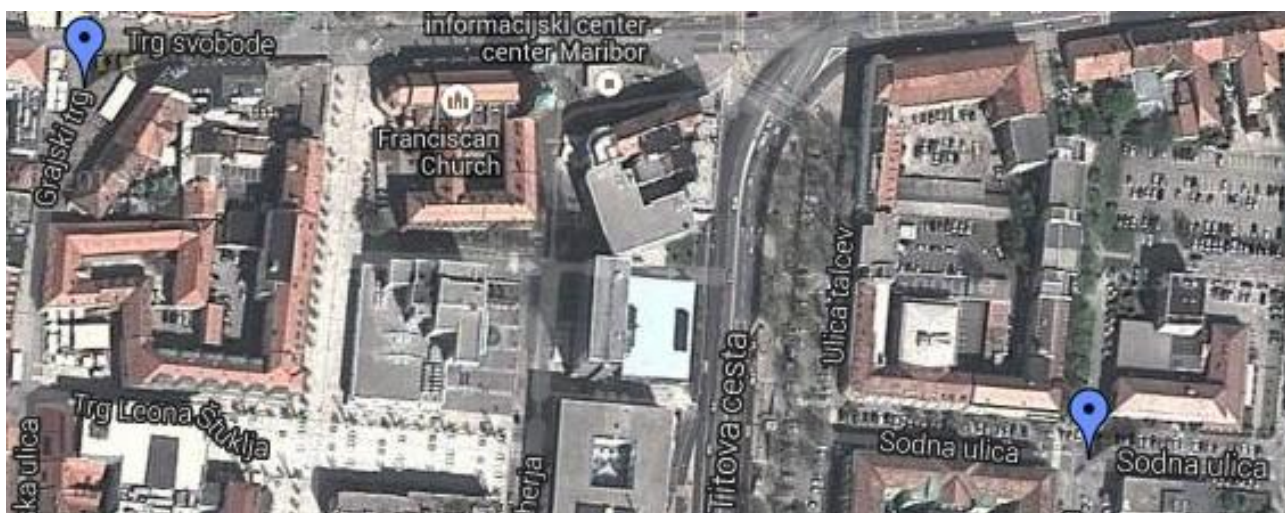
Slika 9: Grajski trg in Sodna ulica