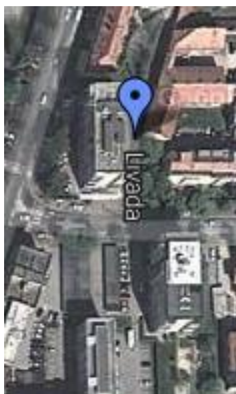
Slika 10: Livada