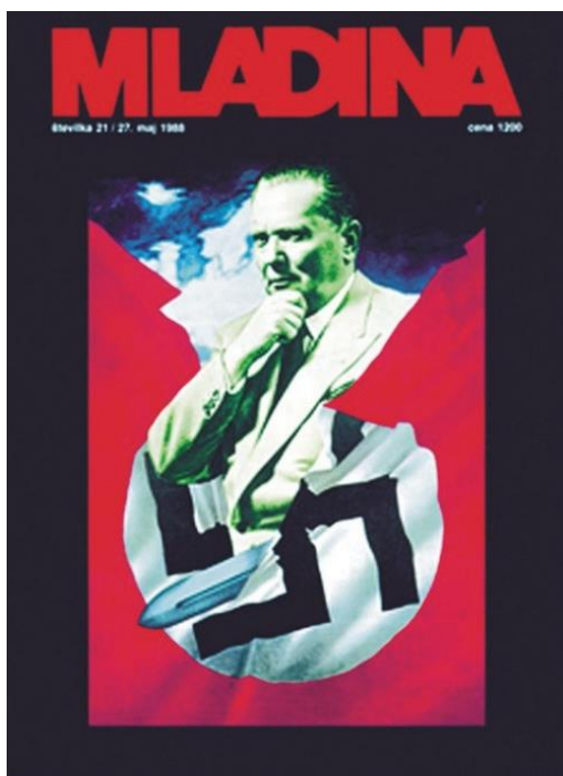
SLIKA 6: Naslovnica Mladine 1. 1988 (vir: MMC RTV SLO. 2003. Vložena tožba zoper tednik mladina. [online]. Dostopno na URL: http://www.rtvslo.si/crna-kronika/vlozena-tozba-zoper-tednik-mladina/11728 [3. 2. 2016])