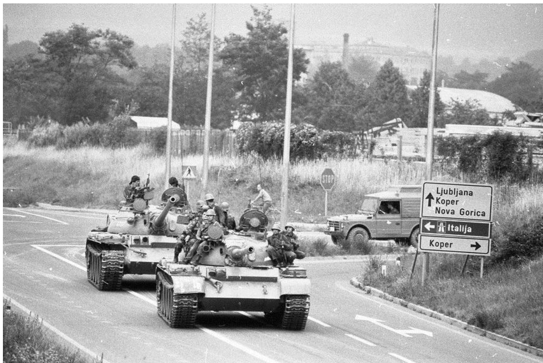
SLIKA 13: Oklepniki JLA