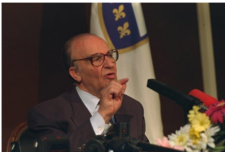
SLIKA 21: Alija Izetbegović (vir: Web-tribune-com. 2015. Otkriven dugo skrivani snimak izjave alije izetbegovića na sednici predsedništva BiH 1995-te: „Cifra ubijenih u Srebrenici je verovatno oko 3.000, sve ostalo je propaganda!“). [online]. Dostopno na URL: http://web-tribune.com/spektar/otkriven-dugo-skrivani-snimak-izjave-alije-izetbegovića-na-sednici-predsedništva-bih-1995-te-cifra-ubijenih-u-srebrenici-je-verovatno-oko-3-000-sve-ostalo-je-propaganda# [1. 2. 2016])