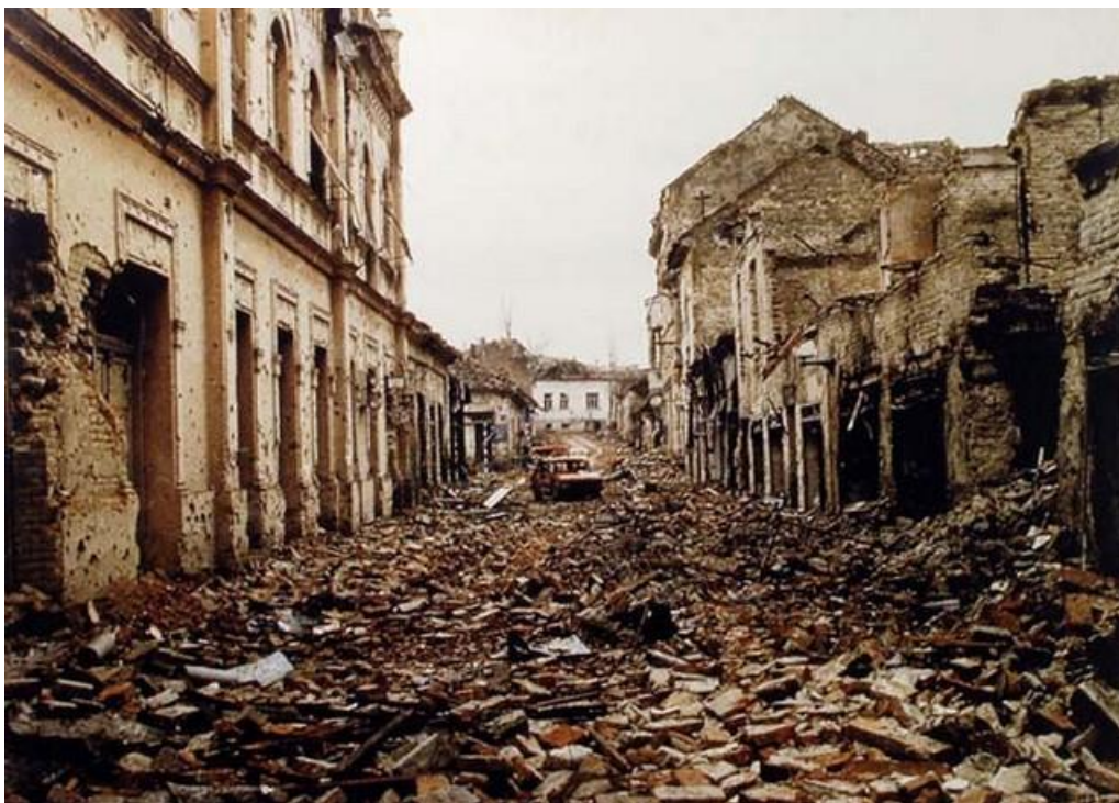
SLIKA 14: Vukovar v ruševinah