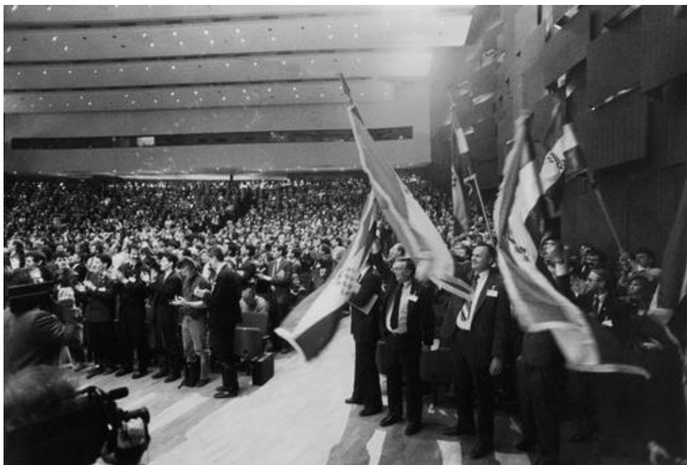
SLIKA 12: Zmaga HDZ (vir: HDZ. 2013. Povijest. [online]. Dostopno na URL: http://www.hdz.hr/mi-smo/povijest/1990 [3. 2. 2016])