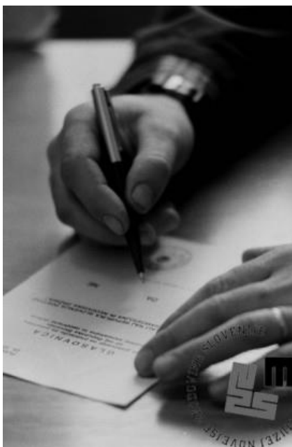
SLIKA 9: Glasovnica