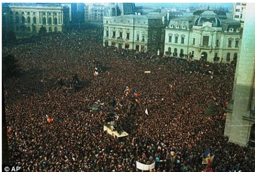
SLIKA 1: Protesti v Romuniji (vir: History onlicts. 2014. The fall of communism in Romania. [online]. Dostopno na URL: http://historyconflicts.com/the-fall-of-communism-in-romania/ [3. 2. 2016])