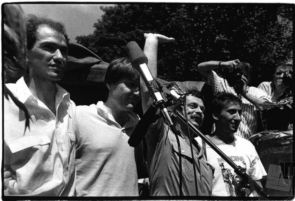
SLIKA 8: Četverica