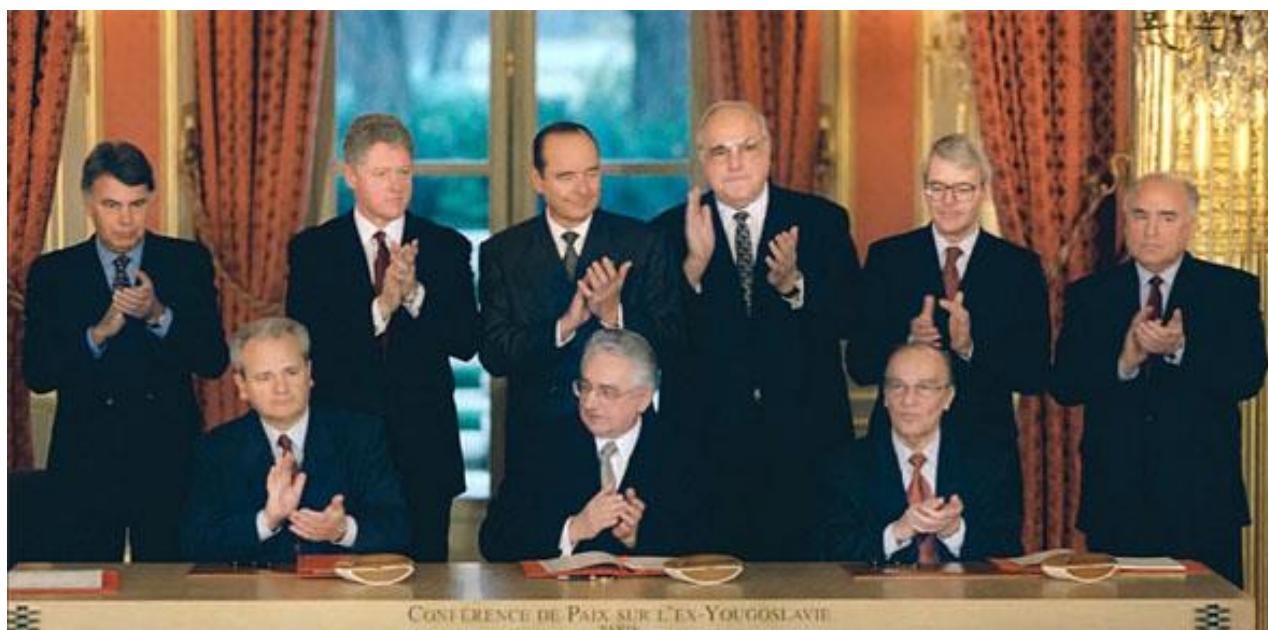
SLIKA 18: Podpis sporazuma