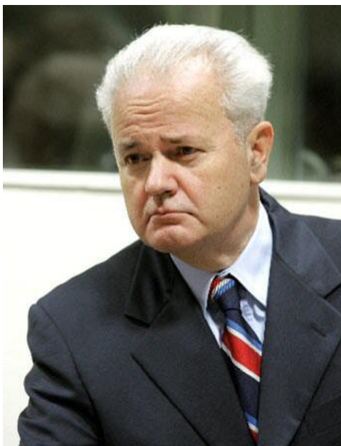
SLIKA 19: Slobodan Milošević