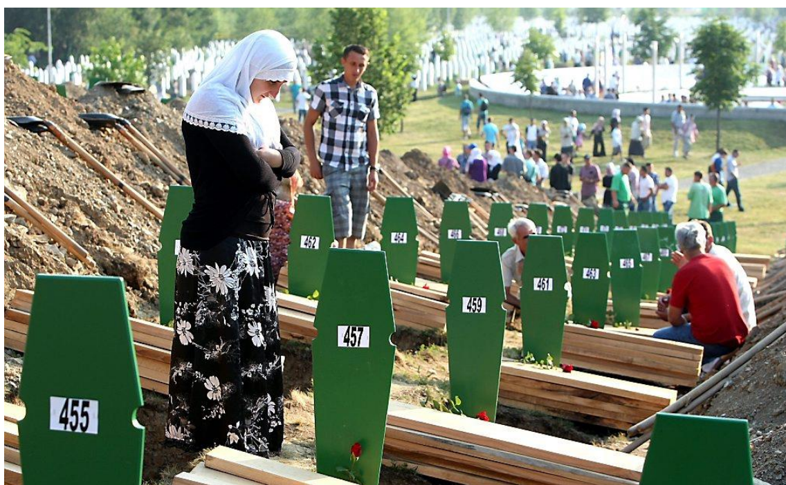
SLIKA 16: Pokopališče žrtev v Srebrenici