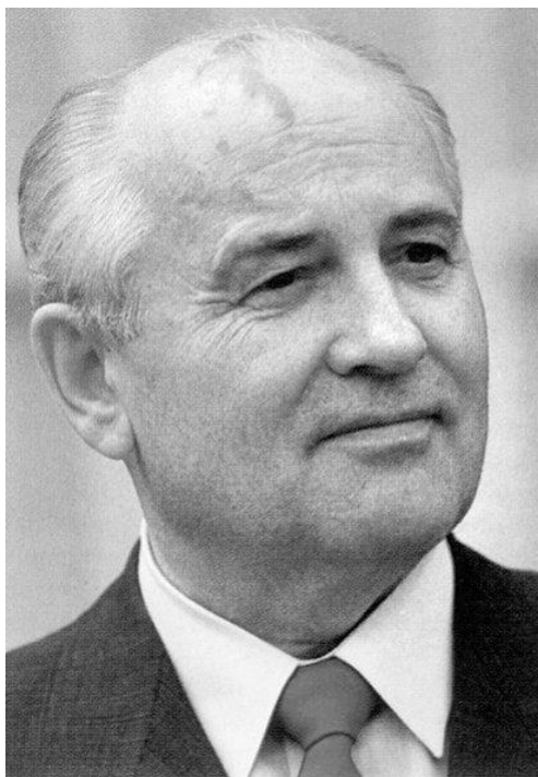
SLIKA 2: Mihail Gorbačov