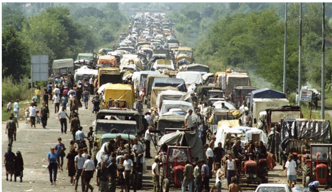
SLIKA 17: Migracije Srbov