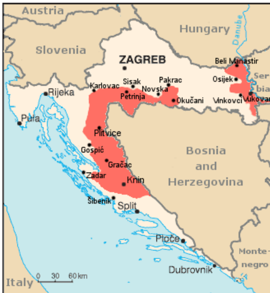
Slika 15: Označeno območje RSK (vir: Wikipedia. 2006. RSK. [online]. Dostopno na URL: https://lv.wikipedia.org/wiki/Att%C4%93ls:RSK.png [3. 2. 2016])