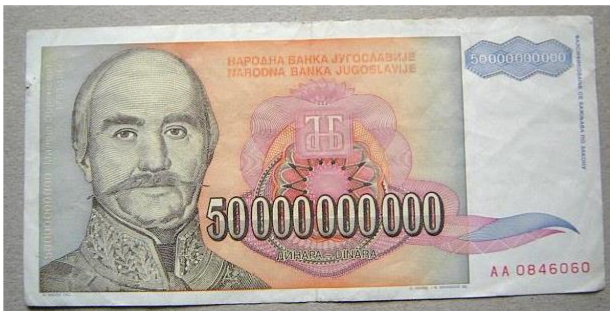
SLIKA 5: Jugoslovanski dinar