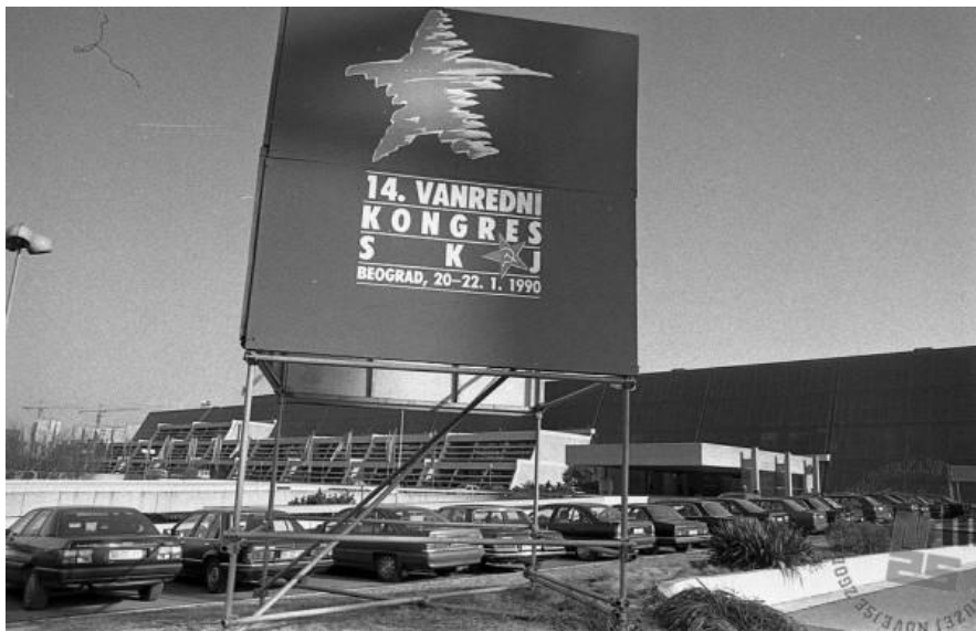
SLIKA 10: Plakat kongresa