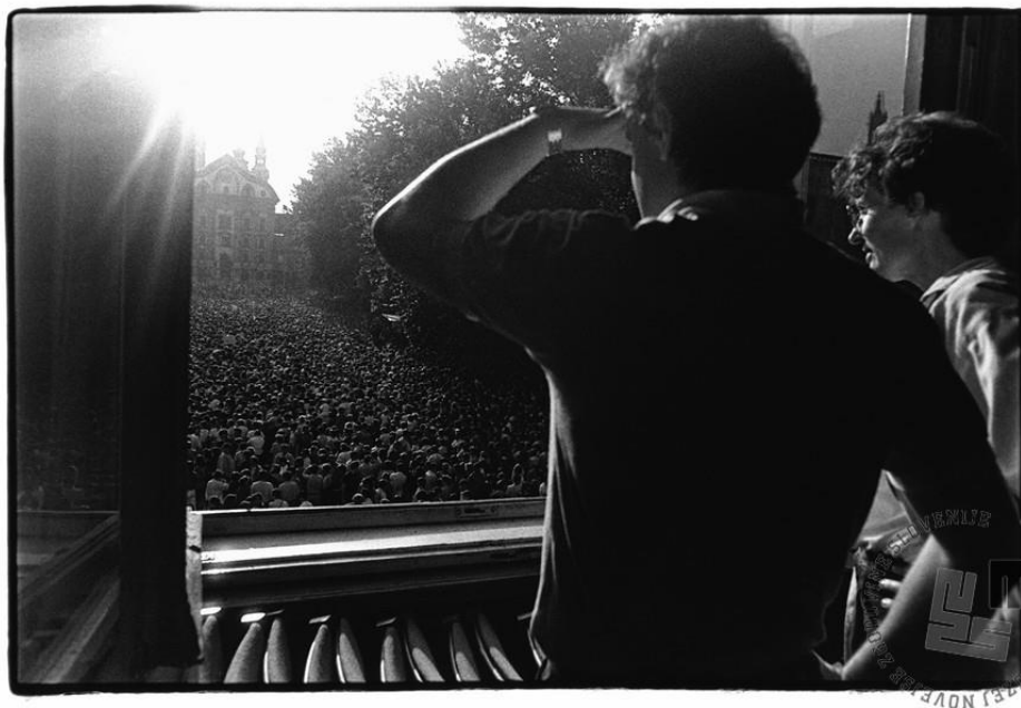
SLIKA 7: Pogled na protestnike

Politika zbiranja ljudstva na ulicah, demonstracije proti premajhnim pravicam Srbov na Kosovu in drugod po državi ter izražanje velike podpore Miloševiću, je izzvala upor, najprej slovenskih, nato pa hrvaških komunistov. Kasneje se jima pridružita še BiH in Makedonija. Tako so predsedništvu nastavili »pat-pozicijo«. ( Erdelja & Stojaković, 2014, str. 272. )