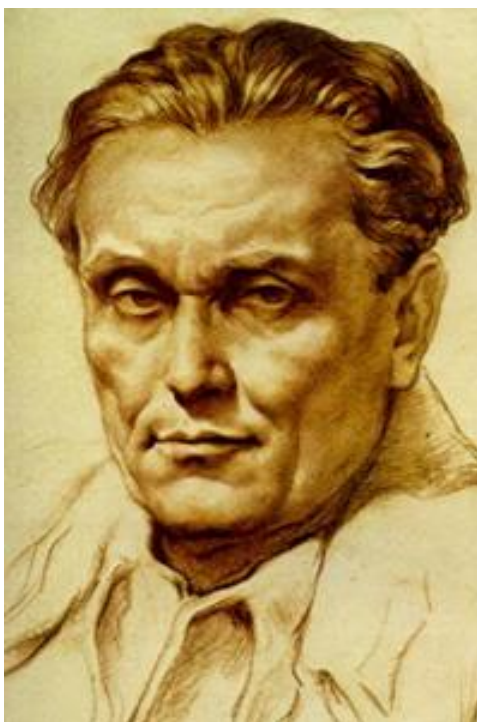
SLIKA 4: Josip Broz Tito