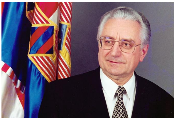
SLIKA 20: Franjo Tuđman (vir: Predsjednica Republike Hrvatske. 2016. Franjo Tuđman. [online]. Dostopno na URL: http://predsjednica.hr/stranica/16/ [1. 2. 2016])