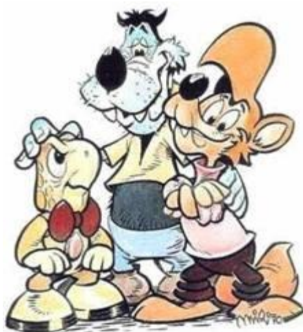
Slika 4 Zvitorepec, Lakotnik in Trdonja