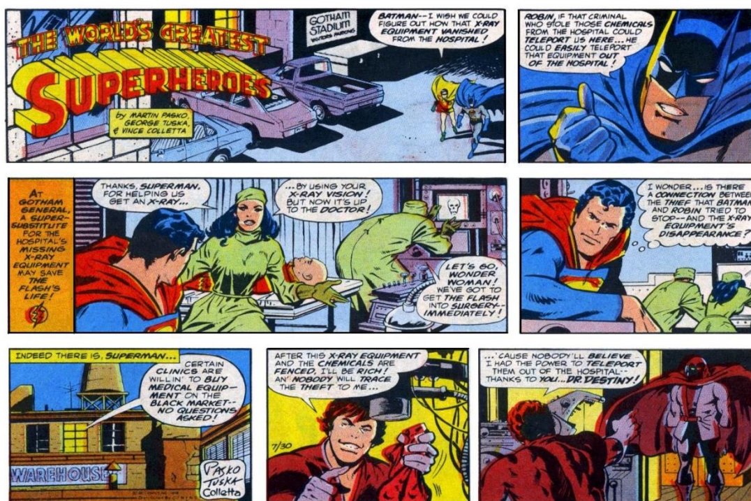
Slika 2 Superjunaka Superman in Batman

V primerjavi z navadnimi knjigami, je branje stripa povsem drugačna izkušnja, saj od bralca zahteva drugačno predznanje o branju. V navadnih knjigah nam je zgodba podana zgolj z besedami, ki so opisi okolja, opisi čustev oseb ipd. Ponekod pa so vseeno nekateri dogodki v zgodbi prikazani še z dodatno ilustracijo, ki bralcu, vsaj za trenutek prikaže osebe in okolje. Na drugi strani, pa se v stripu zgodba bralcu odvija, skoraj v celoti, pred očmi in mu lajša razumevanje zgodbe, kar pa po drugi strani lahko dojemamo kot zaviranje domišljije. Ob branju knjige si bralec namreč mora zgodbo v celoti odviti v glavi in njegovi domišljiji tako da prosto pot.