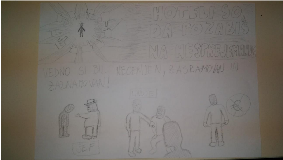
Slika 6 Druga stran stripa