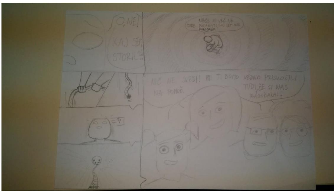
Slika 8 Četrta stran stripa

Kader na vrhu tretje strani prikazuje, kako karakter zamišljen leti nad oblaki, obrnjen navzgor proti nam. Sprašuje se: »Ampak, zakaj so mi vsi, ki so mi stali blizu, hoteli pomagati in me tolažili?« Iz tega oblčka se razvije naslednji kader, ki prikazuje misli karakterja, v katerih se mu pojavijo podobe vseh, ki so mu stali ob strani. To so hčerka, žena, oče in mati. Vsaka prikazana oseba vzklika glavnemu karakterju po njegovem položaju v družini. V naslednjem kadru vidimo veliki plan obraza glavne osebe, kateri se na obrazu vidi, da je zmedena in žalostna. Netelesna oseba mu odgovori: »Niso hoteli, da bi bil srečen! Sploh pa, saj so te vedno samo izkoriščali!« Nato mu prikaže enake podobe ljudi, ki so mu stali ob strani in mu vzklikajo, a tokrat vsak hoče od njega nekaj drugega, da bi storil zanj. V zadnjem kadru tretje strani spet vidimo, kako oseba leti nad oblaki in je zaskrbljena. Ta drugi nevidni osebi poskuša pojasniti, da tega nikdar ni jemal osebno, z besedami: »Ampak, to sem rad počel, saj sem jim pomagal!«