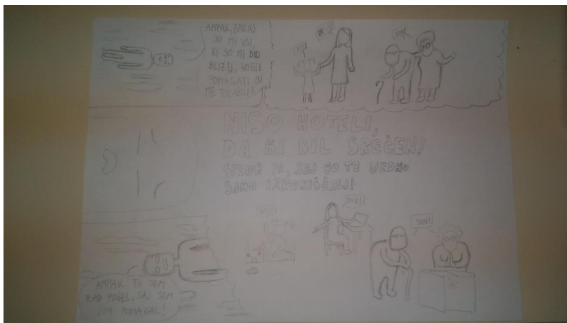
Slika 7 Tretja stran stripa

Prvi kader na drugi strani je širok čez celo dolžino lista. Na levi strani je prikazan krog, ki ga sestavljajo roke, ki sramotilno kažejo na glavno osebo, ki stoji na sredini. Prikazana je samo njegova temna silhueta, ki je pomanjšana, tako da deluje karakter še bolj ponižano. Ozadje je temno, le krog v katerem je karakter je bel. Na levi strani pa z belimi odebeljenimi črkami piše: »Hoteli so, da pozabiš na nesprejemanje.« Drugi kader spodaj, ki je prav tako širok čez celo dolžino lista, je sestavljen iz treh posameznih prizorov. Prvi, na levi, predstavlja glavno osebo v službi. Ta stoji na levi strani in ima sklonjeno glavo, zraven pa stoji njegov šef in ga ponižuje. Ta ima samo zatemnjen obraz z izstopajočimi očmi, pod njim pa je napis »šef«. Drugi prizor prikazuje glavno osebo v družbi dveh oseb, ki ga zasramujeta. Glavna oseba stoji v ospredju, obrnjena proč od nas in je zatemnjena. Nasproti mu stojita dva človeka z zatemnjenima obrazoma in izstopajočimi očmi. Od teh leva oseba s prstom kaže na glavnega karakterja, obe osebi pa se posmehljivo smejeta. Pod njima pa je napis »ljudje«. Na tretjem prizoru pa je vidno, da glavna oseba ni preveč premožna, saj kaže, da nima ničesar v žepih. Oseba je v celoti zatemnjena, zraven nje pa je znak, ki še dodatno pojasnjuje primanjkovanje denarja.