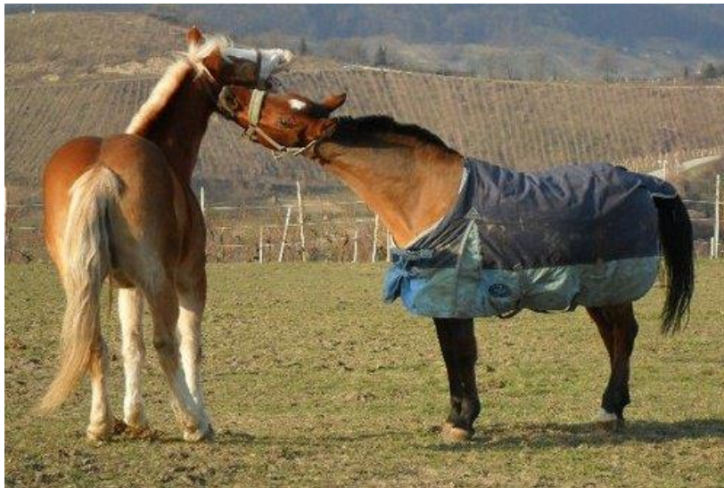
Slika 7. Konja konjeniškega kluba Karlo v izpustih na konjeniškem klubu.