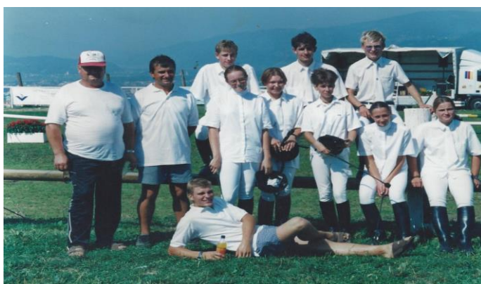
Slika 5. Prva ekipa konjeniškega kluba Karlo.

Ker so konji zelo prijazne in srčne živali, tudi pozitivno vplivajo na človeka, predvsem na ljudi s posebnimi potrebami. Z oddajanjem pozitivne energije pomagajo pri izboljšanju človekove gibljivosti in pozitivno vplivajo na njegovo duševnost. In prav zato se je vodja Konjeniškega kluba Karlo odločil, da jim omogoči terapevtsko jahanje. Ta oblika jahanja poteka tako, da ob konju in jahaču hodita dve izkušeni osebi. Ena vodi konja, druga pa jahača zaposli z določenimi vajami na konjskem hrbtu.