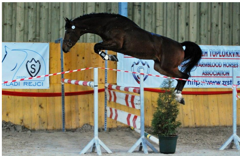
Slika 8. River Stone, konj vodje tekmovalne ekipe, na prvenstvu v prostih skokih, za konjeniški klub dosegel 1 mesto. ( https://scontent-vie1-1.xx.fbcdn.net/hphotos-xaf1/v/t1.0-9/190591_191909687508888_6657302_n.jpg?oh=26b889d43d6b8ff967917ea791bdf55&oe=5733E05B )