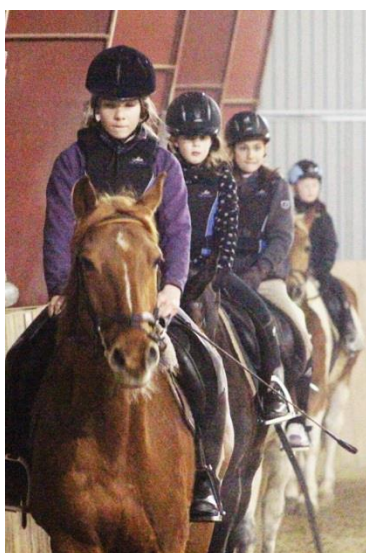
Slika 6. Jahalna šola konjeniškega kluba Karlo. ( https://scontent-vie1-1.xx.fbcdn.net/hphotos-xpf1/t31.0-8/s960x960/892250_549865375046649_1489561723_o.jpg )