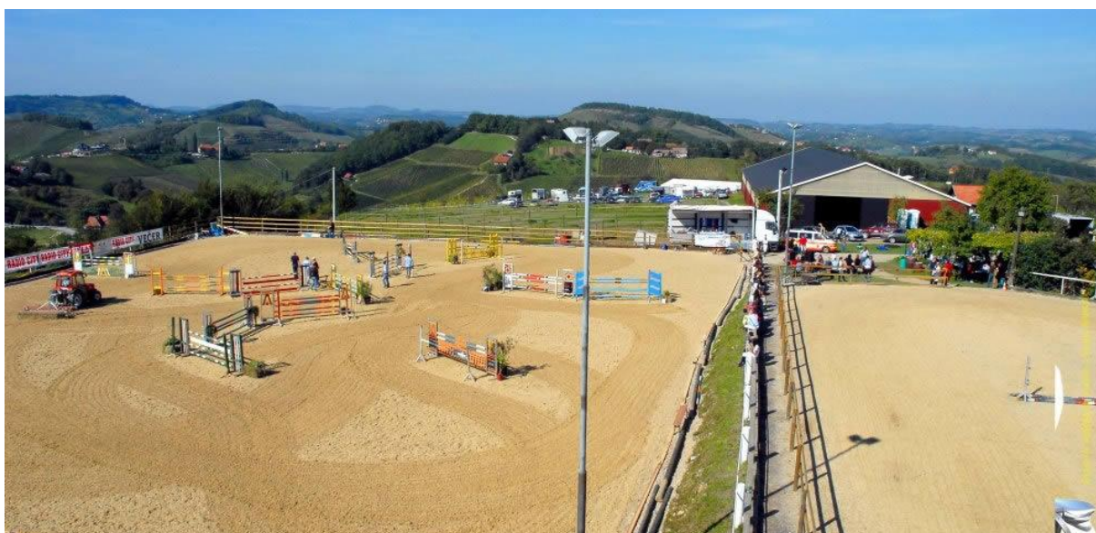
Slika 4- Pogled na konjeniški klub Karlo danes ( http://www.kkkarlo.si/wp-content/uploads/2015/12/news3.jpg )

Danes ima Konjeniški klub Karlo vse izobraževalne programe večinoma usmerjene v tekmovanje, in sicer v premagovanje ovir. Premagovanje ovir je zelo zahtevna disciplina, saj morata biti konj in jahač vsak trenutek usklajena in morata združiti svoje misli in namene v eno samo misel: premagati parkur.