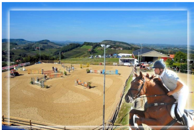
Slika 1. Vodja tekmovalne ekipe in pogled na konjeniški klub Karlo ( https://scontent-vie1-1.xx.fbcdn.net/hphotos-xpa1/v/t1.0-9/555134_549865625046624_2071381728_n.jpg?oh=487d84882f4239896a018622a1dc624c&oe=5767B2B2 )