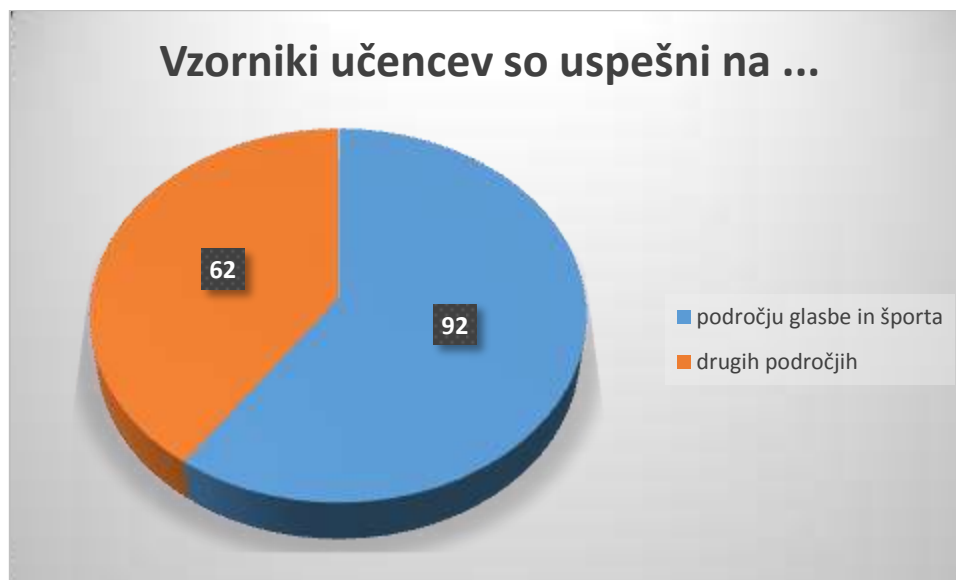
Graf 3: Na katerih področjih so uspešni vzorniki učencev

Mnogi menijo, da imajo v veliki večini vzornike iz tujine le starejši učenci in da je izbira vzornika iz svoje domovine prvina mlajših učencev, vendar narodna pripadnost oseb po katerih se zgledujejo mlajši učenci dokaz, da to več ne drži, saj je izmed vseh vzornikov mlajših (teh je bilo 23) le še 12 iz Slovenije in 11 iz tujine.