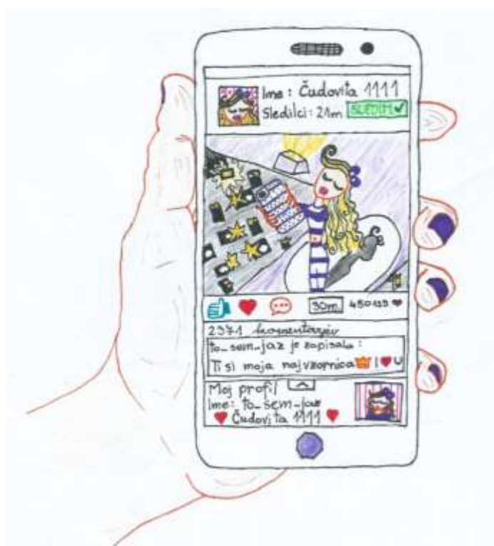
Slika 7: Vzorniki na socialnih omrežjih

Socialna omrežja so pravzaprav nekakšne mreže uporabnikov, ki omogočajo spletno komunikacijo oseb. Te mreže uporabnikov dajejo posamezniku občutek, da so lahko v stiku z svetovno znanimi zvezdami in tudi s svojimi vzorniki. Tako lahko še bolj temeljito spremljajo njihova življenja in jim poskušajo biti podobni.