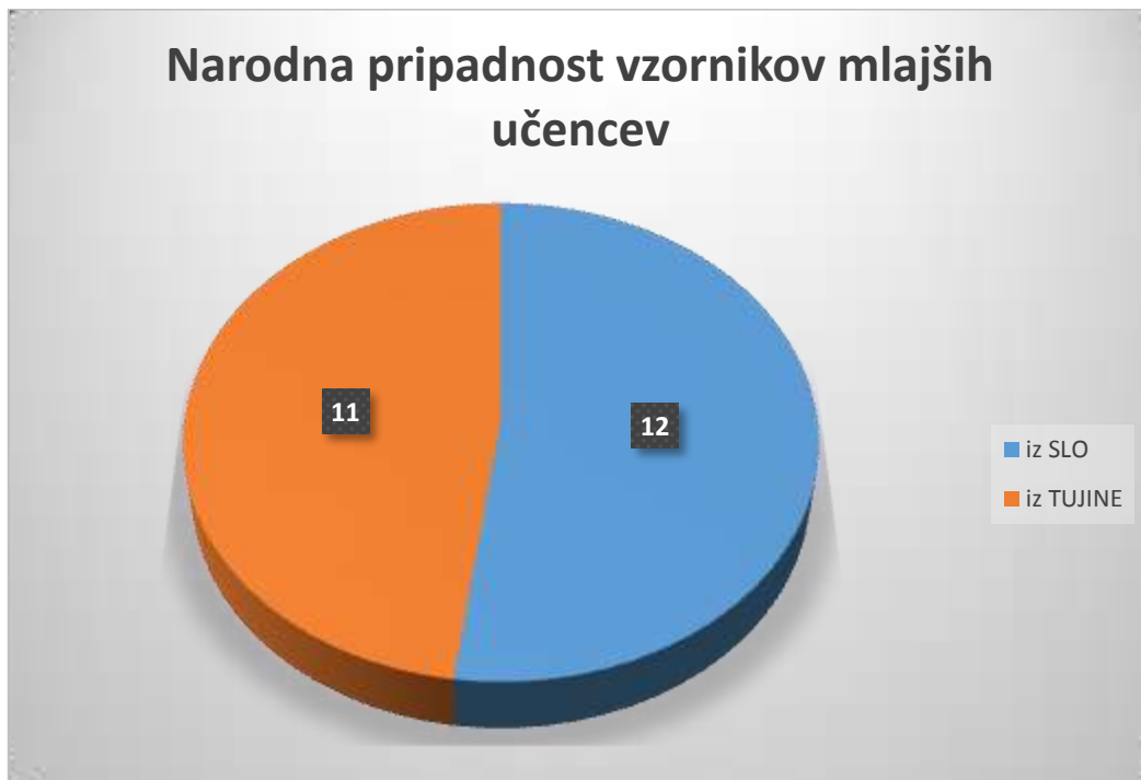
Graf 4: Narodna pripadnost vzornikov mlajših učencev

Izmed 166 vzornikov, ki so bili navedeni, jih je bilo le 51 iz Slovenije in kar 113 iz tujine. Najpogosteje so ti prihajali iz Amerike.