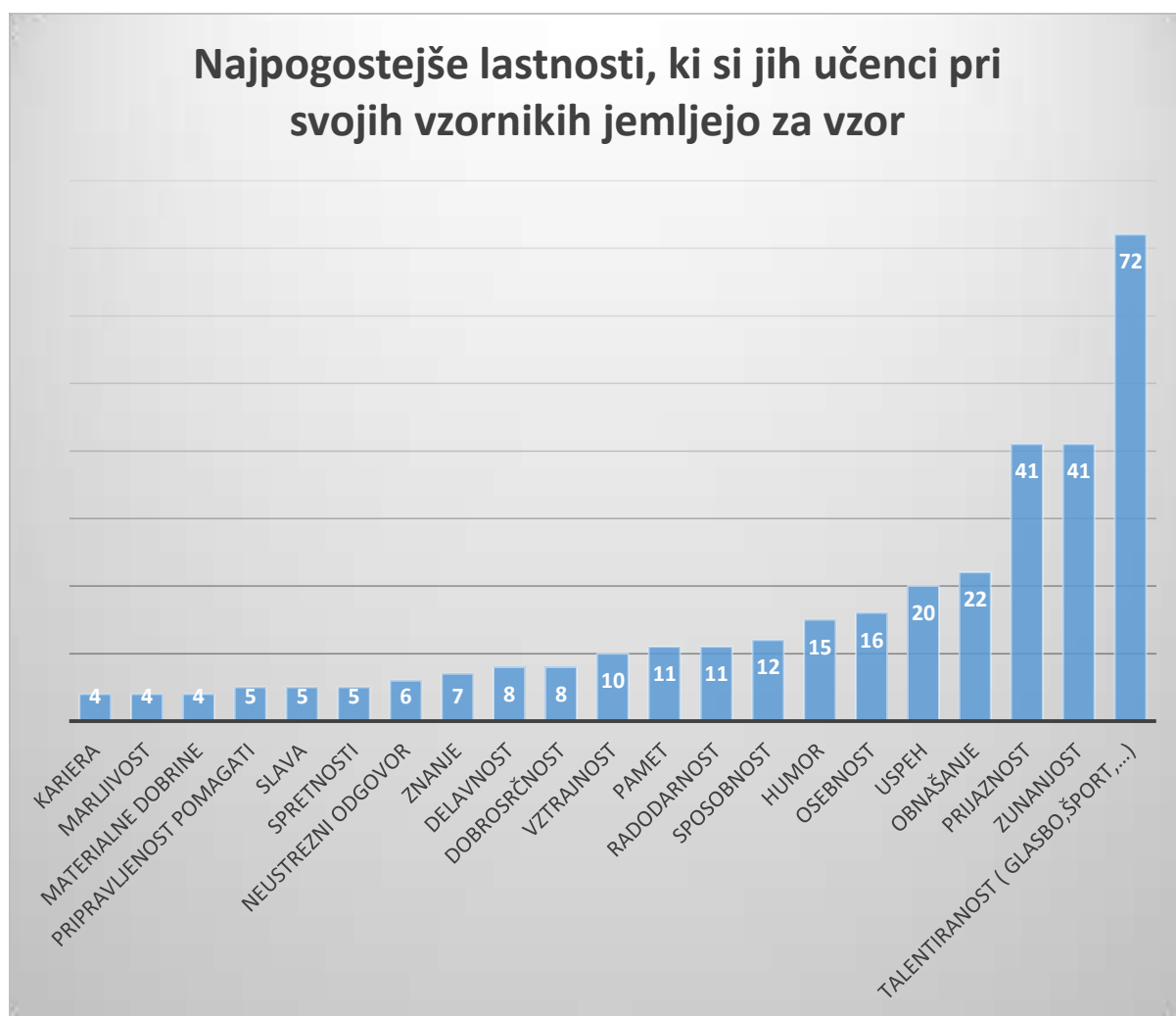
Graf 7: Najpogostejše lastnosti, ki si jih učenci pri svojih vzornikih jemljejo za vzor

Lastnosti, ki si jih učenci ne želijo posnemati so predvsem obnašanje, zunanost in nesramnost, a jih kar 33 ni podalo odgovora, kar si lahko razlagamo kot navidezno popolnost vzornika v očeh posnemovalca.