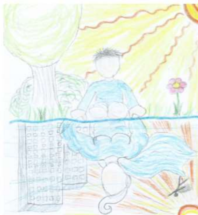
Slika 1: Odsev, avtoričino delo

Prav tako lahko oziroma je priporočljivo, da imajo svoje vzornike tudi odrasli, ki so že svoje unikatne osebnosti, saj jim vzorniki lahko pomagajo pri doseganju še višjih ciljev na načrtani življenjski ali karierni poti.