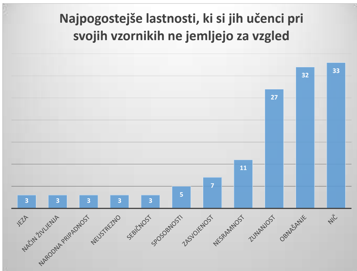
Graf 8: Najpogostejše lastnosti, ki si jih učenci pri svojih vzornikih ne jemljejo za vzgled

Učenci zase predvsem menijo, da so vzor svojim družinskim članom, sošolcem in prijateljem ter da se ti zgledujejo po njihovi zunanosti talentu in prijaznosti, po istih lastnostih po katerih se učenci zgledujejo pri svojih vzornikih. Tisti učenci, ki pa zase menijo da niso drugim vzorniki (teh je bilo 75), pa kot osebe, ki bi se lahko zgledovale po njihovem talentu, prijaznosti in lepemu vedenju, navajajo družinske člane, sošolce in prijatelje, povsem iste osebe, ki jih navajajo učenci vzorniki. Prišla sem tudi do ugotovitve, da si večina učencev, ki zase mislijo da niso vzorniki, prav tako ne predstavljajo svojih dobrih lastnosti kot vrednih posnemanja in dejstva da bi se lahko drugi po njih zgledovali, saj kar 41 učencev ni odgovorilo na vprašanje Komu bi lahko bil vzornik , od teh pa kar 21 učencev ni navedlo odgovora pri vprašanju Kaj bi si lahko drugi pri tebi vzeli za zgled . Vendar je na vprašanje Ali si tudi ti komu vzornik? približno 50 % učencev odgovorilo pritrdilno, 35 % z ne in 15 % ni podalo odgovora, zato potrjujem hipotezo Učencev, ki si želijo biti vzorniki je več kot tistih, ki te želje nimajo .