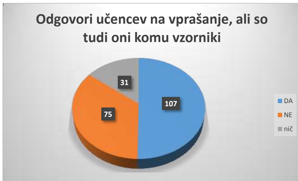
Graf 9: Odgovori učencev na vprašanje, ali so tudi oni komu vzorniki