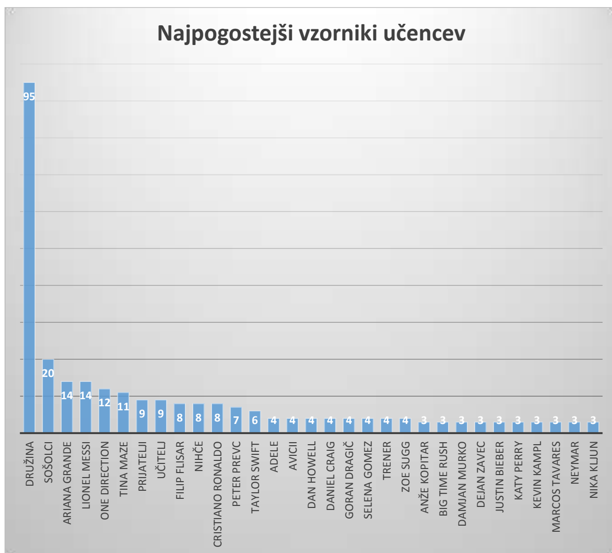
Graf 2: Najpogostejši vzorniki učencev

V skoraj vseh primerih, razen v osmih izmed 213, so učenci navedli vsaj enega vzornika, s čimer delno potrjujem svojo hipotezo Vsi učenci (mlajši: učenci 4. in 5. razreda in starejši: učenci 8. in 9. razreda) imajo vzornika ali več vzornikov , saj ta ne drži v manj kot 4 % vseh odgovorov. Pomembna je tudi ugotovitev, da povprečno število vzornikov na učenca znaša 1,