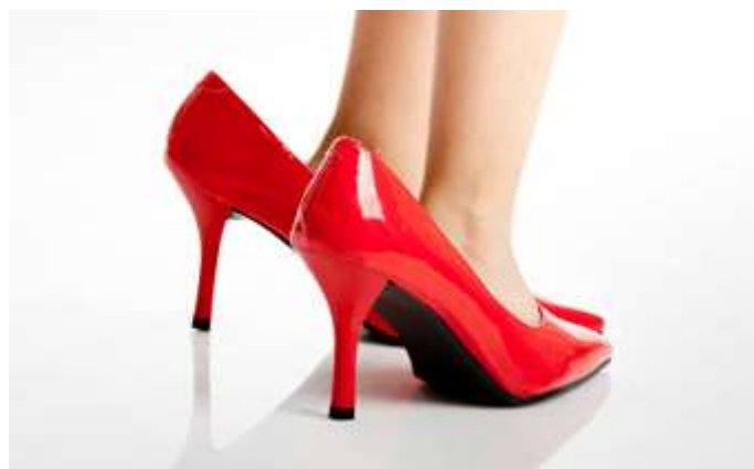
Slika 2: http://media.lifeportal.ch/data/artikel/1166/eltern-vorbild-g.jpg , pridobljeno 25. 1.

S takšnimi ali drugačnimi lastnostmi lahko vzornik na druge vpliva z namenom ali povsem nehote.