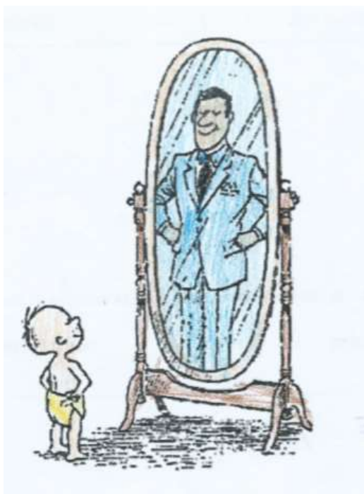
Slika 2: ( http://s3.hubimg.com/u/6124570_f248.jpg ) dostopno, dne 3. 12. 15, pobarvala učenka 4. razreda naše šole