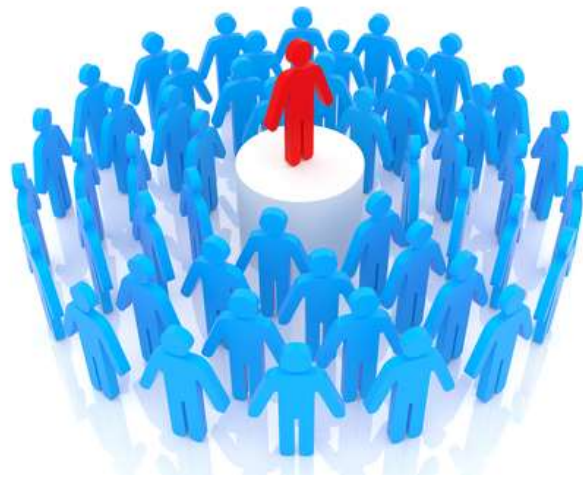
Slika 4: http://www.blr.com/html_email/images/WIR/SDA/role-models.jpg , pridobljeno 25.

Vsak vzornik je v svojem položaju tudi nekakšen pasiven vodja skupine, ki mu sledi. Še posebej z zadnjo od zgoraj navedenih definicij to lahko potrdimo, saj je splošno znano, da ima vzornik velik vpliv na ljudi, ki se po njem zgledujejo. Posledično ljudje tudi spreminjamo svoj pogled na življenje, človeka in svet.