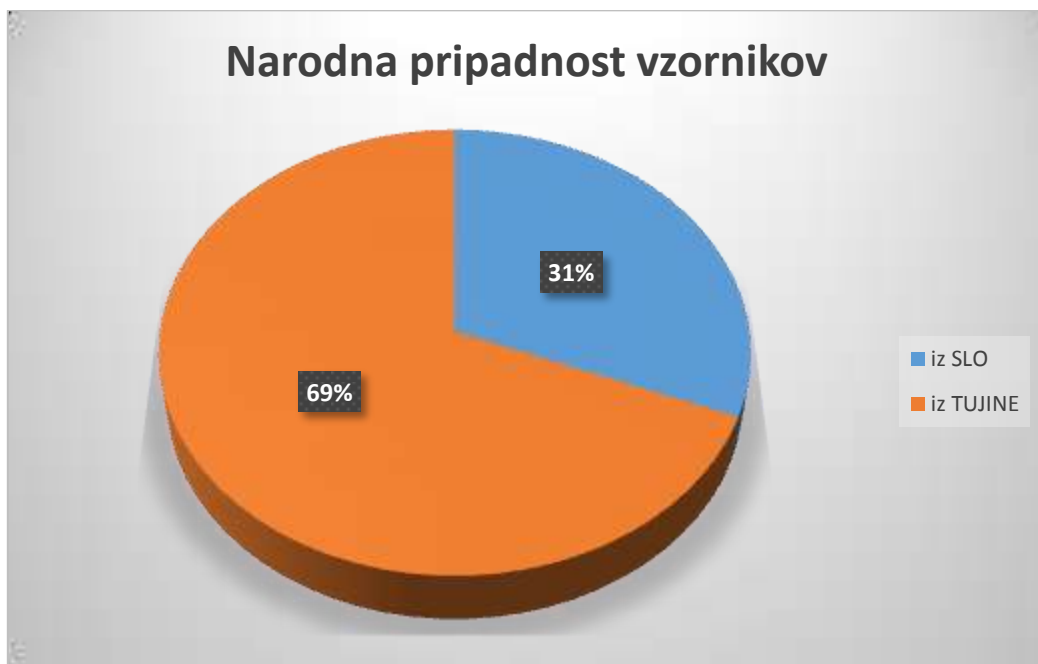
Graf 5: Narodna pripadnost vzornikov

Izmed 166 vzornikov, ki so bili navedeni, jih je bilo le 51 iz Slovenije in kar 113 iz tujine. Najpogosteje so ti prihajali iz Amerike.