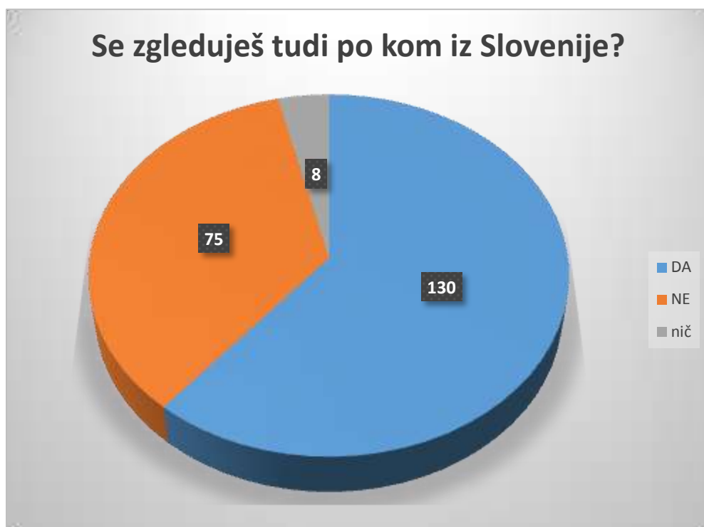
Graf 6: Odgovori učencev na vprašanje Se zgleduješ tudi po kom iz Slovenije

Ta razkorak med tema dvema ugotovitvama, si lahko razlagamo, kot dejstvo, da se manjšina zgleduje po povsem svojih vzornikih, a se hkrati večina zgleduje po svojih bližnjih (prijateljih, sošolcih, družini ...)