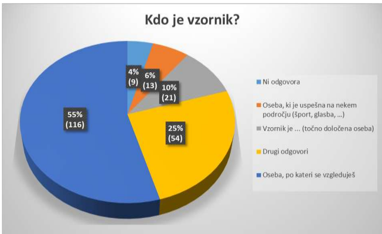
Graf 1: Kdo je vzornik

Z drugim vprašanjem sem pridobila odgovor na vprašanje, kdo so vzorniki učencev. Največji vzor, s kar 95 navedenimi omembami, je družina. Staršem, bratom, sestram in drugim ožjim sorodnikom, po lestvici vzornikov sledijo sošolci, tem pa prva dva posameznika. To sta ameriška pevka in igralka Ariana Grande in argentinski nogometaš Lionel Messi, oba sta zbrala 14 glasov. Sledi jima britanska glsbena skupina One Direction, tej pa prva slovenska (posamična) vzornica, Tina Maze. Nato so se med največkrat navedene vzornike uvrstili tudi: