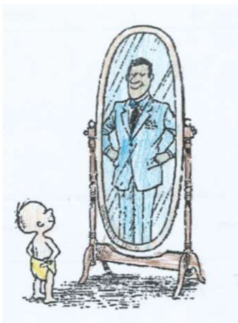
Slika 5: pobarvala učenka 4. razreda naše šole