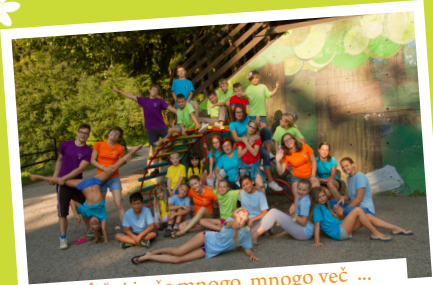
različni in še mnogo, mnogo več ...