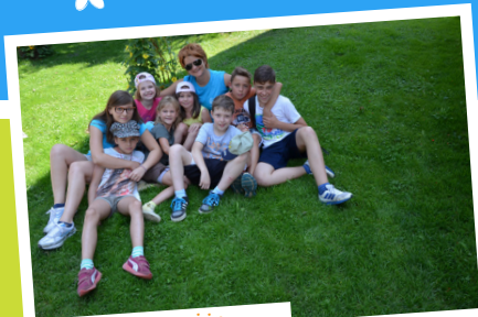
... ponosni in