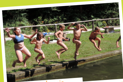
kopanje, plavanje ...