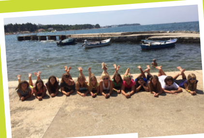
kopanje, plavanje ...