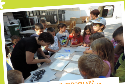
... in še mnogo, mnogo več ...