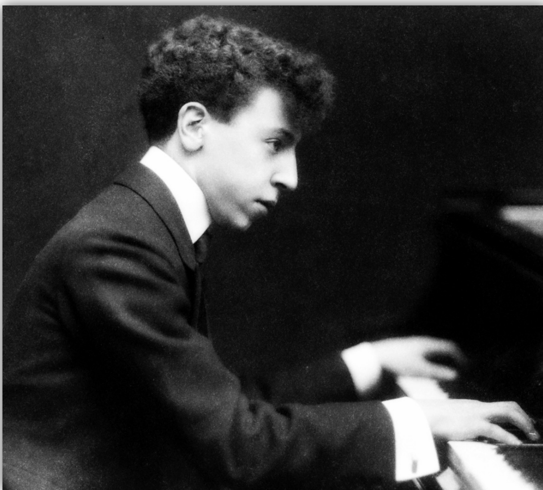
Slika 5. Arthur Rubinstein