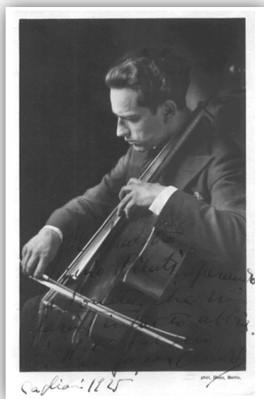
Slika 8. Gaspar Cassado

Koncert Gasparja Cassada 29 je potekal 25. oktobra 1928 v veliki dvorani Uniona. Za koncert je vladalo veliko zanimanje, saj naj bi Maribor tako velikega umetnika še ne slišal. 30 Koncert je bil redka priložnost za uživanje prvovrstne umetnosti. Po poročanju Mariborskega večernika Jutra je slavni virtuoz na violončelu pričaral različna čustva: »Slišali smo tožbe srčnih bolezni, vriskanje radosti, ihtenje, porednost, plakanje, smeh, skratka ona glasba je vedrila naš mračni duh.« 31 Avtor kritike je bil očaran nad virtuofovo igro: »Izrazita, tako rekoč nedosegljiva interpretacija klasičnih skladb [...] karakteristična izvedba [...] direktnost v podajanju [...] so nas ravno tako zadivile kakor temperamentnost [...]«. Dvorana je bila skoraj polno zasedena. Ob klavirju je umetnika spremljala Berta Jahn Beer. Ob koncu sta bila oba deležna najburnejših aplavzov, v prvi vrsti seveda violončelist. Zadovoljno mariborsko občinstvo je bilo »lepo razpoloženo in je le stežka odhajalo«. 32