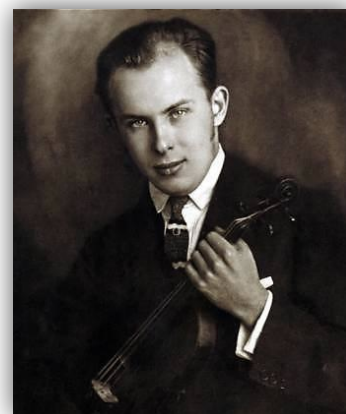
Slika 9. Vaša Přihoda

Koncert violinista Vaše Přihode 35 je potekal 21. februarja 1930. Igral je Goldmarkove Variacije na Beethovno arijo Nei cor piu non misento , Schubertovo Ave Mario in Mozarta. Publika je bila navdušena nad popolnostjo tonov. 36 Občudovala je njegovo tehnično rutino in globoko igro. Unionsko dvorano, ki je bila nabito polna, je za vsako točko napolnil bučen aplavz. Tako je »mojster violine« ob koncu dodal še nekaj točk izven programa. 37