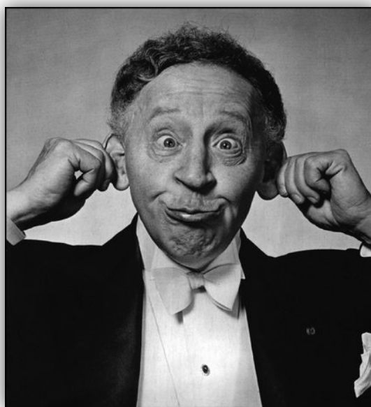
Slika 4. Arthur Rubinstein