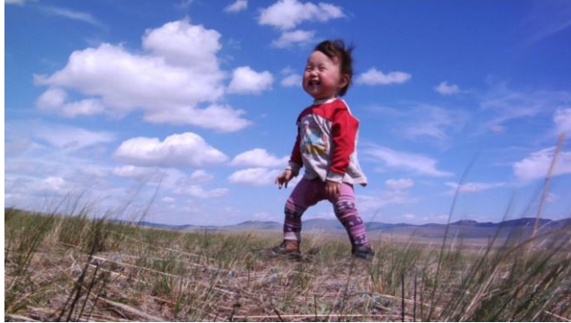
Slika 6: Bayar

ljudmi in kot vemo soljudje, predvsem v prvih letih življenja, močno vplivajo na otrokov karakter. Res je, sami lahko vplivamo na svoje življenje, vendar nas kultura v kateri živimo nekako usmerja.