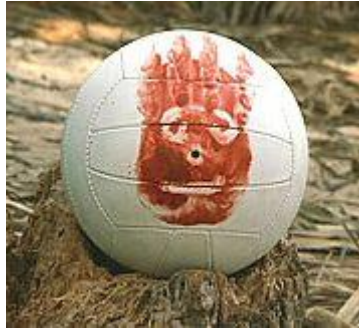
Slika 3: Fotografija Wilsona – prijatelja Chucka v filmu Brodolom

Iz navedenega sklepam in se pridružujem razmišljanju, da potrebujemo ljudi okrog nas, potrebujemo potrjevanje s strani drugih in potrebujemo srečo. In sami ne moremo biti srečni. Prav zato si je v pomoč pri preživetju tudi Chuck v filmu Brodolom oblikoval namišljenega prijatelja »Wilsona«, se z njim pogovarjal, zanj skrbel in tudi žaloval, ko ga je izgubil.