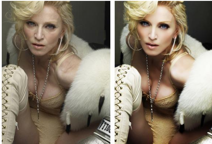
Slika 4: Primer fotografije pred in po obdelavi s Photoshopom

Dober primer tega je spodnja fotografija pevke Madonne brez in obdelana s Photoshopom.