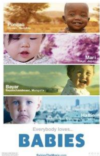
Slika 5: Naslovnica filma The Babies (Dojenčki)

Film predstavlja prva leta štirih dojenčkov iz Tokia (ime: Mari ), Mongolije (ime: Bayar ), Namibije (ime: Ponijao ) in San Francisca (ime: Hattie ).