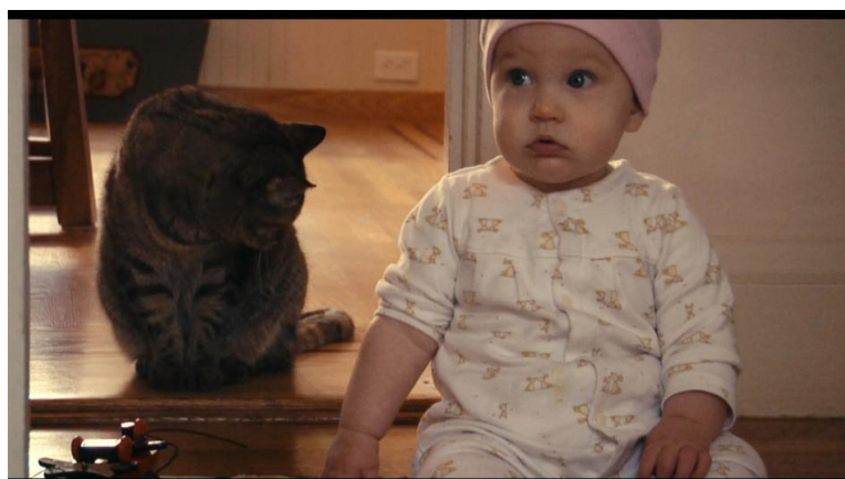
Slika 9: Hattie

Mari je deklica, ki se je rodila v Tokiu. Že nekaj mesecev pred njenim rojstvom sta se starša pripravljala na njen приход. Kupila sta ji vse in še več. To se mi ne zdi ustrezno. Deklica je dobila napačne predstave o tem, kaj je v življenju pomembno, saj so ji starši kupovali razne visoko tehnološko razvite izdelke, namesto da bi se več časa ukvarjali z njo in ji na pravilen način izkazovali ljubezen. Posledično je bila veliko časa slabe volje, zajokala je veliko večkrat, kot ostali otroci in menim, da je za to kriv način vzgoje njenih staršev.