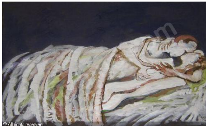
Slika 6: Spolnost (Spolnost, 2010)