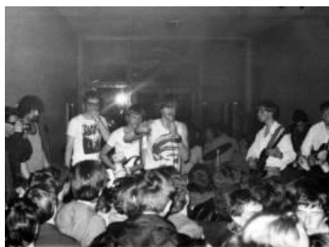
Slika 2: Koncert punk skupine Lublanski psi (Koncert punk, 2013)

Punk ali punk rock je protiinstitucionalno glasbeno gibanje, ki se je razvilo med letoma 1976 in 1980. Med začetnike te zvrsti pa uvrščamo skupine The Ramones, Sex Pistols, The Clash