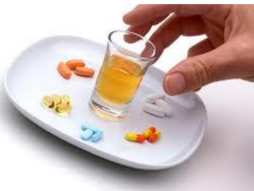
Slika 7: Opojne substance (Opojne substance, 1999-2012)