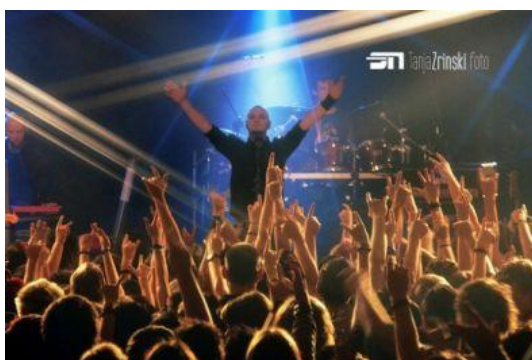
Slika 3: Koncert rock skupine Siddharta (Koncert rock, 2011)

Rock je razširjena glasbena zvrst v popularni glasbi, običajno uporablja vokal, (električne) kitare in močno poudarjen ritem. Rock je nastal v ZDA po drugi svetovni vojni. Razširil se je po vsem svetu, danes poznamo veliko zvrsti rocka. V veliko podzvrsteh so pogosto uporabljeni tudi instrumenti s tipkami, npr. klavir in sintetizator. Pihala in trobila so bila bolj razširjena ob nastanku rocka, danes pa so v glavnem zanemarjena, z izjemo saksofona, ki se počasi uveljavlja.