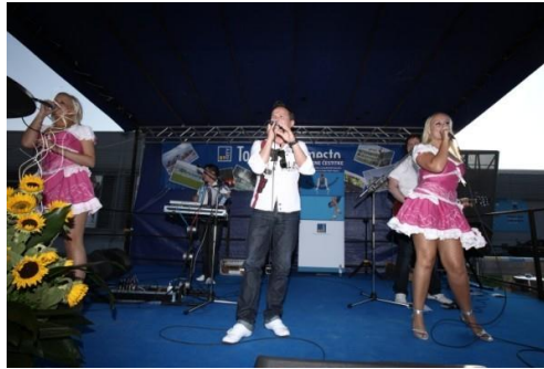
Slika 1: Koncert turbofolk skupine Atomik Harmonik (Koncert turbofolk, 2012)

Turbofolk je priljubljena glasbena zvrst, nastala v Jugoslaviji v poznih 80-ih 20. stoletja. Nastala je pod vplivom popularnih pop folk izvajalcev, kot je na primer Lepa Brena.