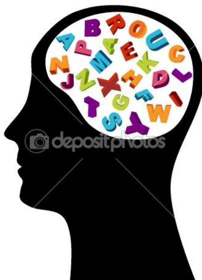
Slika 8: Bistvo sveta (Bistvo sveta, 2011)

Pri tej temi sva zajeli naslednja tematska jedra: odnos do družbe in sveta na splošno, bistvo življenja in sprejemanje okolja, v katerem živijo.