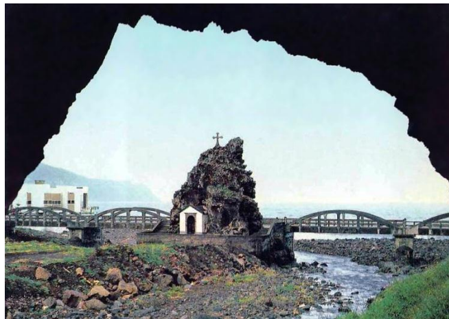
Slika 12: Capela de São Vicente