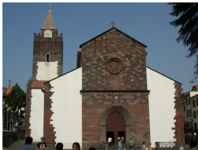
Slika 13: Sé Catedral