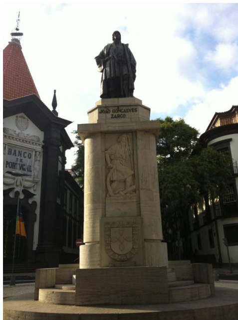
Slika 2: João Gonçalves v Funchalu