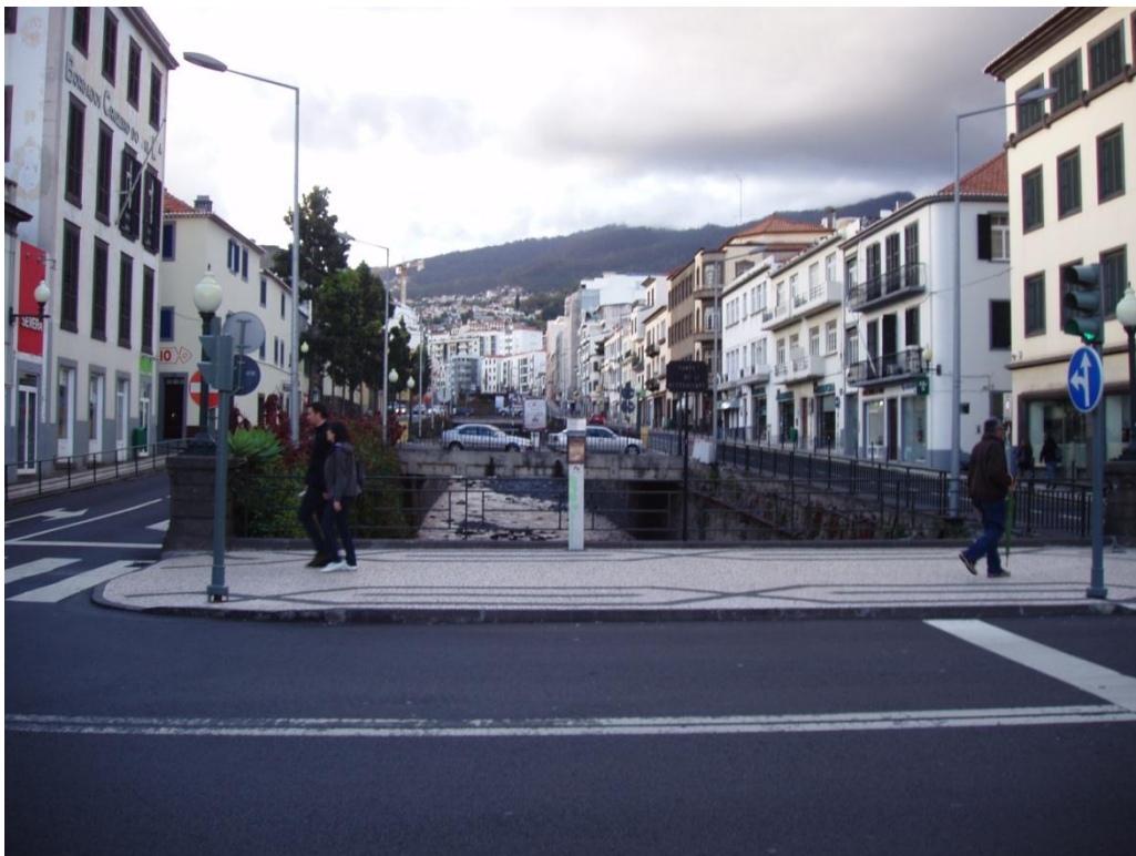
Slika 8: Funchal

Folklorna glasba je na otoku razširjena in se opira predvsem na lokalne glasbene inštrumente kot je machete, rajao, brinquinho in cavaquinho, ki se uporabljajo v tradicionalnih folklornih plesih. Pri plesih nujno uporabljajo značilno nošo.