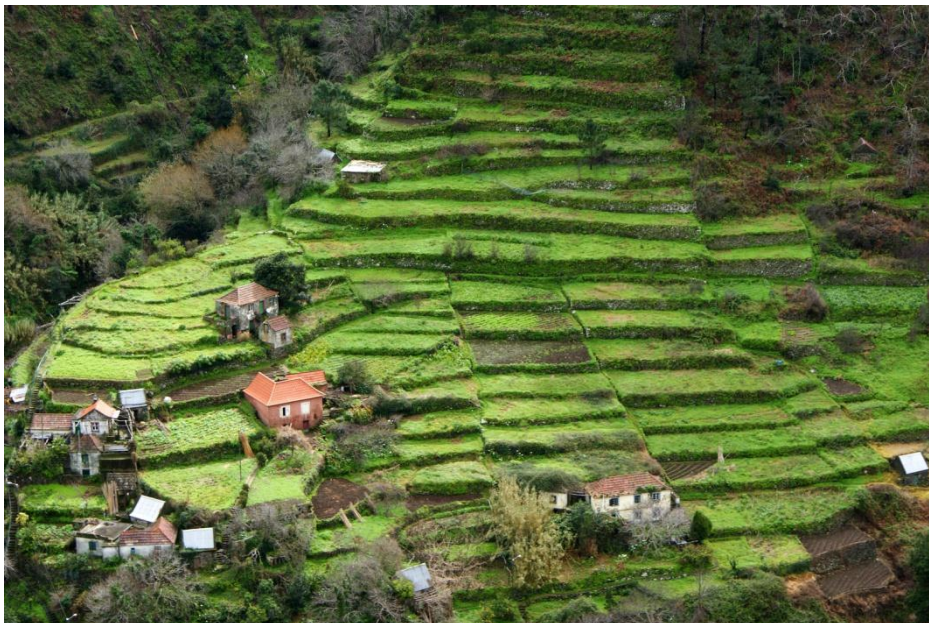
Slika 9: Obdelovalne terase