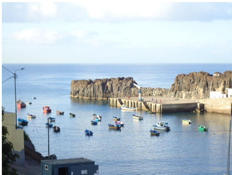
Slika 11: Ribiški čolni

Precej razširjen je tudi ribolov. Kadar se sprehajaš po obali, vedno zagledaš kakšnega ribiča. Zaradi geografskega položaja otoka najdemo tukaj različne vrste rib. Najpogosteje uživajo tuno. Espado (črni morski meč) pogosto postrežejo z banano.