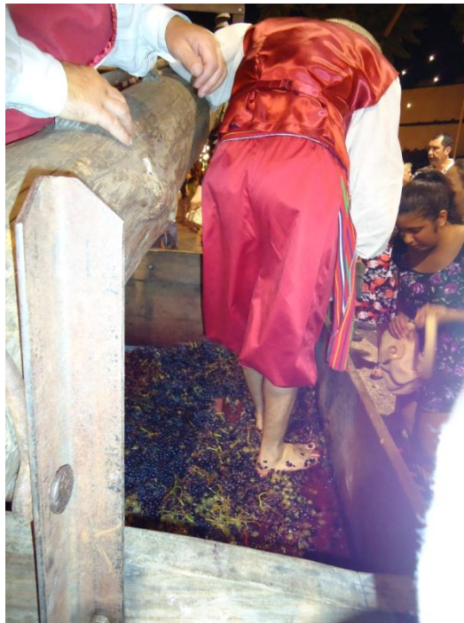
Slika 10: Vinogradništvo je zelo pomembno

Precej razširjen je tudi ribolov. Kadar se sprehajaš po obali, vedno zagledaš kakšnega ribiča. Zaradi geografskega položaja otoka najdemo tukaj različne vrste rib. Najpogosteje uživajo tuno. Espado (črni morski meč) pogosto postrežejo z banano.