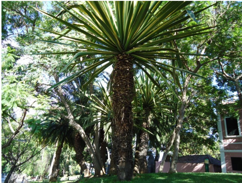
Slika 5: Rastlinstvo

Madeiro se nekoč pokrivali gozdovi imenovani Laurisilva. Lovorjev gozd uspeva na subtropskih območjih. Osnovna pogoja za ohranitev takšnih gozdov sta vlaga in zmerne temperature. Omenjeni gozd se je ohranil le na severu otoka, medtem ko so ga na južnem delu otoka že izkrčili. Že samo ime Madeira nam pove, da je bil nekoč ta otok v celoti porastel z gozdovi, saj madeira v portugalskem jeziku pomeni les.