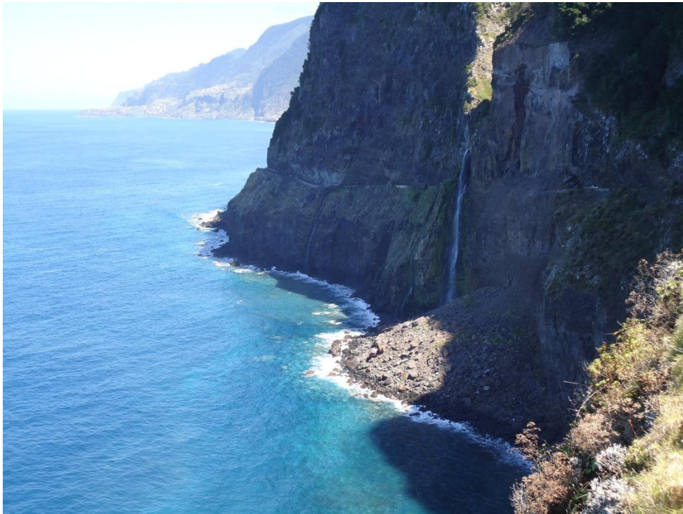
Slika 14: Klif

Na Madeiri ne primanjkuje rib, saj je ribištvo zelo pomembna gospodarska panoga. Najpogostejša riba je tuna. Ribe uživajo na različne načine. JEDI pa ne vsebujejo le rib, temveč tudi veliko mesa. Pod najbolj znane mesne jedi sodijo espatada, carne de vinho e alhos in picado. V glavnem uporabljajo perutnino, govedino in svinjino. Domačini se zelo radi pohvalijo z njihovo tradicionalno paradižnikovo-čebulno juho (originalno ime sopa de tomate e cebola). Značilna sladica je bolo del mel, kar bi lahko prevajali kot medena torta.