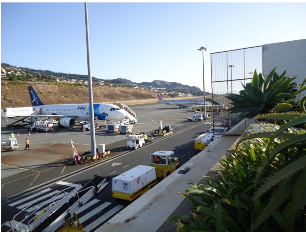
Slika 15: Letališče v Funchalu

Na otok je možno priti tudi z ladjo, natančneje s križarko, saj je oddaljenost od celine zelo velika. Glavno pristanišče se nahaja v Funchalu.