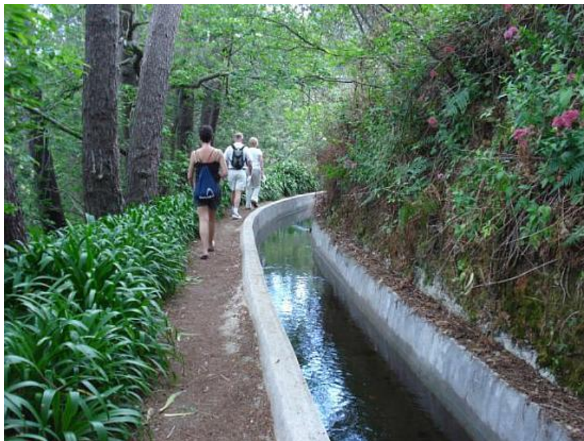
Slika 7: Levada