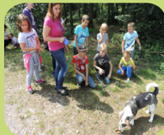
zavetišče za živali

Najbolj smo uživali na Otoku na Dravi, kjer nam je osvežitev v vročih poletnih dneh prišla še kako prav. Izleti so bili tudi letos najbolj priljubljeni, saj smo na skupno 31 izletih zabeležili okoli 2.500 obiskov.