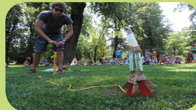
raketa na vodo