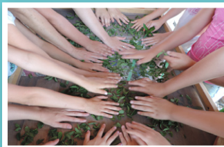
Na kmetiji Korenika

Srede so bile rezervirane za celodnevne sredine izlete. Letos so bili tematsko obarvani, naše teme pa povezane z varovanjem okolja in zdravim načinom življenja –izvedeli smo kaj je ekološko kmetovanje, zakaj je pomembno ločevanje odpadkov, kako lahko ohranimo planet z obnovljivimi viri energije, kako pomembno je gibanje v naravi, kaj je pravična trgovina... Seveda smo se pri tem tudi zelo zabavali, uživali na mnogih igralih, se kopali v bazenih in potokih... Rekordno število otrok (103!) se je udeležilo prav zadnjega sredinega izleta, ko smo obiskali čokoladnico in živalski park Zotter v sosednji Avstriji. Čokolad vseh mogočih okusov, oblik in agregatnih stanj smo pojedli koliko smo lahko, potem pa uživali v parku, kjer nam niso delale družbo le živali, temveč nas je pritegnilo tudi nešteto igral, v cirkuškem gledališču pa smo se prepustili domišljiji in se preizkusili v uporabi cirkuških rekvizitov.