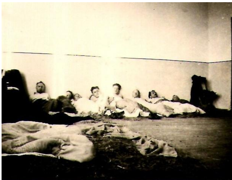
Slika 6: Pri počitku v »spalnici« v šoli Zoriolnici leta 1941.