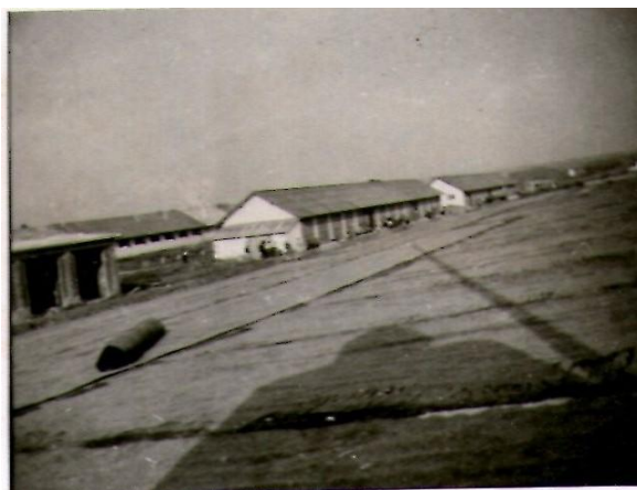
Slika 4 in 5: Taborišče slovenskih izgnancev v Slavonski Požegi leta 1941. Ker ni bi dovoljeno fotografiranje, sta bili sliki narejena naskrivaj.