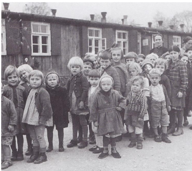
Slika 3: Ukradeni otroci v taborišču Frohnleiten leta 1942 (fotografija: Pickl, 1996, str. 209).

Leta 1942 so zaprli mojega brata, ki je bil nato obsojen na smrt. Zatem so zaprli še dve starejši sestri, ampak te dve so potem iz Starega piskra (v Celju) 29 izpustili domov. Brata, tega, ki je bil organizator, so aretirali koncem julija in je bil v zaporu, dokler ga 2. oktobra 1942 niso obsodili na smrt. 30 Mi smo pa potem bili 3. oktobra 1942 aretirani in pripeljeni v celjsko (okoliško) osnovno šolo, ki je bil zbirni prehodni center, kamor so nas pripeljali in nas že začeli popisovat in sortirati nas do 18 let stare, jaz sem spadal potem v skupino ukradenih otrok. 31 Prva skupina je bila od let dojenčkov do dveh let, druga let skupina je bila tri do šest let, tretja je bila od sedem do dvanajst in četrta od trinajst do osemnajst. Po skupinah so nas že v Celju