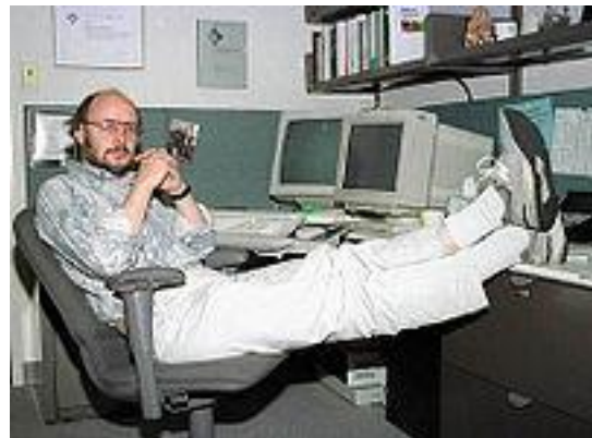
Slika 1: Računalnikar Bjarn Stroustrup, http://goo.gl/fzpjyj

Razvijati je začel leta 1979 in takrat se je jezik imenoval »C with Classes« (C z razredi). Od 90. let je eden najbolj priljubljenih komercialnih programskih jezikov. Najprej so C-ju dodali razrede, nato med drugim virtualne funkcije, preobložitev operatorjev, predloge in rokovanje z izjemami.