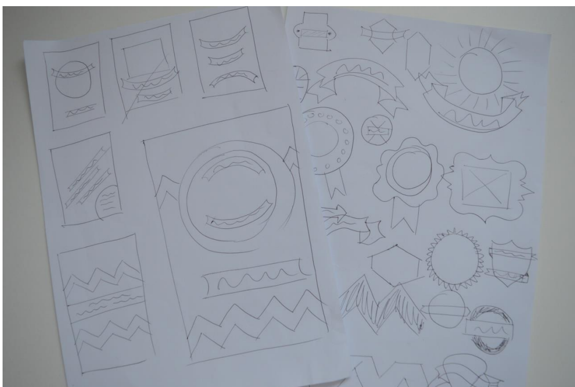
Fotografija 1: skice

Prvi korak je bilo razmišljanje o slogu. Ko sem imela v glavi razdelano podobo, sem jo prenesla na papir. Izdelala sem več skic in se nato po pogovoru s profesorico odločila za določen stil. Izbrala sem si retro stil, ki mi je zelo pri srcu, saj je nekoliko kičast, vendar lep.