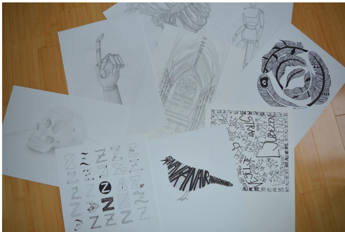
Fotografija 2: izdelki - avtorska fotografija

Spremeniti sem jih morala v digitalno obliko, zato sem jih poskenirala. Izdelala sem še nekaj natančnejših skic, nato pa se lotila računalniške izdelave.