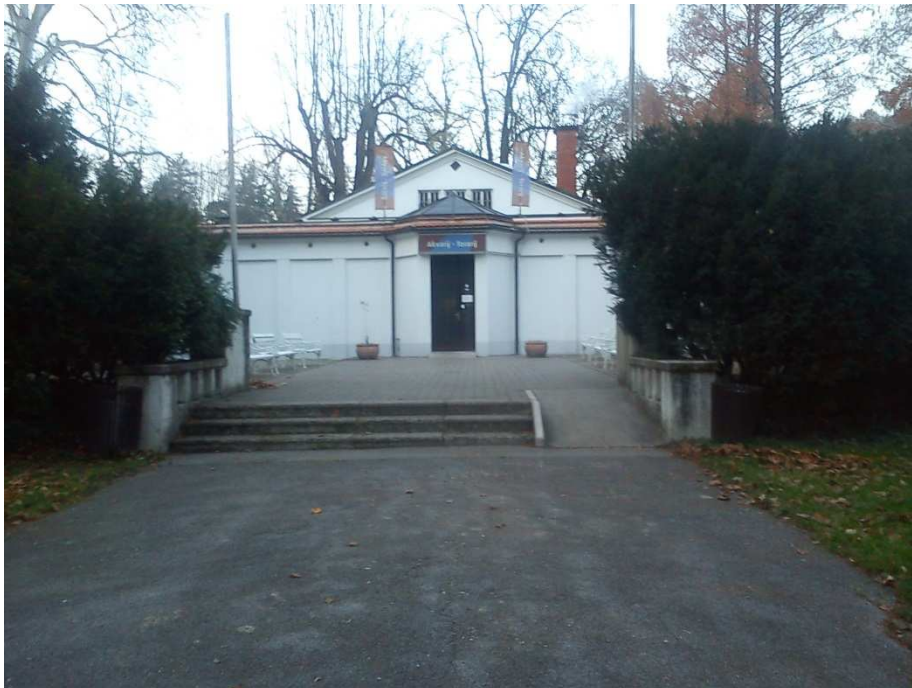
9. SLIKA: Akvarij–terarij