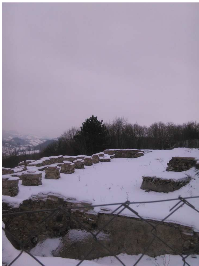
16. SLIKA: Arheološka najdišča na Piramidi

O Piramidi in njenem nastanku se je ohranilo veliko zgodb. Ena izmed zgodb, ki bi jo povedali otrokom, je zgodba o Piramidi iz knjige Darje Kosi S škratom Bolfenkom po Mariboru.