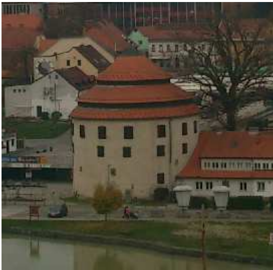
2. SLIKA: Pogled na Sodni stolp

Prvič je svojo podobo spremenil leta 1540, ko so ga pozidali v trdnjavsko obliko in ga pokrili s stožčasto streho, katera je nato v 17. stoletju pogorela. Obrambni stolp so v vseh letih večkrat dozidali, kar se odraža tudi v njegovem videzu. Do drugega nadstropja je bil stolp zgrajen v renesančnem slogu, a so ga nato povišali še za dve nadstropji, da so pridobili na njegovi višini, nazadnje pa so ga spremenili v času po drugi svetovni vojni, ko je nekako dobil tudi današnji izgled. Nahaja se na obrežju reke Drave, ob Mariborski tržnici ( http://maribor-pohorje.si/kaj-poceti/kultura/znane-stavbe-spomeniki-in-znamenja-stolpi-in-mostovi/obrambni-stolpi.aspx , 14.10.2014).