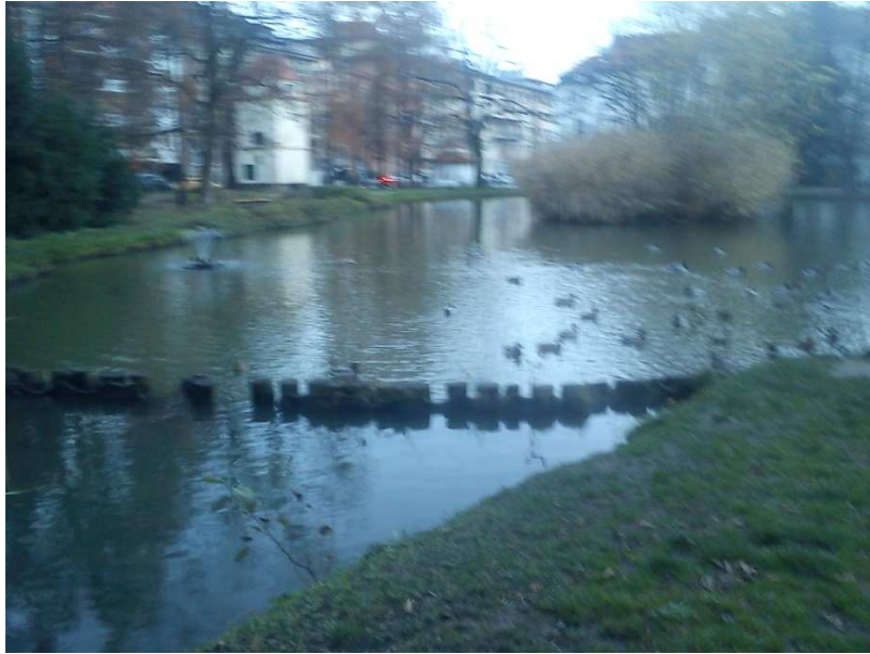
5. SLIKA: Jezero