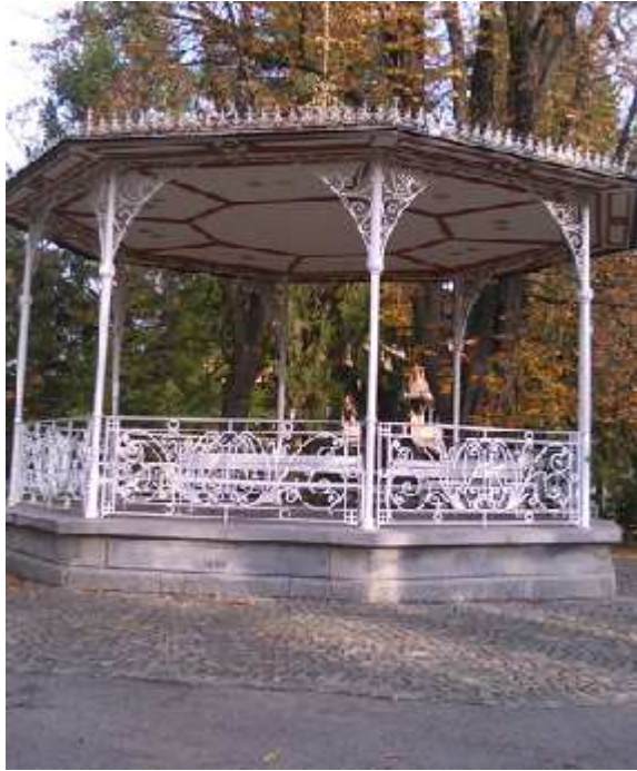
7. SLIKA: Pogled na mestni park