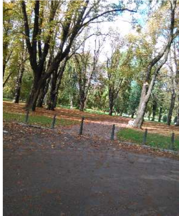
8. SLIKA: Pogled na Mestni park