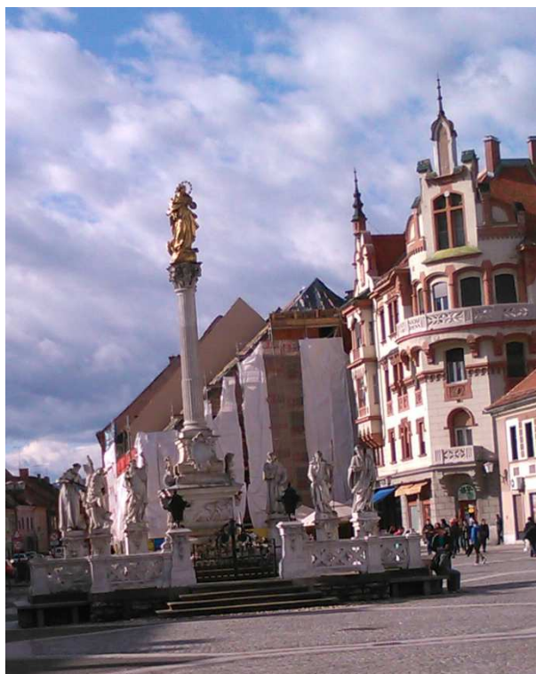
3.SLIKA: Kužno znamenje