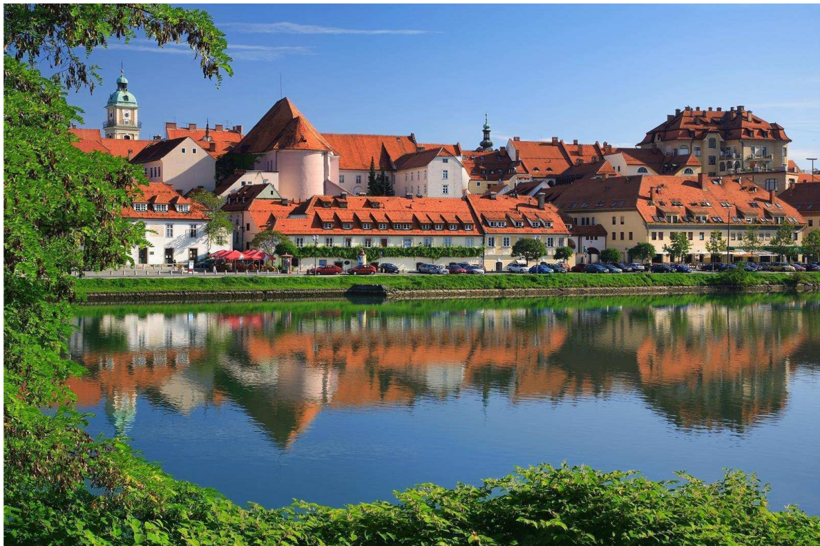
1. SLIKA: Lent

Lent je najbolj čaroben in najstarejši del mesta Maribor. Pred Hišo Stare trte svoje korenine globoko poganja najstarejša trta na svetu, ki je bila priča mnogim zgodbam, ki so se dogajale na obrežju reke Drave. Na Lentu se vsako poletje odvija festival Lent, ki je največji festival v Sloveniji na prostem in tudi eden večjih v Evropi. Na koncu vsakega festivala Lent se ob polnoči odvija ognjemet.