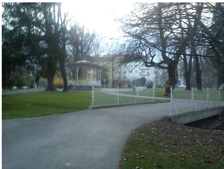
10. SLIKA: Pogled na Mestni park