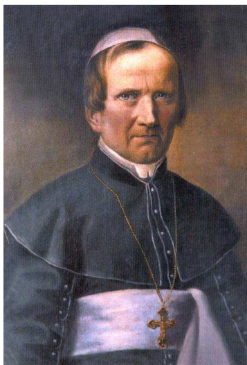
19. SLIKA Anton Martin Slomšek

Anton Martin Slomšek je prenesel škofijski sedež iz Sv. Andraža na Avstrijskem Koroškem v Maribor.