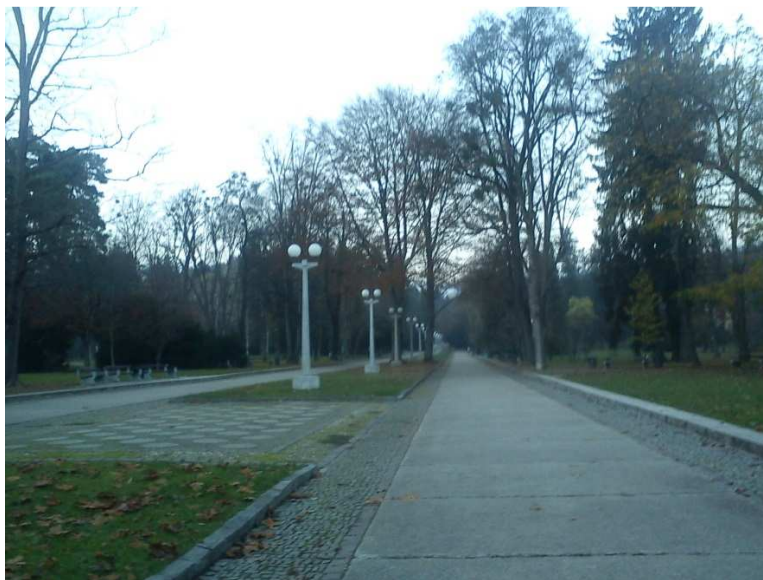
6. SLIKA: Promenada