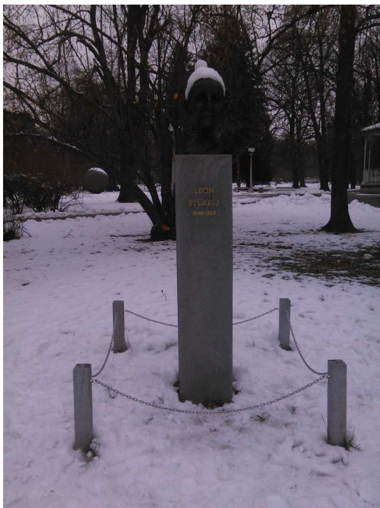
12. SLIKA: Spomenik Leona Štuklja