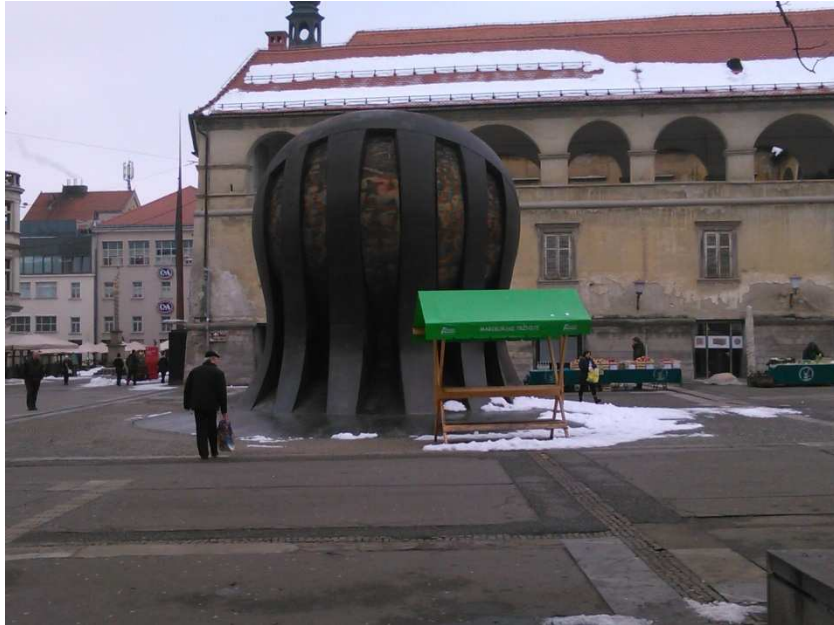
4. SLIKA: Mariborski mestni grad s spomenikom NOB