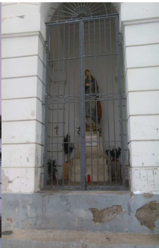
17. SLIKA: Kapelica na Piramidi