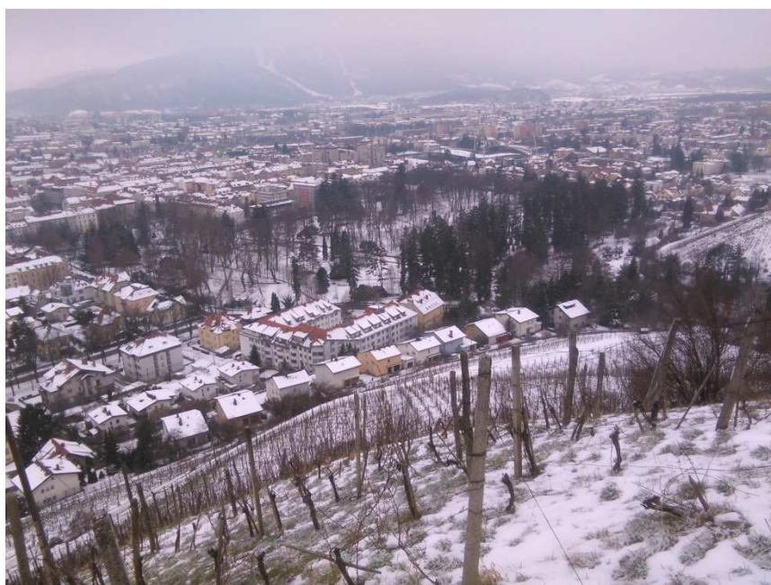
18. SLIKA: Pogled s Piramide