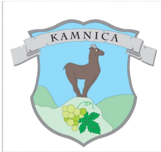
Slika 7: Sedanji grb Kamnice ( https://zupnijakamnica.wordpress.com )

Predlagamo, da grb vrnejo na župnišče, kjer je bil prej in naj tam služi svojemu namenu. Krajevna skupnost pa naj razpiše natečaj za grb, predlagamo osnovno idejo.