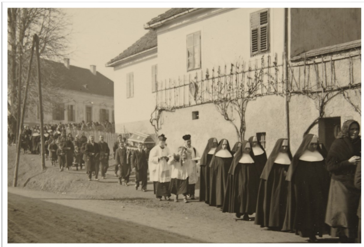
Slika 6: Župnišče s starim grbom (last župnišča Kamnica)

Gams od podobe divje koze v grbu, ali sploh od imena divje koze, Gams, Gemse, kajti svet je tukaj tak, da bi divje koze v njem ne mogle živeti. Zrak je za te planinke, ki so snega in prebistre planinske sape celo leto vajene, pretopel. Torej na divjo kozo tukaj pri krajevnem imenu ni misliti».