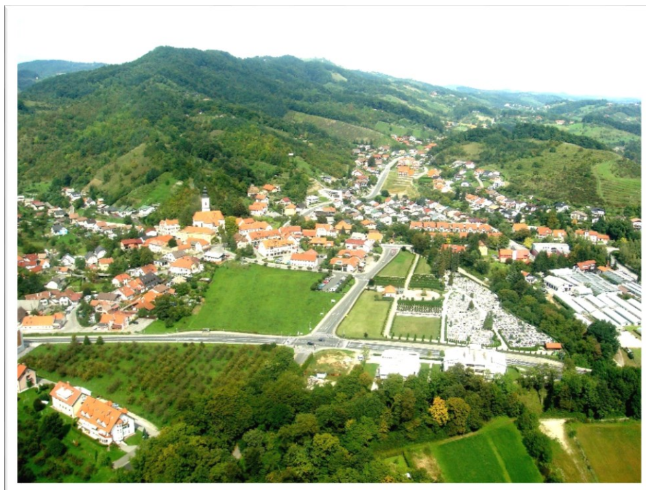
Slika 1: Kamnica

Večina prosti čas nameni potovanjem in spoznavanjem tujih dežel, medtem ko domači kraj slabo poznajo ali pa ga »uporabljajo« le kot spalno naselje. Prav je, da pogledamo na kraj z drugačnimi očmi, gremo na sprehod, na izlet do znamenitosti..... da pomislimo, kako se nekoč živeli ljudje tukaj, si ogledamo pročelja zanimivih stavb in se vprašamo, kdo je živel v njih. Zato smo iskali različne ideje in podali predloge za označitev poti skozi Kamnico do hriba in različne možnosti ureditve in rabe tega prostora.