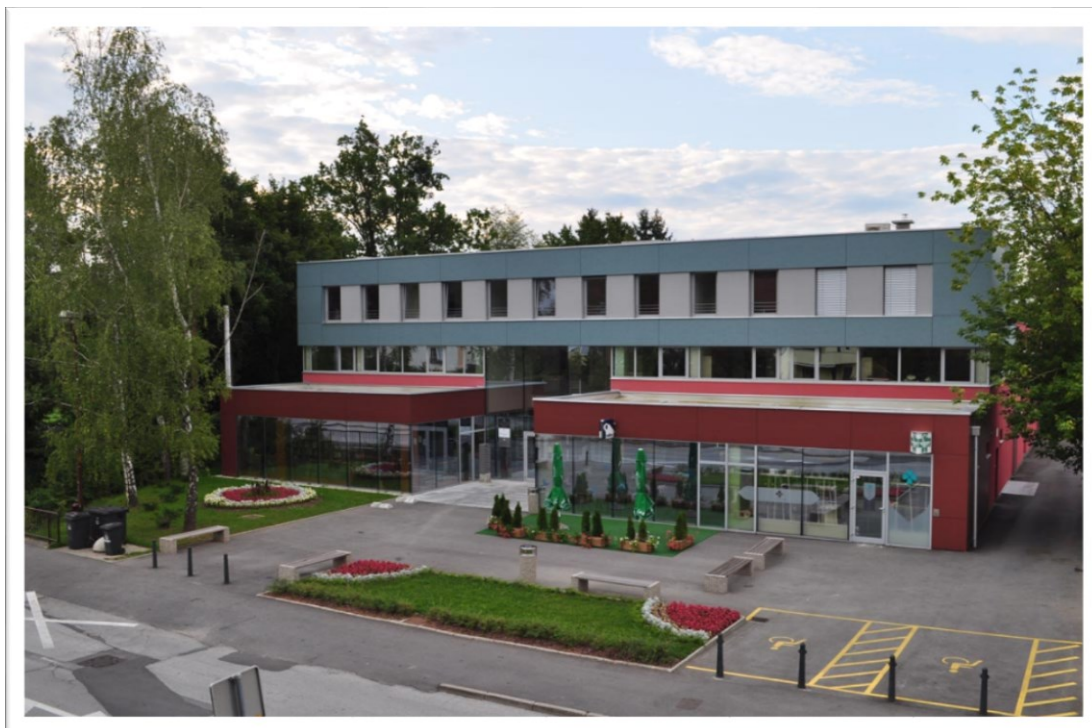
Slika 2: Kulturni dom Kamnica (pridobljeno KS Kamnica)

Martinova razgledna pot bi potekala iz središča kraja do razgledišča nad cerkvijo. Začetek poti bi bil na ploščadi pred kulturnim domom, kjer bi označili točko srečanja/ začetka z vetrovnico.