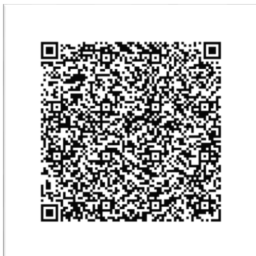
Slika 4: Primer QR kode (če želite izvedeti več, jo skeniranje)

Zaključek poti bi bil na vrhu prvega grebena, na razgledni točki.