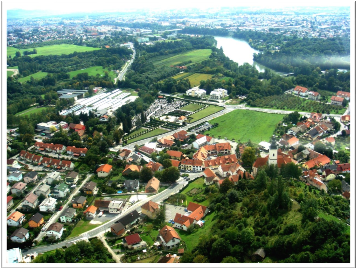
Slika 5: Martinova razgledna pot (fotografiral J. Mrak, junij 2012)