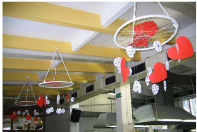
Slika 44: Okrasitev za valentinovo (foto: članica likovnega krožka) Slika 45: Pred kuhinjo (foto: članica likovnega krožka)