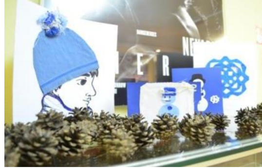
Slika 13: Čestitke med storži