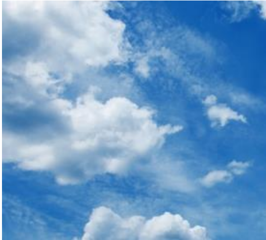
Slika 7: Nebo ( http://www.sensa.si )