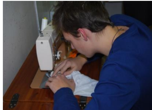
Slika 41: Šivanje