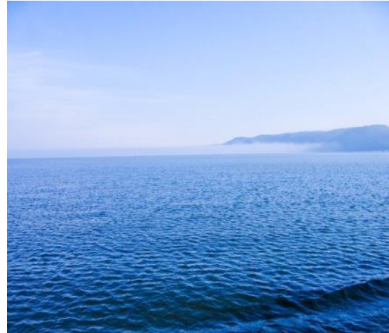
Slika 8: Morje

Modra barva je prav tako barva pesnikov in filozorfov, je duh resnice in višje inteligence. Pomagala naj bi tudi pri zdravljenju kašlja, bolečega grla, zdravljenju vnetij... Sciazari (str. 19) navaja, da je modra umirjena, pomirjajoča barva, ki jo povezujejo z višjo ravniyo zavesti. Pomeni noč, zato nas tako kot temno nočno modro nebo sprošča in umirja. Svetlo modra in blede modra nas pomirjata in varujeta pred hrupnostjo in vročičnostjo dneva ter preganjata slabost. Modra spodbuja umski nadzor, krepi jasnost misli in ustvarjalnost. Preveč temne barve lahko delujejo depresivno. Psihološki učinek modre: hladnost, očiščenje, sprostitvev, umska pomiritev, spokojnost, mir in modrost, brezmejnost morja in neba, čutnost, upanje, zaupanje, zvestoba, prilagodljivost, gotovost, sprejemanje. Sciazari (str. 46) svetuje, da se oblačimo v modro, če smo potrebni miru in sprostitve, ali če smo utrujeni. Modra utrjuje zaupanje, samozaupanje in občutek odgovornosti za druge. Prinaša razumevanje, modrost, spodbuja sprejemanje odločitev.