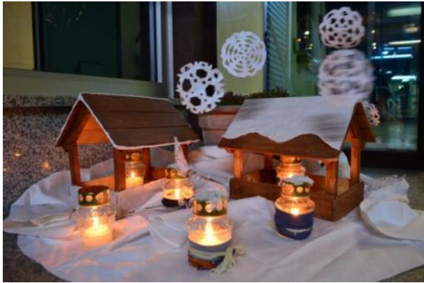
Slika 9: Hiške