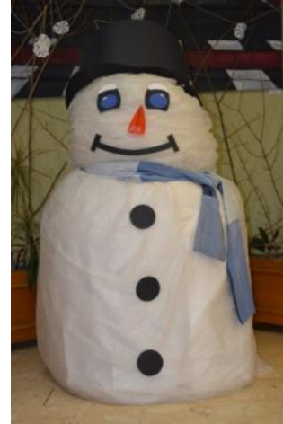
Slika 19: Snežak je osvajal z nasmehom (foto: članica likovnega krožka) Slika 20: Snežak (foto: članica likovnega krožka)