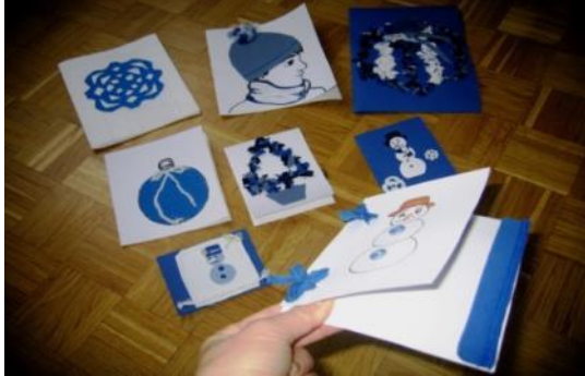
Slika 12: Čestitke