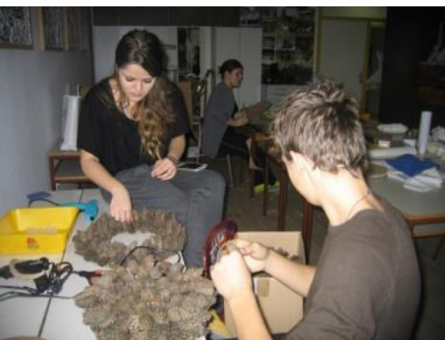
Slika 42: Uporaba storžev