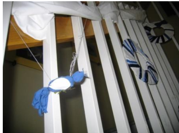
Slika 17: Detajl