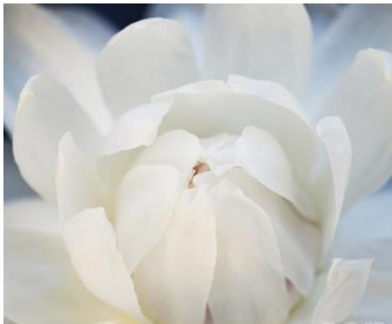
Slika 5: Bela roža ( http://www.sensa.si/bela )

Bela barva je barva, ki vsebuje vse barve barvnega spektra, lahko bi ji rekli akromatična barva, medtem ko je črna njeno nasprotje in pomeni odsotnost vsake barve. Bela barva nima barvnega tona in je pogosto uporabljena za svetljenje in mešanje z drugimi barvami.