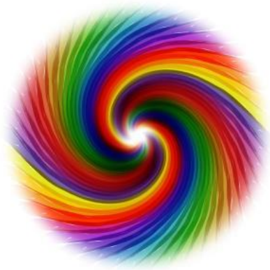
Slika 3: Barve

Barva je neke vrste občutek, ki ga zaznavamo z očmi, je občutek, ki naši vidni sliki doda čustva, živost, realnost. Barve so občutki, ki nas tako kot čustva spremljajo na vsakem koraku. Zelena trava, rumeno sonce, modro nebo... Rdeča ljubezen, siva žalost, rumeno veselje... Pri okrasitvi našega dijaškega doma sta bili rdeča nit bela in modra barva.