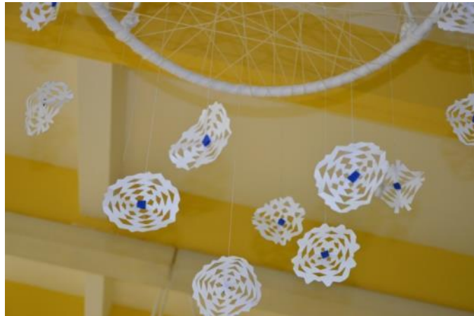
Slika 30: Detajl