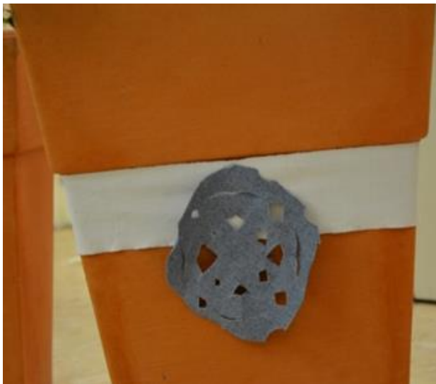
Slika 31: Detajl na posodi

Dekorirali smo tudi oranžne posode za fikuse v jedilnici. Vsaka posoda je imela bel trak in sinje snežinke.