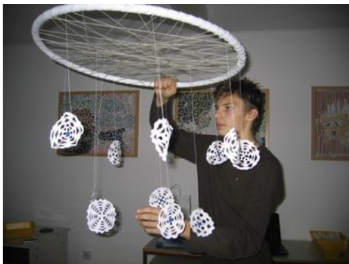
Slika 36: Obešanje obroča