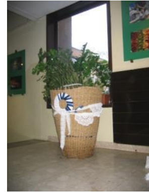
Slika 35: Lonec za rože