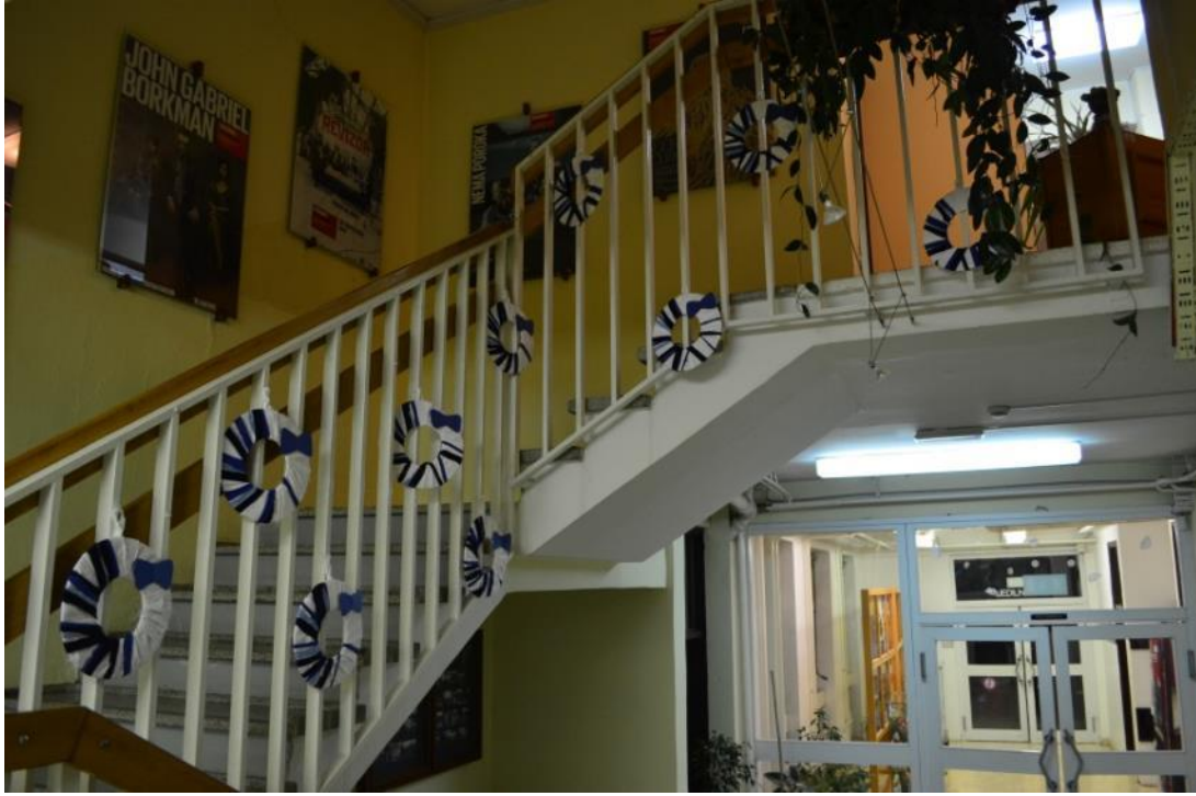
Slika 15: Stopnišče