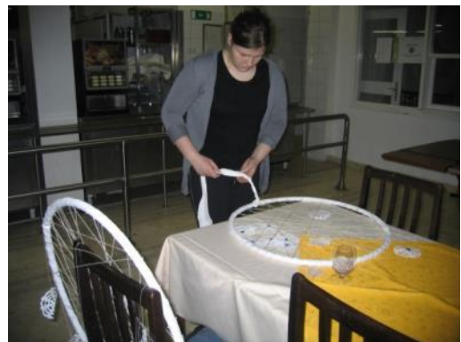
Slika 37: Izdelava obročev