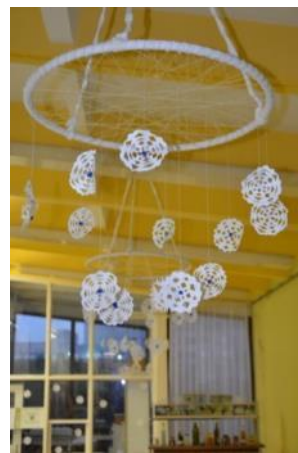
Slika 28: Snežinke (foto: članica likovnega krožka) Slika 29: Eden izmed obročev (foto: članica likovnega krožka)