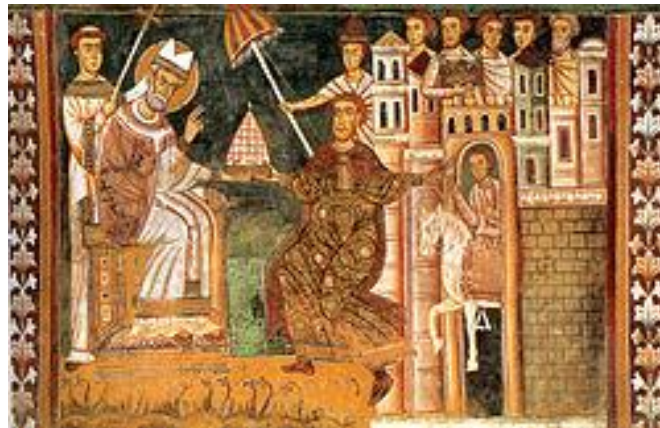
Slika 2: Papež Sv. Silvester ( http://sl.wikipedia.org/wiki/Pape%C5%BE_Silvester_I. )

Slovenci so sprva 31. decembru rekli 'staro leto' ali 'drugi sveti večer', poimenovanje 'silvestrovo' ali 'Silvestrov večer' pa je prišlo veliko kasneje.