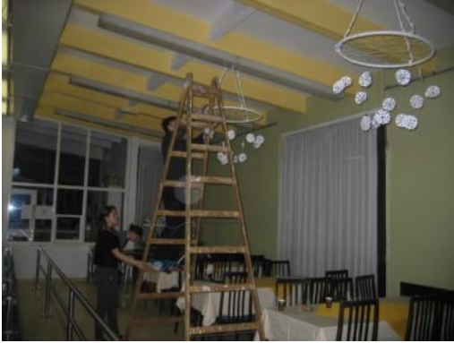
Slika 38: Obešanje