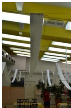
Slika 27: Jedilnica