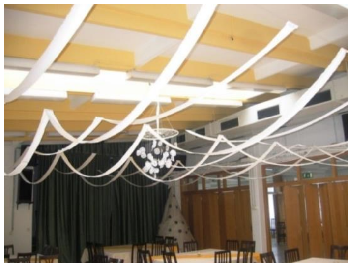
Slika 24: Jedilnica opoldne

Jedilnica je precej velika in visoka. Več rjuh smo razrezali in sešili skupaj ter jih razobesili po jedilnici. Iz trakov smo pustvarili valove. Trakovi so vzpostavili vzporedne linije, ki so delovale mehko. Valovi so delovali lenobno, elegantno in nežno. Ritem valov je razbil bel obroč, ki smo ga postavili na sredino. Obroče (zavržen plastični material) smo zavili v trakove iz domskih rjuh. Z volno smo obroče tudi prepredli in na bele vrvice navezali snežinke iz papirja. Na snežinke smo zalepili majhne kroge modrega blaga, ki pa so jih opazili le redki.