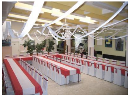
Slika 26: Praznična jedilnica