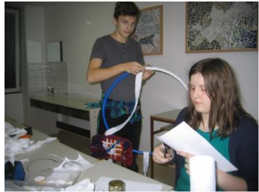
Slika 39: Rezanje in lepljenje