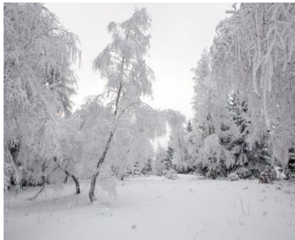
Slika 6: Zima ( http://www.glitter.si/sneg.jpg )

Je nosilka dobrih pomenov, simbolizira dobroto, popolnost, pozitivnost, milino, nežnost... Zato je simbol večnosti in absolutnosti. Ker je bel sneg, jo pogosto povezujemo tudi s hladom. Sciazari (str. 20) piše, da bela pomeni brezmadežno čistost. Ponuja varnost, mir, zavetje, preganja čustveno razburjenost in obup in nam pomaga pri notranjem, duševnem, čustvenem in umskem čiščenju. Navdaja nas z občutkom svobode in brezmejne odprtosti. Preveč bele lahko deluje hladno in vsiljuje občutek osamljenosti. Psihološki učinek bele: mirnost, očiščevanje, hlad, osama, prostor za razmislek. Sciazari (str. 47) predlaga, da bi se naj oblačili ljudje v bela oblačila, če bi se radi zavedali svojega življenja, če bi bili radi iskreni, jasni, dojemljivi za sveže načrte in zamisli, saj daje bela barva čas za predah in razmislek.