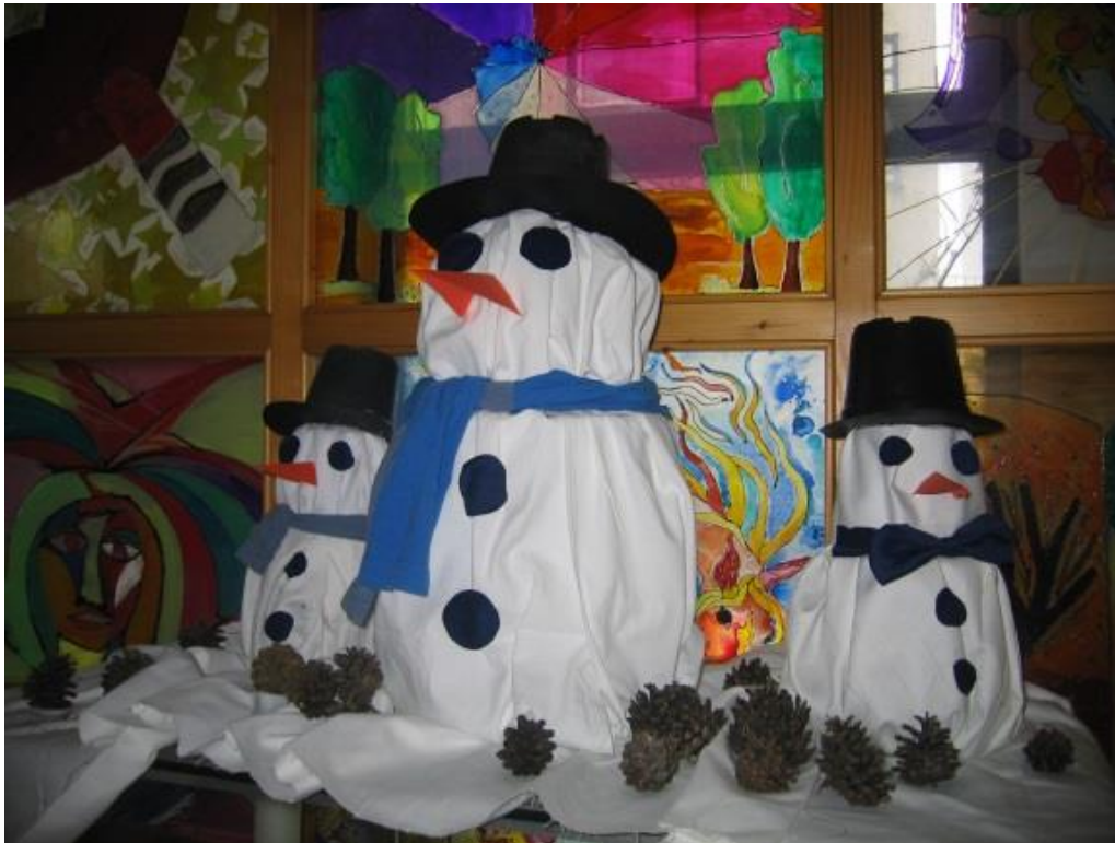
Slika 18: Trije manjši snežaki

Na vitrine smo postavili tri manjše snežake. Pod njih smo postavili storžje, ki smo jih nabrali v okolici dijaškega doma.