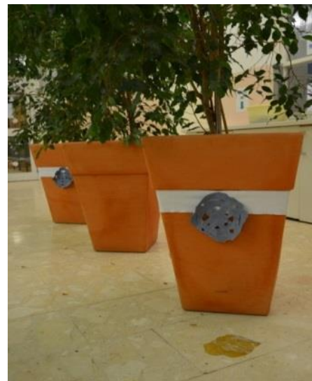
Slika 32: Lonci z rožami