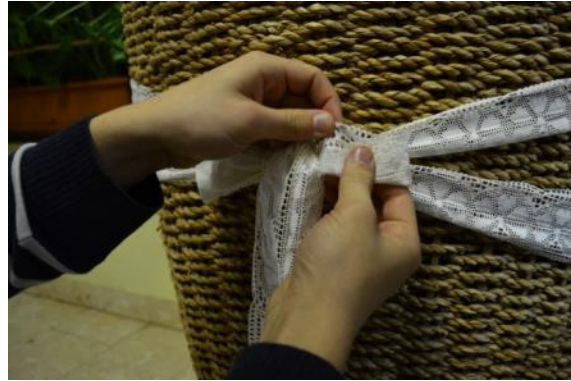
Slika 34: Detajl posode