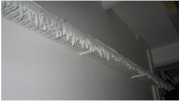
Slika 22: Ledene sveče