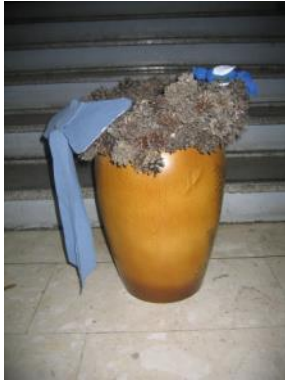
Slika 33: Vaza

Preostale posode smo prav tako dekorirali z blagom in ptički. Okrašene vaze so se dobro vklopile v celotno novoletno podobo doma.