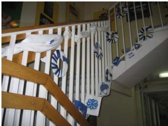
Slika 16: Dekoracija stopnišča (članica likovnega krožka)