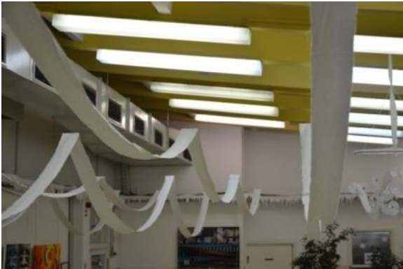
Slika 25: Strop jedilnice