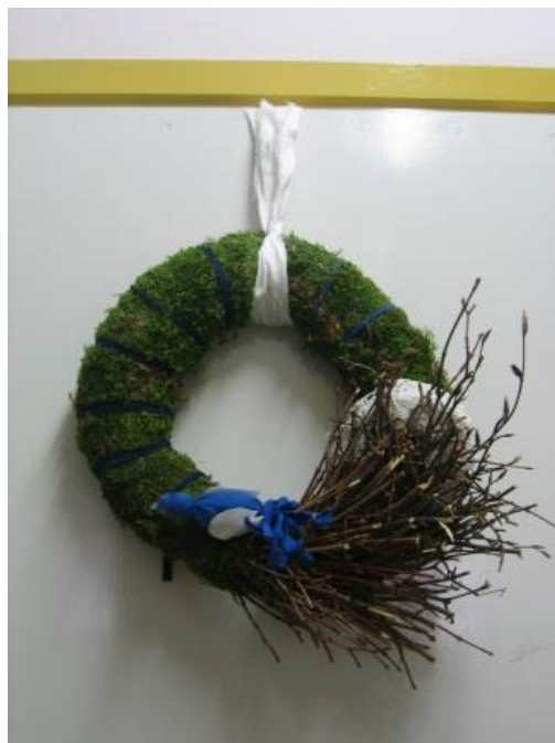
Slika 11: Adventni venček

Na vrata smo obesili adventni venček. Na njem je modri ptič iz blaga, ki se prav tako lahko nadaljnje uporabi pri krasitvi februarja, saj se ptički ženijo prav na Gregorjevo. Ptič je simbol svobode in kliče po pomladi. Poleg blaga je venček izdelan še iz mahu in drevesnih vej.