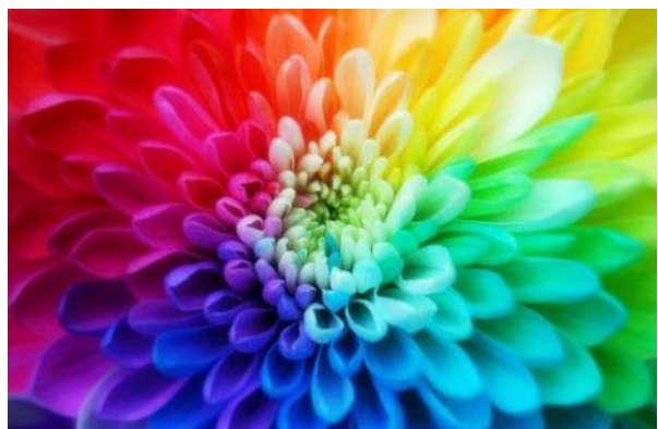
Slika 4: Barve v roži ( http://www.slikopleskarstvo-rbt.si )