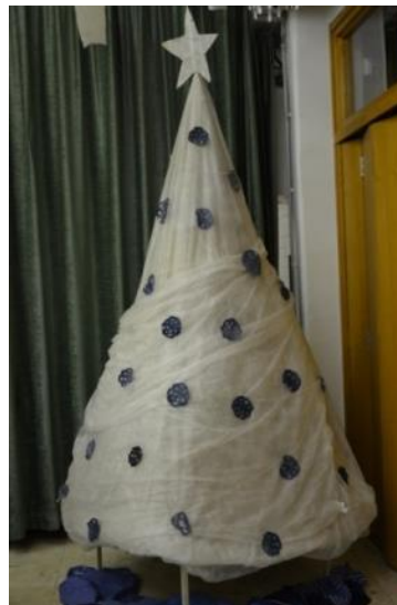
Slika 21: Novoletna smreka

V jedilnico smo postavili tudi smreko, ki smo jo prav tako naredili iz odpadnih cunj in že večkrat uporabljene koprene. Na vrh smreke smo postavili zvezdo, edini element, ki je ostre oblike.