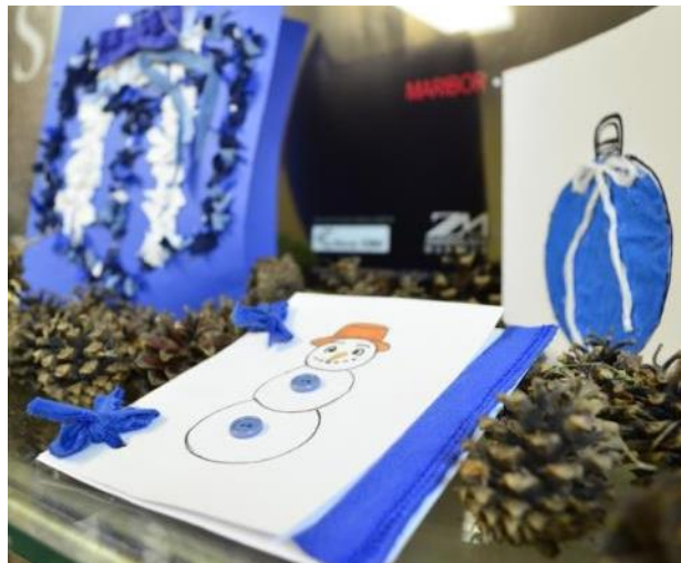
Slika 14: Čestitke iz blaga in papirja