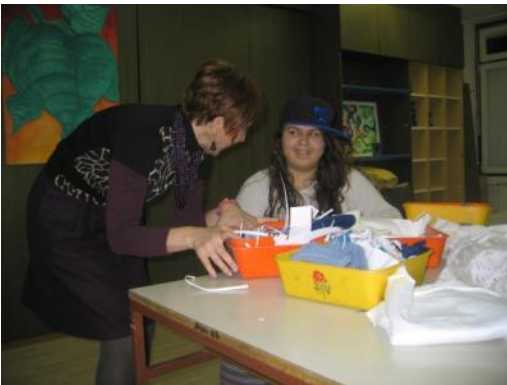
Slika 40: Uporaba plastike