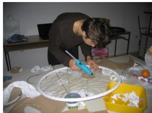
Slika 43: Ustvarjalni nered