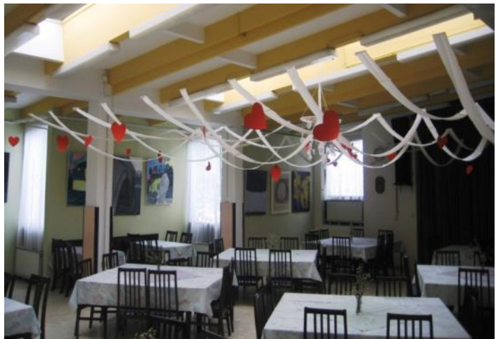
Slika 46: Posoda (foto: članica likovnega krožka) Slika 47: Jedilnica za valentinovo (foto: članica likovnega krožka)