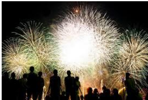
Slika 1: Novoletni ognjemet

Novo leto je začetek novega koledarskega leta, je praznični čas, ko se staro leto poslavlja in zapira vrata, novo pa svoja odpira. Za zaprtimi vrati se skriva ogromno ljubezni, sovraštva, veselja, žalosti, ogromno prehojenih poti in premaganih ovir. Zaprta vrata novega leta, ki pa se šele odpirajo, čakajo na nove začetke in nadaljevanja starih poti, čakajo na nove zaobljube, na nove cilje.