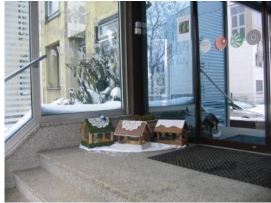
Slika 10: Vhod