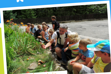
... raziskovanje in