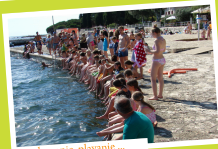
kopanje, plavanje ...