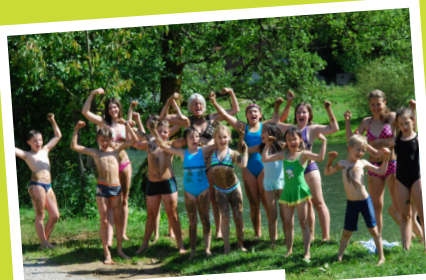
kopanje, plavanje ...