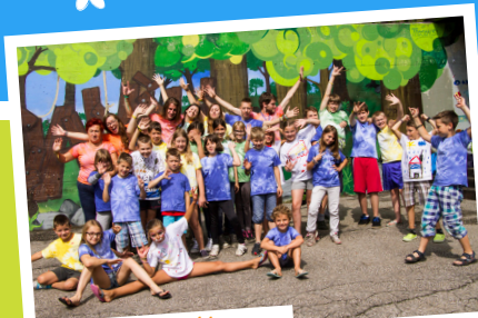
... ponosni in