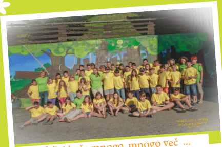
različni in še mnogo, mnogo več ...