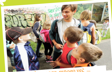
... in še mnogo, mnogo več ...